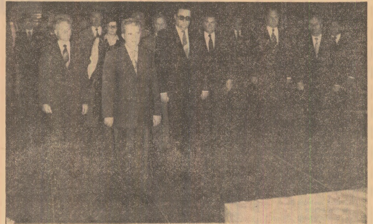
La Mausoleul lui Klement Gottwald

Schimbul de opinii în probleme internaționale va continua în următoarea rundă de convorbiri. Convorbirile se desfășoară într-o atmosferă de prietenie, cordialitate și înțelegere reciprocă.