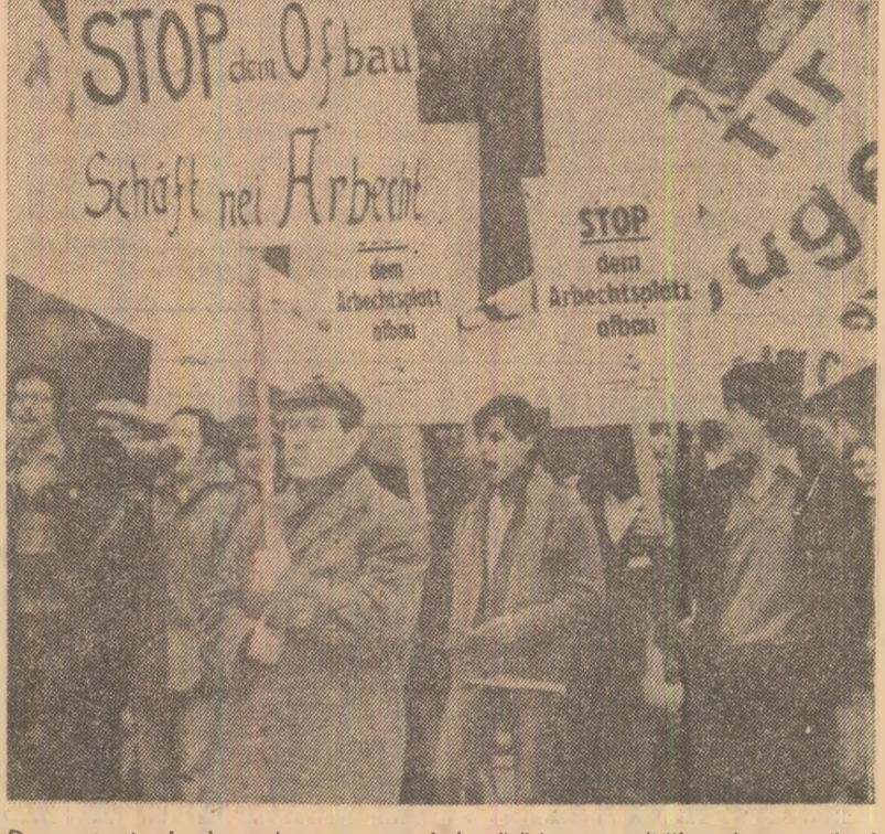
Demonstrație la Luxemburg pentru îmbunătățirea condițiilor de muncă și de viață

Partidul Comunist din Spania, SANTIAGO CARRILLO, care subliniază că „acțiunile teroriste servesc numai întăririi extremei drepte și creării unui climat de tensiune” - ceea ce împiedică dezvoltarea unei luple „reale și eficiente” de către terorismul și continua, nu va exista nici o garanție împotriva unor noi tentative de lovitură de stat.