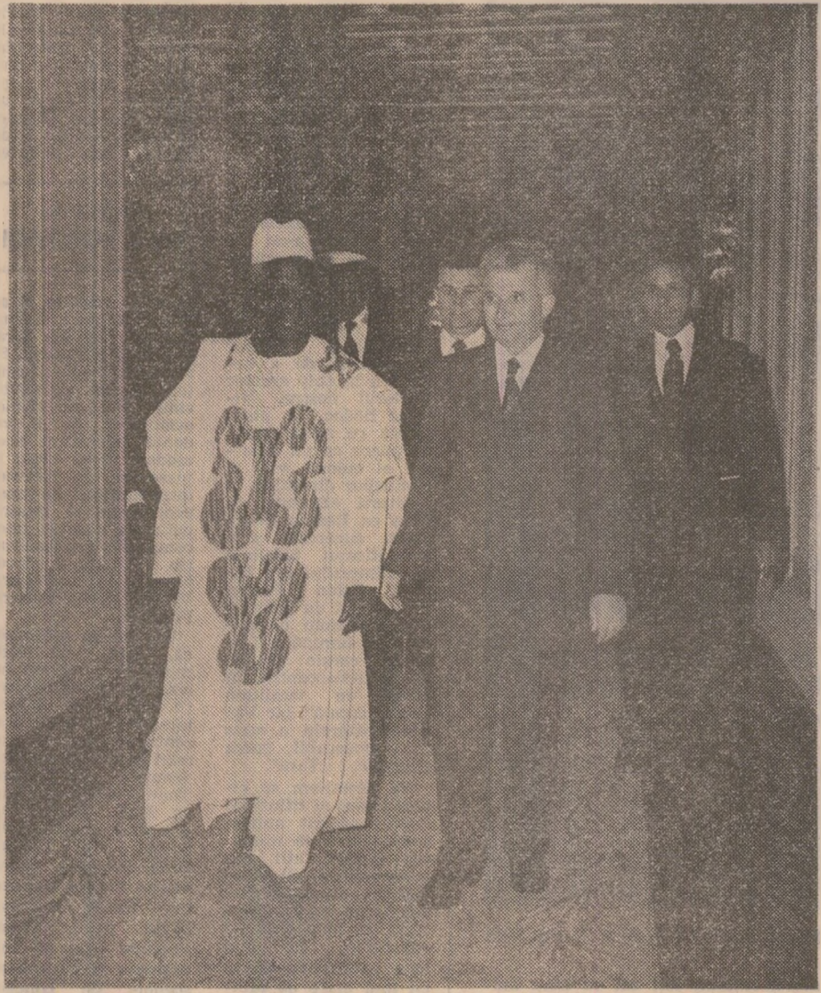
a trăi într-o lume care să le asigure pacea, libertatea, independența, dezvoltarea de sine stătătoare, pe calea progresului economic și social.

Totodată, a fost manifestată convingerea că, în spiritul înțelegerii stabilite, România și Ghana vor întări conlucrarea lor în viața internațională, aducîndu-și, prin eforturi și acțiuni unite, o contribuție activă la crearea unui climat de destindere, securitate și cooperare în Europa, Africa și în întreaga lume, la înfăptuirea aspirațiilor legitime ale popoarelor de