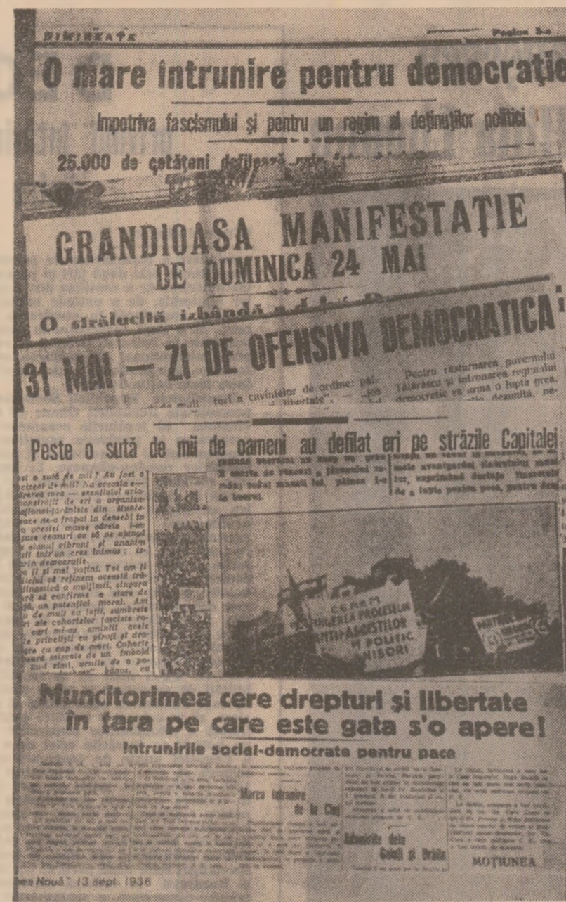
Presă epocii despre grandioasele manifestații populare de la 24 și 31 mai 1933