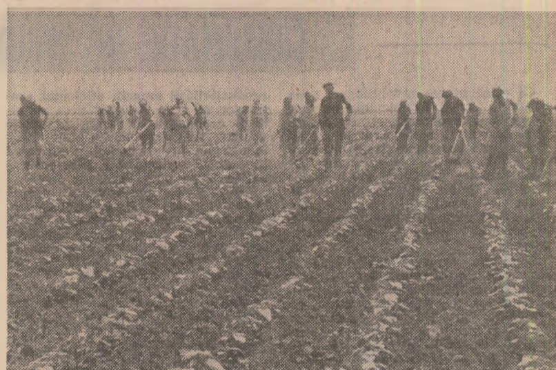
Amplă concentrare de forţe la lucrările de întreţinere a culturilor în unităţile agricole din judeţul Ialomiţa (prima fotografie) şi manual — la floarea-soarelui — la C.A.P. Georgehe Doja (fotografia a doua)