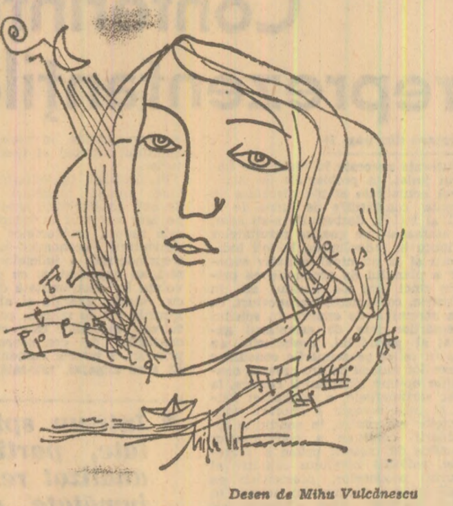
Desen de Miha Vădulescu

nii să și conducîndu-se după sensurile mitrice ale titlului lui Orfeu Tracul. Toate acestea vibrează în armonia cu frumusețea și suflătoarea și fizică, de parcă ne-ar apărea precum un nou Amphion căzînd Teba în climatul estetic al muzicii. Nu a fost nici un expresionist, nici un arid neoclasic, nici un rafinat post-impresionist, nici un etnograf. El a fost, este și va rămîne un muzician român, un artist, un simbol al spiritualității poporului nostru. Inca de cite ori intrăm în cadrul muzicii sale simțim că el a cîntat, cîntă și va cînta doin-