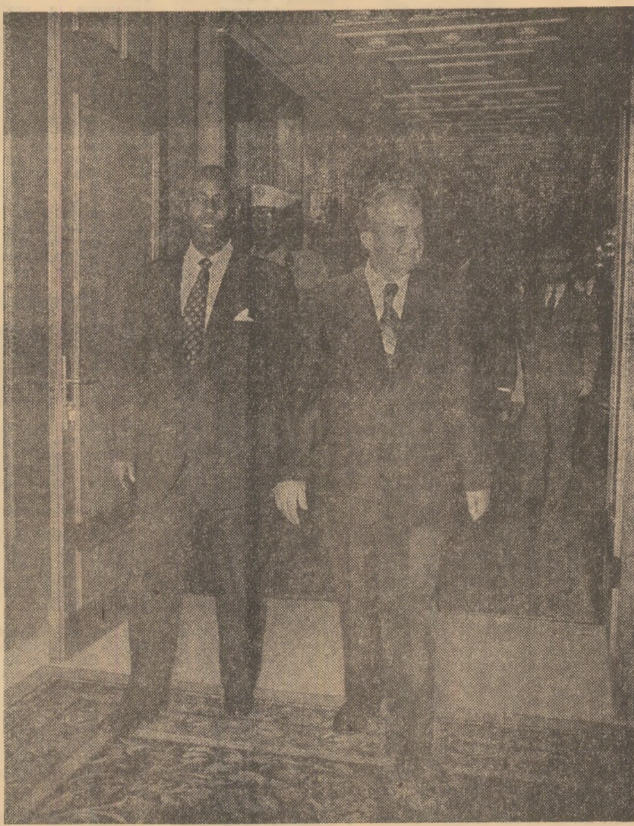
La înfăptuirea aspirațiilor legitime de pace, libertate, independență și dezvoltare de sine stătătoare ale tuturor popoarelor lumii.

A fost manifestată convingerea că, în spiritul celor convenite, România și Somalia vor dezvolta și în viitor colaborarea pe arena internațională, aducîndu-și în continuare o contribuție tot mai activă la realizarea unui climat de destindere, securitate, înțelegere și cooperare în Europa, Africa și în întreaga lume.