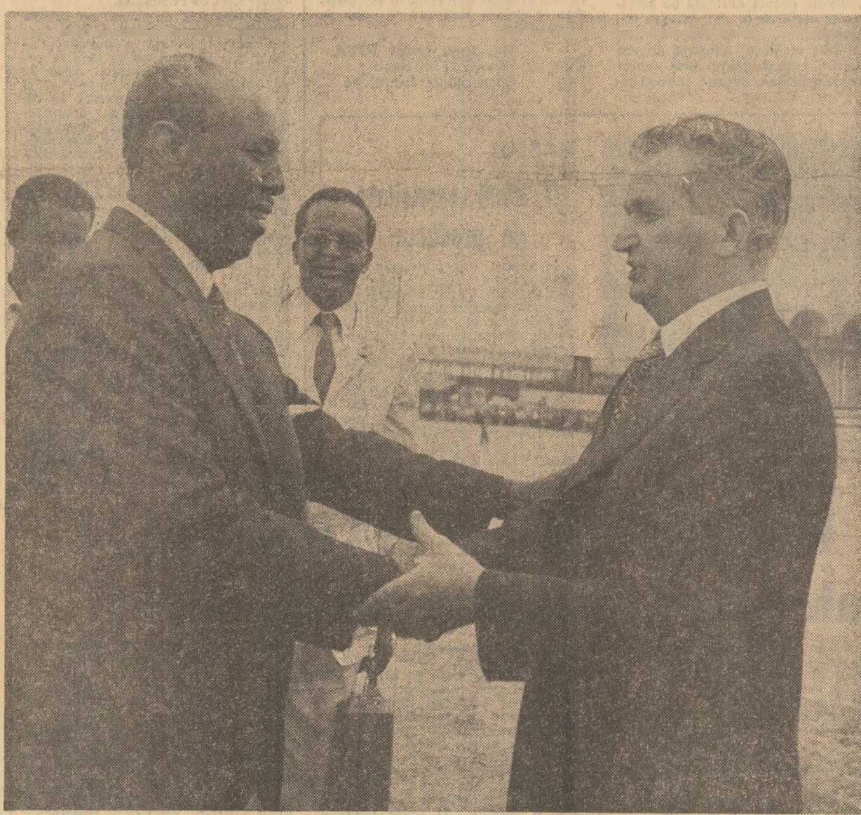
IN PAGINA A III-A: Comunicatul româno-somalez

În încheierea solemnă a încheierii Nicolae Ceaușescu și Mohamed Siad Barre au ciocnit o cupă de șampanie pentru continuarea dezvoltării și amplificării prieteniei și colaborării româno-somaleze, în folosul și spre binele ambelor țări și popoare, al cauzei generale a păcii, înțelegerii, destinderii și concilierii între toate popoarele lumii.