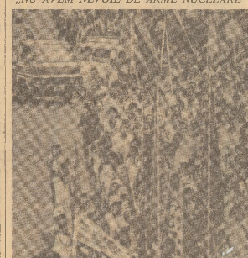
Zeci de mii de japoanezi au demonstrat împotriva prezenței pe teritoriul țării sau în apele sale teritoriale a armelor nucleare. Valul de proteste a fost determinat de revenirea noului guvern și de faptul că avionul american „Midway” care, potrivit declarației secretarului general al Partidului Socialist din Japonia, Ichio Asukata, ar purta la bord arme nucleare cu o forță de distrugere de 10 megatone. După ce au străbătut peste patru km pe străzile capitalei nipone, demonstranții au participat la o mare adunare populară în parcul Yoyogi, iar apoi s-au îndreptat spre clădirea parlamentului pentru a înmîna deputaților revendicările lor. Pe pancartele purtate era scris: „Nu avem nevoie de arme nucleare”, „Nu permitem aducerea armelor nucleare în Japonia!”. Manifestațiile antinucleare desfășurate în Japonia (fotografia de sus reprezintă un aspect de la demonstrația de la Tokio) au fost — potrivit agenției Kyodo — „printre cele mai mari de acest fel cunoscute în ultimii ani”.