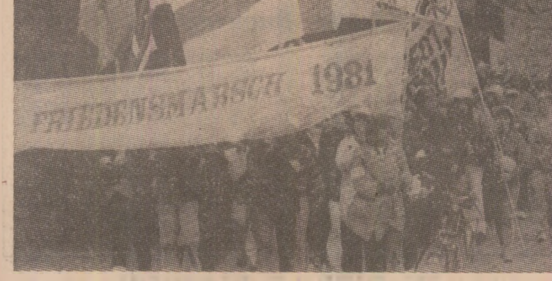
Participanți la „Marșul păcii” Copenhaga-Paris, străbătînd prima etapă a itinerarului, pe teritoriul Republicii Federale Germania

goceri prin care să putem stopa cursa nebunescă a înarmărilor”. Este conștient că inițiativa creării unei zone denuclearizate în nordul Europei a fost lansată pentru prima oară în 1963 de președintele Finlandei, Urho Kekkonen, inițiativă extinsă în 1978 și menținută în permanență actualitate de factorii responsabili de la Helsinki: în opinia oficialităților finlandeze, concretizarea acestui demers ar urma să ducă la încheierea unui accord garantat de marile puteri prin care nordul Europei să fie deplin ferit de efectele și repercusiunile strategiei nucleare, în general, și ale noii tehnologii a armelor nucleare, în special.”