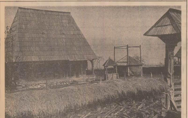
LA SIGHETU MARMAȚIEI: