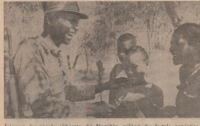
Într-una din zonele eliberate din Namibia, militarii din forțele patriotice iau parte la compania de educare a tinerii generații