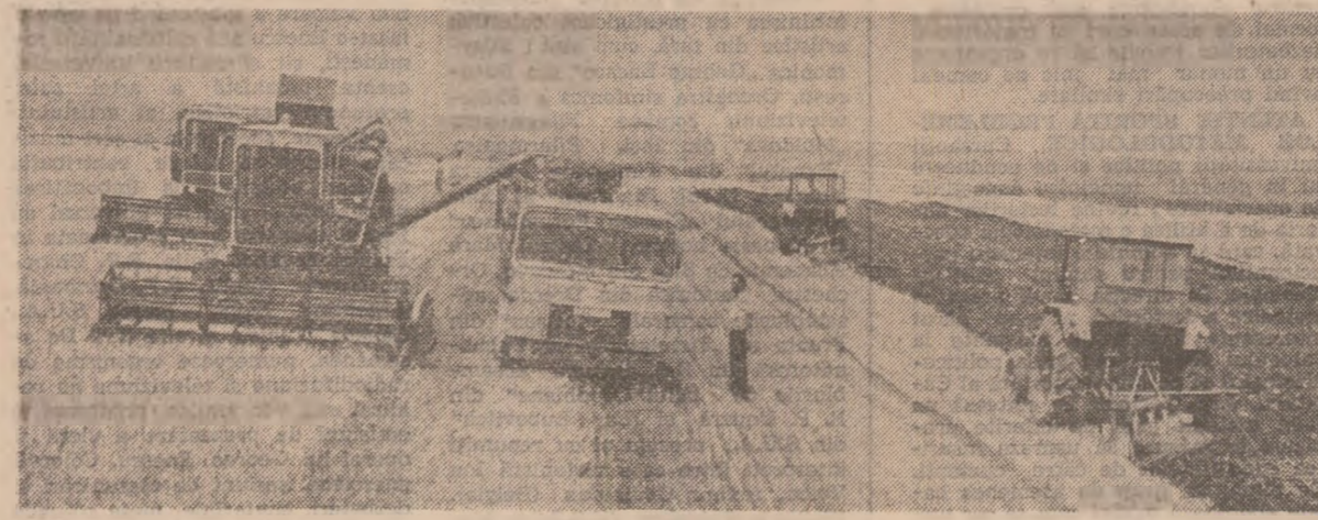
În flux continuu — recoltat, pregătirea terenului și semănătură culturilor succesive — la C.A.P. Amara, județul Buzău.