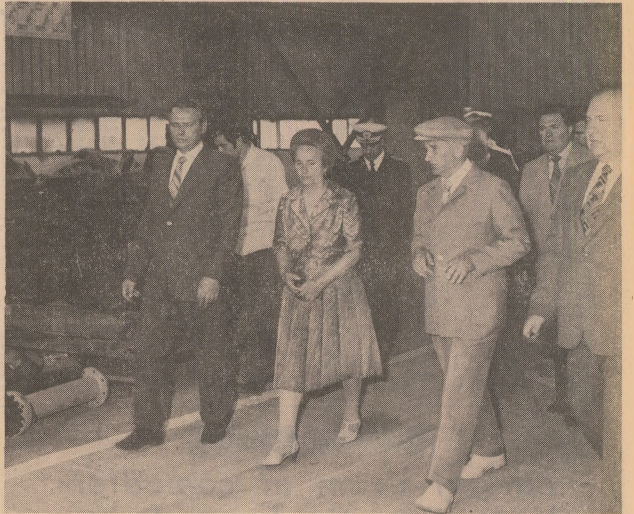
La Șantierul naval Constanța