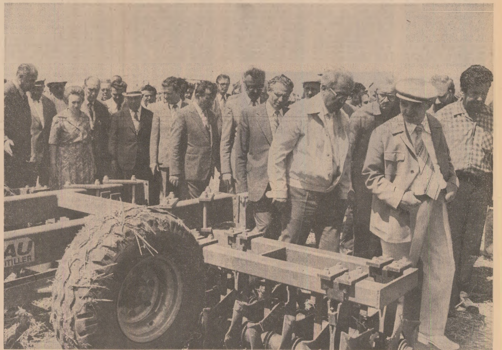
Se examinează noile modele, îmbunătățite, de mașini agricole

Tovarășul Nicolae Ceaușescu, tovarăsa Elena Ceaușescu asistă apoi la o demonstrație de manipulare a containerelor cu ajutorul unui auto-