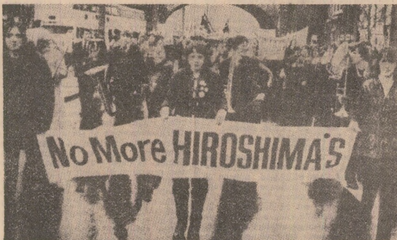
Manifestația la Londra împotriva proiectelor de amplasare a unor noi arme racheto-nucleare

ÎN PUTERNIC CUTREMUR DE PAMINT — aproximativ 7-7,2 grade pe scara Richter — s-a înregistrat, miercuri, în zona insulelor Vanuatu, din sudul Pacificului, a anunțat Centrul american de geologie de la Holden, statul Colorado. Nu se cunosc date privind consecințele acestui puternic seism.