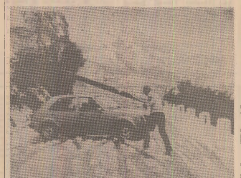
Peisaj de larmă în... mizocul verit. În urma îndrăgîțării neașteptate a timpului, un automobil blocat de zăpadă pe una din șoselele Elveției

UR.R.S.S. Asupra orașelor Volhov, Tihvin și Novala Ladoga, situată la 100 kilometri est de Leningrad, s-a abătut un uragan. Vîntul a smuls din rădăcini arborii seculari și acoperișurile mai multor case, a dărîmat mai mulți stîlpi ai liniilor de înaltă tensiune. Uraganul a durat 40 de minute, după care vîntul s-a liniștit. Nu s-au înregistrat victime, dar echipe speciale au fost nevoite să lucreze o noapte întreagă pentru a repune în funcțiune liniile de telecomunicații și de transport al energiei electrice.