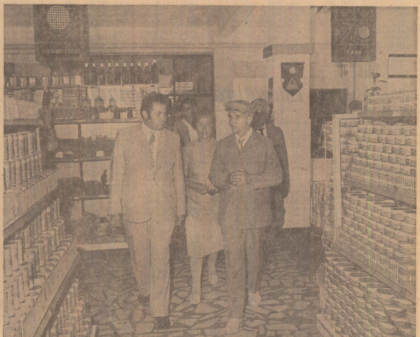
În piaţa agroalimentară din Tulcea