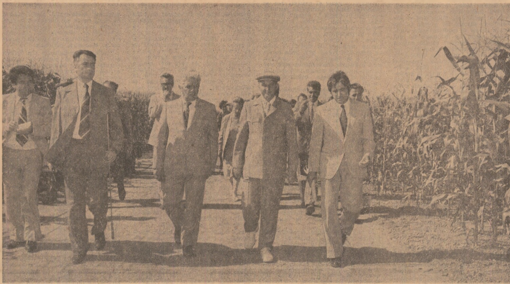
Se vizitează Centrul de cercetări agricole Mihail Kogălniceanu

Tovarășul Nicolae Ceaușescu, secretar general al Partidului Comunist Român, președintele Republicii Socialiste România, a început miercuri, 5 august, o vizită de lucru în unități agricole și industriale din județul Tulcea. Împreună cu secretarul general al partidului se află tovarășii Elena Ceaușescu, tovarășii Emil Bobu, Cornel Burtică, Gheorghe Oprea, Gheorghe Pană, Ștefan Andrei.