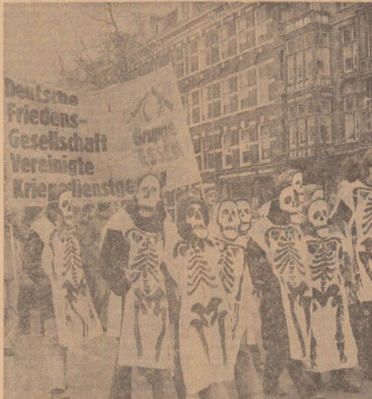
Peste 20.000 de militanți pentru pace din Olanda, Belgia și R.F. Germania demonstrează la Amsterdam împotriva înarmării nucleare