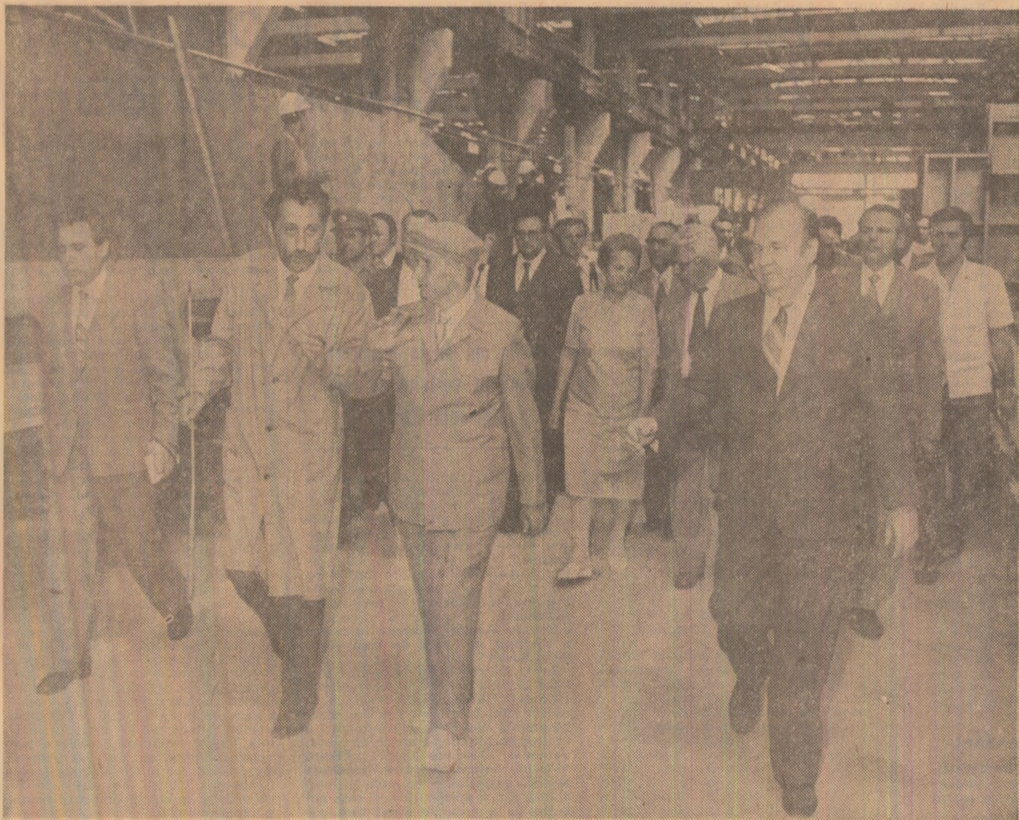
Printre constructorii de nave şi de utilaj tehnologic din Tulcea