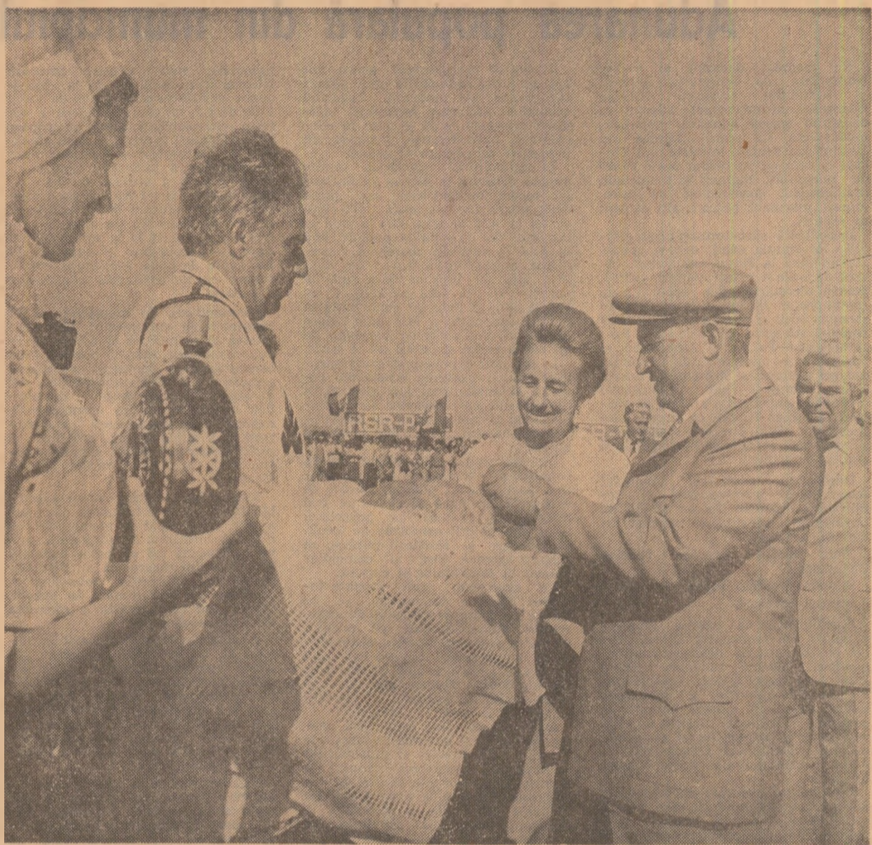
Primire, după datină, cu piine şi sare, la Centrul de cercetări M. Kogălniceanu

Cu această convingere şi cu această dorinţă, vă urez, încă o dată, succese tot mai mari în întreaga activitate; multă sănătate şi multă fericire! (Aplauze şi urale puternice; se scandează minute în şir „Ceaulescu — P.C.R.” „Ceaulescu şi poporul!” „Ceaulescu — pace!”). Toţi cei prezenţi la marea adunare populară ovaţionează într-o atmosferă de puternic entuziasm pentru Partidul Comunist Român, pentru Comitetul său Central, pentru secretarul general al partidului şi preşedintele ţării, tovarăşul Nicolae Ceaulescu.