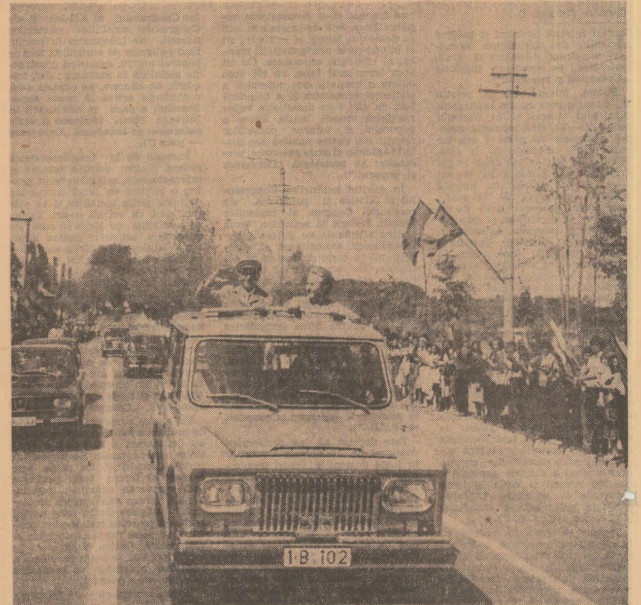
Primerie entuziastă în municipiul Tulcea