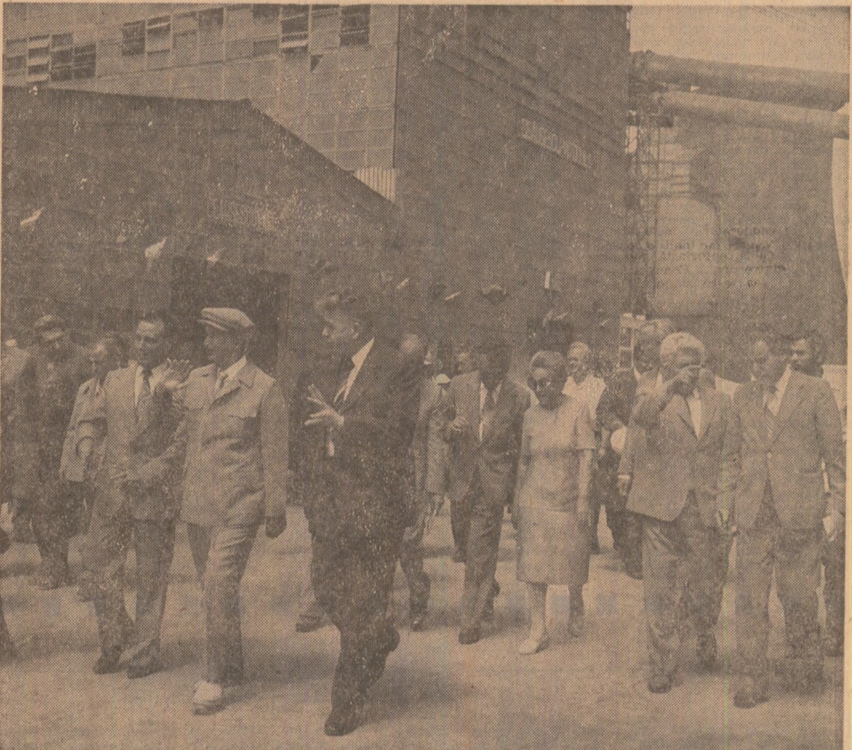
Pe noua şi marea platformă a metalurgiei tulcene