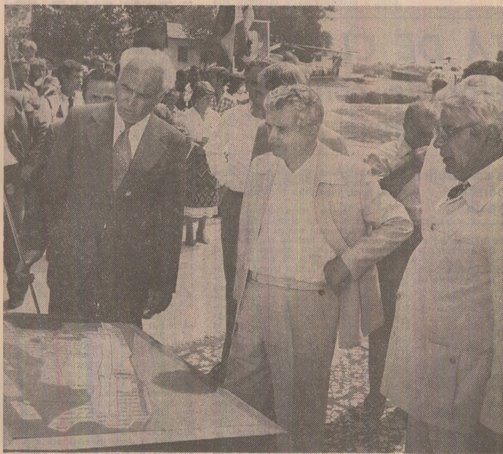
Se pregătesc pentru noua înfățișare a comunei Sfîntu Gheorghe