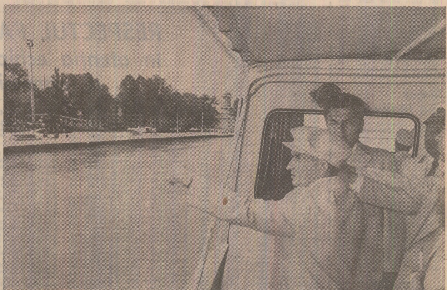
Se dau indicații privind dezvoltarea portului Sulina

În întîmpinarea mării noastre sărbători naționale