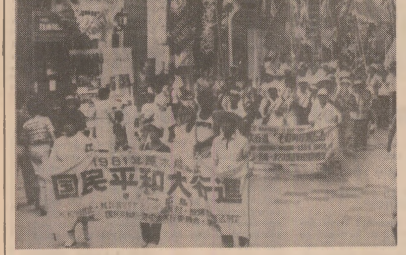
Aspect de la marele miting organizat în Parcul memorial pentru pace din Hiroshima