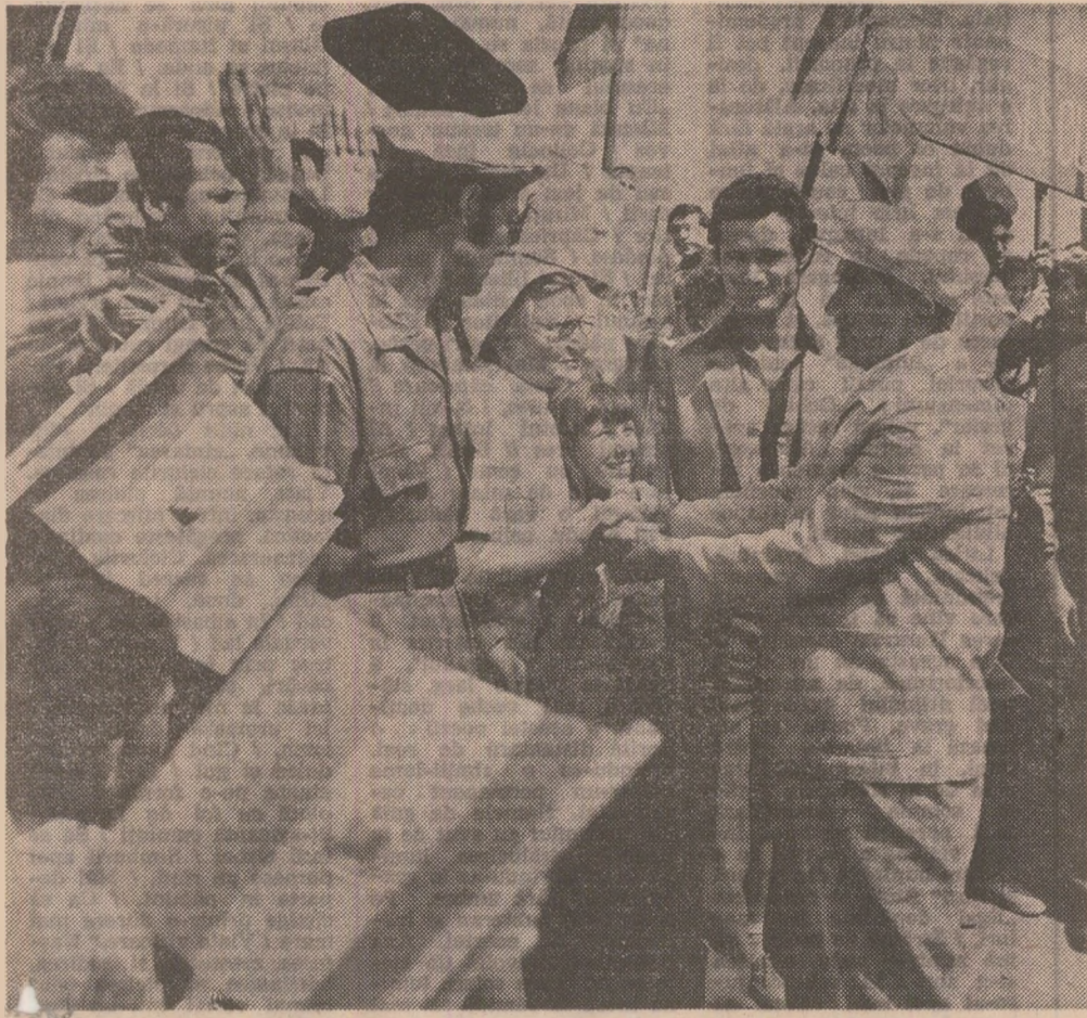
Primire entuziastă, încercată de căldură pentru secretarul general al partidului