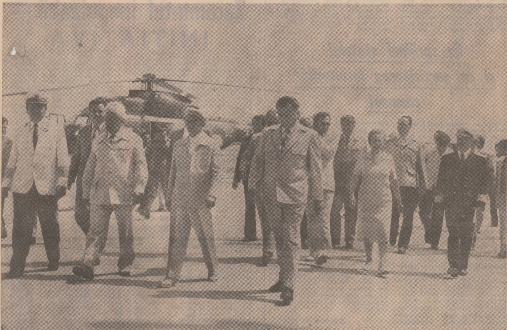
Un nou moment al vizitei în județul Tulcea. Imagine de la sosirea în oraș-port Sulina

Sulina — vechi și cunoscut port de la vărsarea Dunării în mare — a primit joi, 6 august, vizita de lucru a secretarului general al partidului, președintelui Republicii Socialiste România, tovarășul Nicolae Ceaușescu, în cea de-a doua zi a dialogului purtat cu locuitorii județului Tulcea.