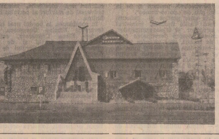
În fotografie: hanul „Şurianu”.