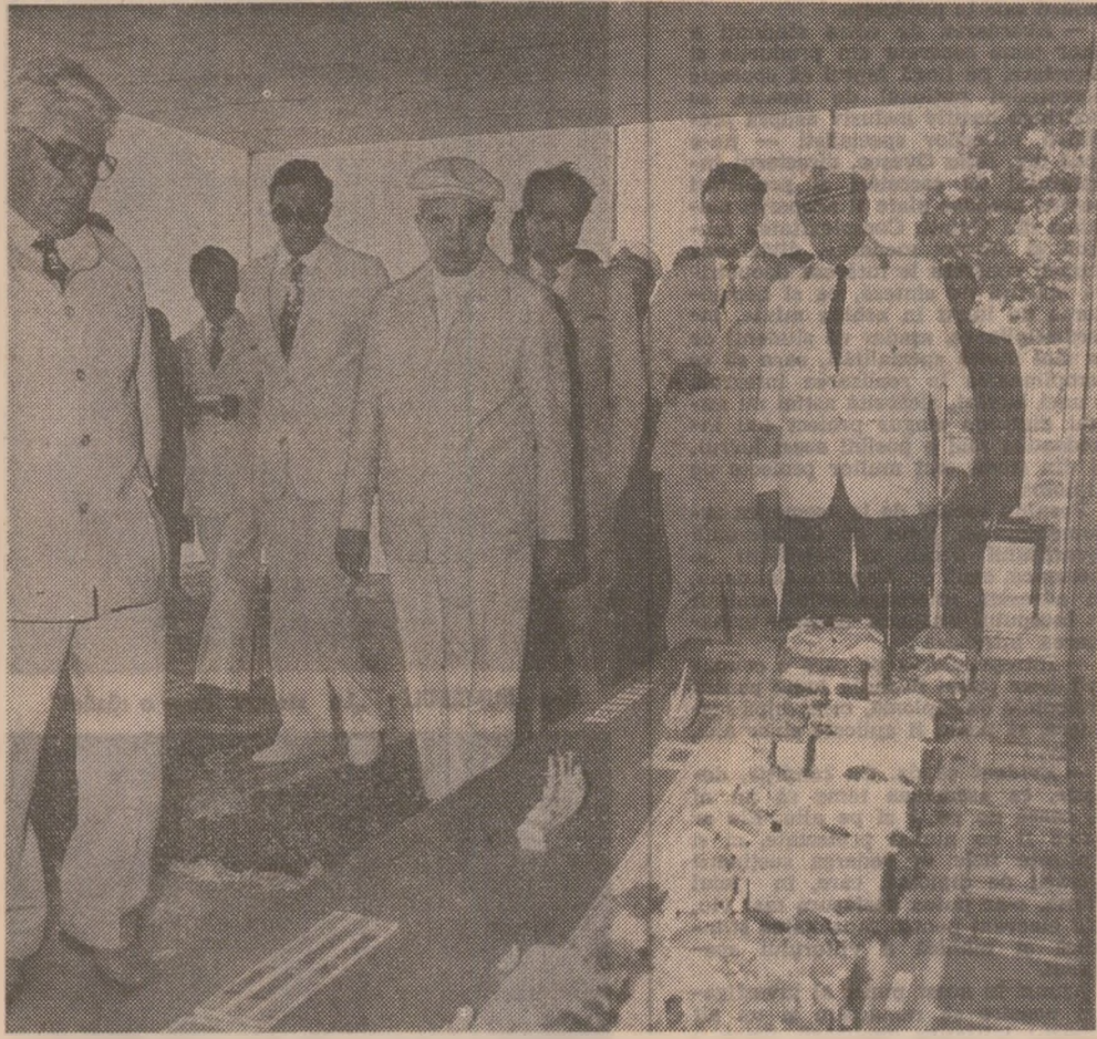
Secretarul general al partidului I se prezintă macheta de sistematizare a oraşului Sulina