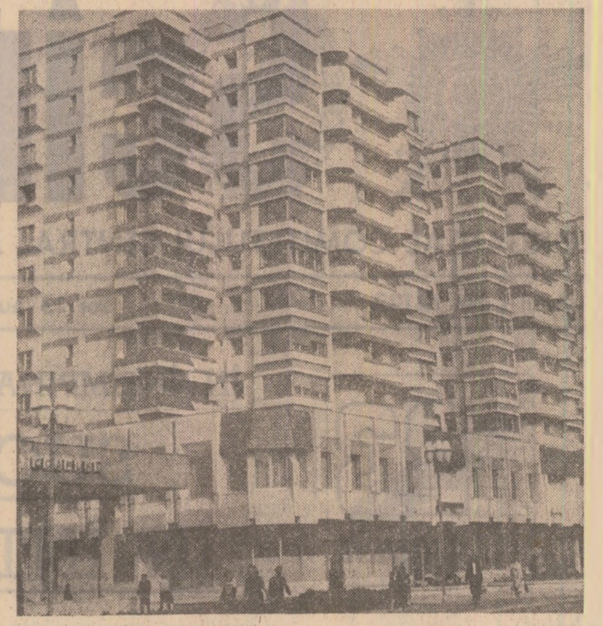
Noi construcții de locuințe în municipiul Bacău

Deși, dar pe platoul Bur- cegilor turistii sînt tot