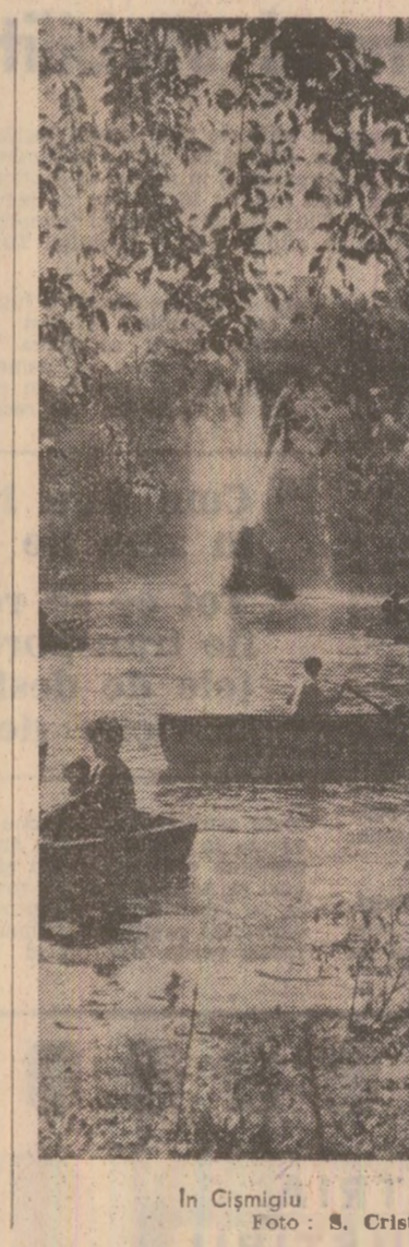
În Cișmigiu

gospodăria este mai rațională a fondului nostru cinegetic? — Asociația noastră, care numără peste 200.000 vînători și pescari, gospodărește 18.000 hectare, ceea ce reprezintă circa 7% la sută din teritoriul cinegetic al țării. O preocupare permanentă a activului asociației și a vînătorilor este aceea de a menține în stare corespunzătoare și dezvoltare în comună baza materială de care dispunem. Într-o concepție unitară, împreună cu silvicultorii, vînătorii gospodăresc fondul cinegetic național în scopul dezvoltării economiei vînătorului, ocrotirii și protejării speciilor, menținerii echilibrului ecologic, al conservării și îmbunătățirii mediului natural pentru muncă, creșterii potențialului biologic al faunei prin selecție și dirijare genetică. Acționînd pe linia obținerii unor exemplare viguroase și cu trofee deosebite, asociația noastră efectuează sau contribuie anual la colonizările cu urs, căprioară, cerb, capre negre, iepuri și fazani din zonele bine populate, pentru sporirea efectivelor și realizarea unor exemplare sănătoase. În fața acestor probleme, în anul 1980 peste 150.000 pui de destinație populației fondurilor care au condiții prielnice pentru acest vînat. De asemenea, cultivăm terenuri pentru hrană, executăm sărării, hrănitori, observatoare, poteci și alte amenajări. Pe toate terenurile de vînătoare se efectuează sistematic combaterea dăunătorilor vînătorului, precum și a