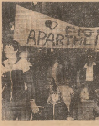
În Noua Zeelandă au avut loc demonstrații de protest împotriva politicii de apartheid și discriminare rasială...