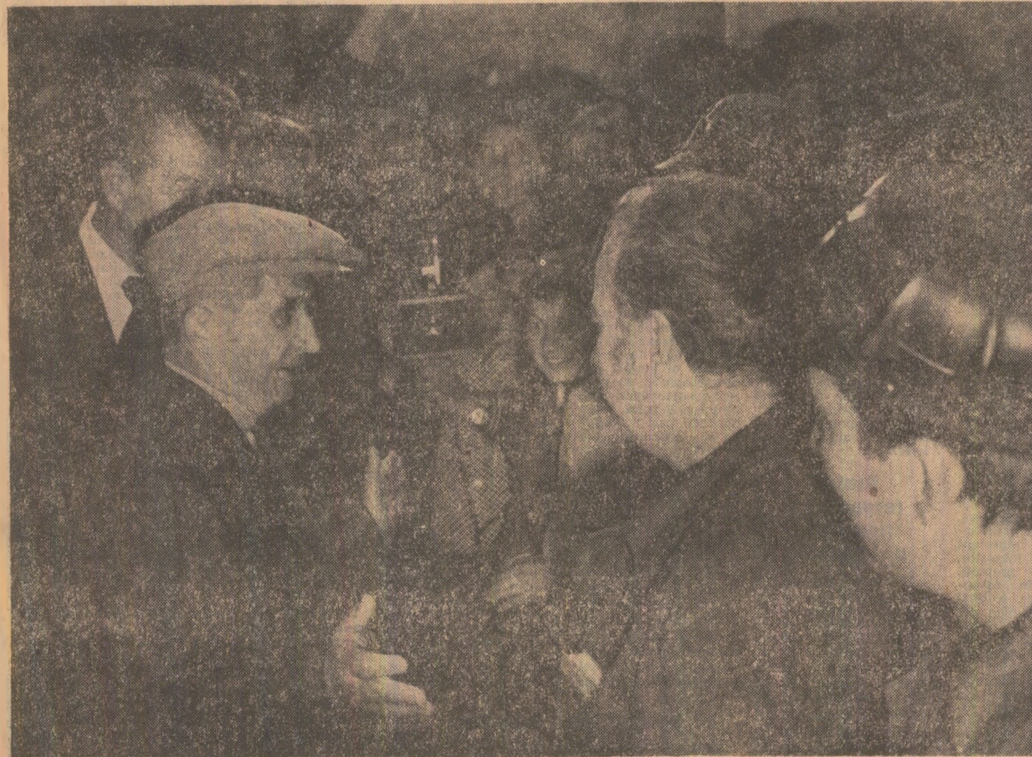
În mijlocul muncitorilor de la Întreprinderea de utilaj chimic

Secretarul general al partidului apreciază produsele expuse, subliniînd, totodată, că este necesar ca, printr-o mai bună organizare a muncii, prin creșterea densității plantațiilor, prin aplicarea strictă a regulilor agrozootehnice, prin creșterea numărului de păsări și animale, cit țărării cooperativi din comună, cit și agriculturii întregului județ pot să-și