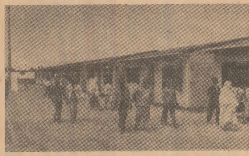
Sute de familii din regiunea El Asnam (Algeria), greu încercată de cutremur în octombrie 1980, locuiesc de pe acum în aceste construcții solide, realizate din elemente prefabricate...