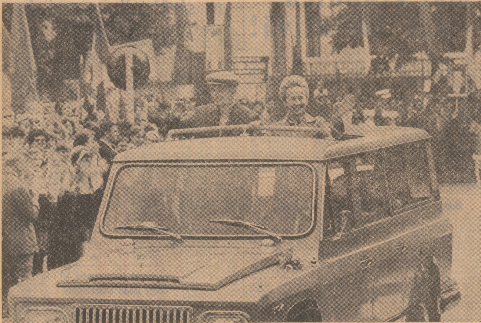
Primire caldă, entuziastă făcută de oamenii muncii din municipiul Ploiești