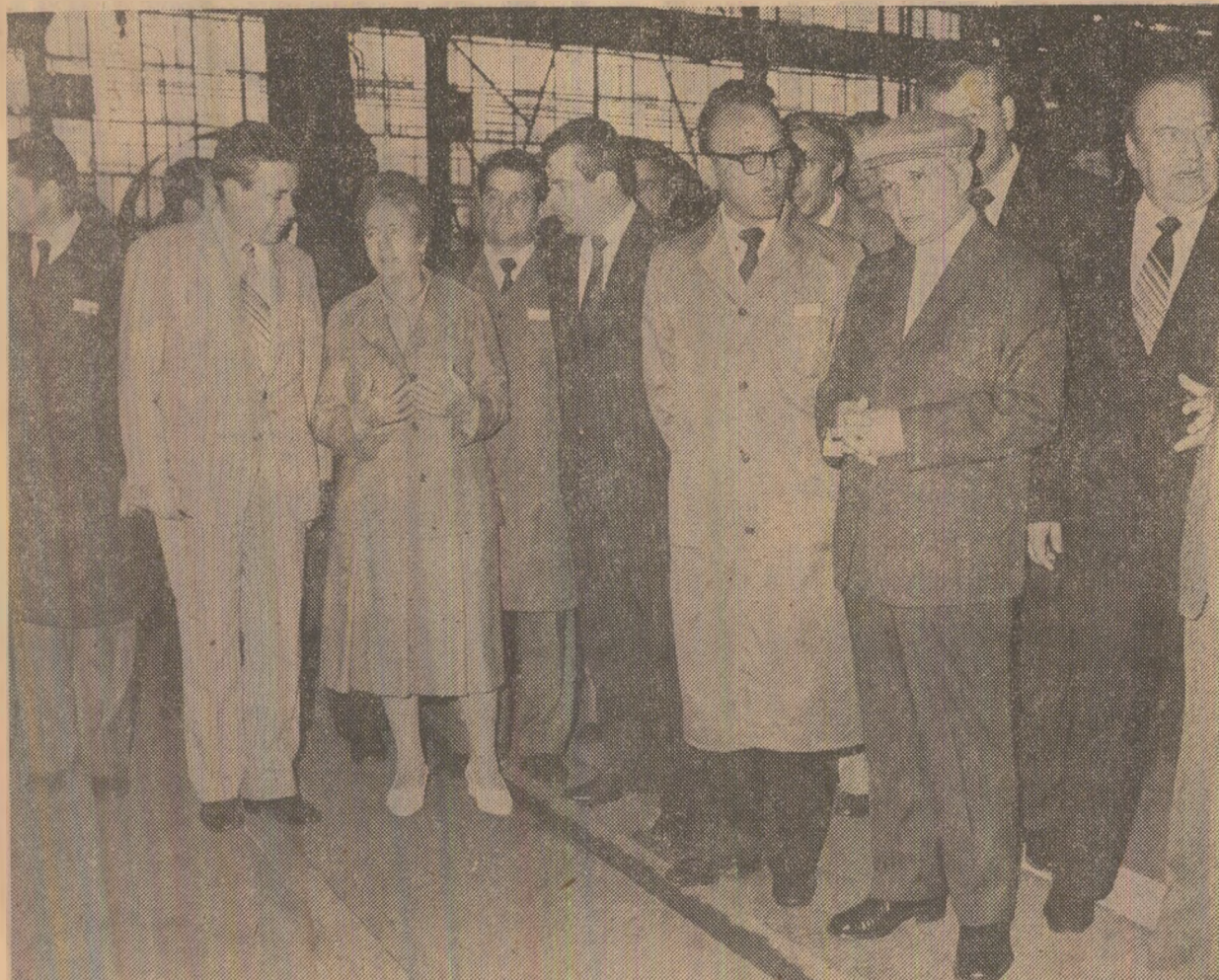
Se vizitează secțiile de producție ale Întreprinderii de utilaj chimic din Ploiești

Intr-adevăr, ceea ce s-a încheiat în asemenea momente, acolo, la Brașov, în citadela industrială, era un contract de valoare morală și de lungă, lungă durată. El exprimă legătura mai strînsă și legămintul mai hotărît de a învata de la constructorii României de azi, mîndria pentru puterea industriei românești, admirația și forinla de a săvîrși fapte pe măsura comunistilor. Sub cupola de azur carpatic a zilei de august, copiii țării descoperă la Brașov ceva din taina orin care patria este mereu mai puternică iar fanetele oamenilor săi aduce tot mai aproape vitorul.