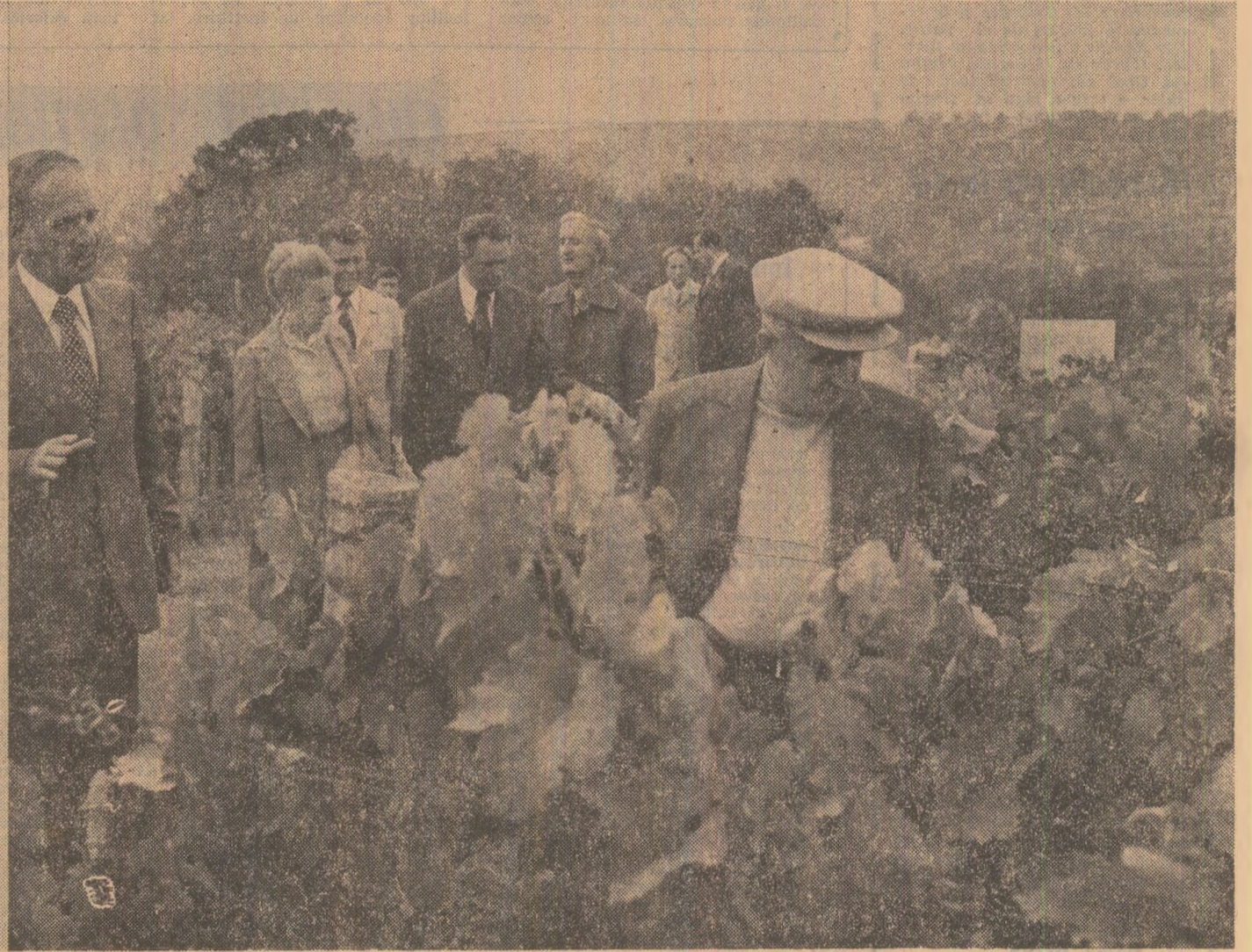
Într-una din plantațiile de viță de vie de la Valea Călugărească