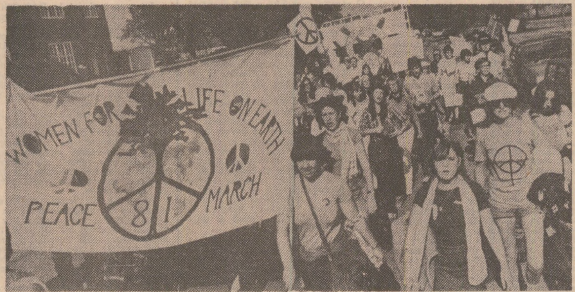
Sub această deviză, în Marea Britanie a avut loc un marș inițiat de mai multe asociații de femei, cu sprijinul a numeroase organizații politice, obștești și religioase britanice. După ce au străbătut 110 mile, pornind din orașul Cardiff, participantele la marș au organizat un miting în fața uneia din bazele militare unde se preconizează amplasarea de noi rachete cu rază medie de acțiune, condamnăm escadarea înarmărilor nucleare și pronunțându-se pentru înfișțuirea unor măsuri concrete de dezarmare.