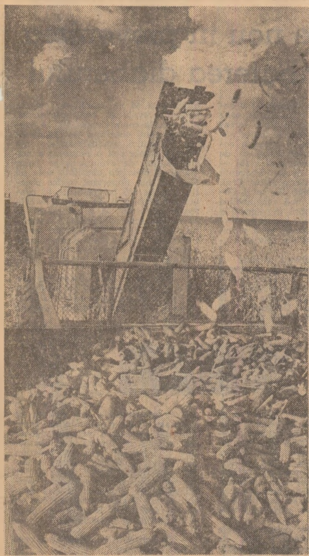
Combine în lanul de porumb la ferma nr. 8 Movilița a I.A.S. Aflumăț (Județul Ialomița).

Lanurile de porumb cunosc în aceste zile freamătul muncii la culcuș: mi de combine, zeci de mii de oameni strâng roadele acestui an. Se recoltează de asemenea sfecla de zahăr, legumele, cartofii, fructele și strugurii. Este actul final al marii bătălii a recoltei desfășurate timp de un an. Fiecare bob de porumb, fiecare fruct însumeză în el muncă. Adușate la un loc, ele formează producția agricolă a întregii țări, pentru făurirea căreia a muncit întregul nostru popor. De aceea, este în interesul țării, al nostru, al tuturor, ca roadele cimpului, grădinilor, livezilor și viilor să fie strinse la timp și fără pierderi, transportate la locurile de depozitare, la fabricile care le prelucurează sau la piața în vederea buniei aprovizionării a populației. Acum, când a mai trecut o săptămână din această campanie de toamnă, se poate face un scurt bilanț privind recoltarea.