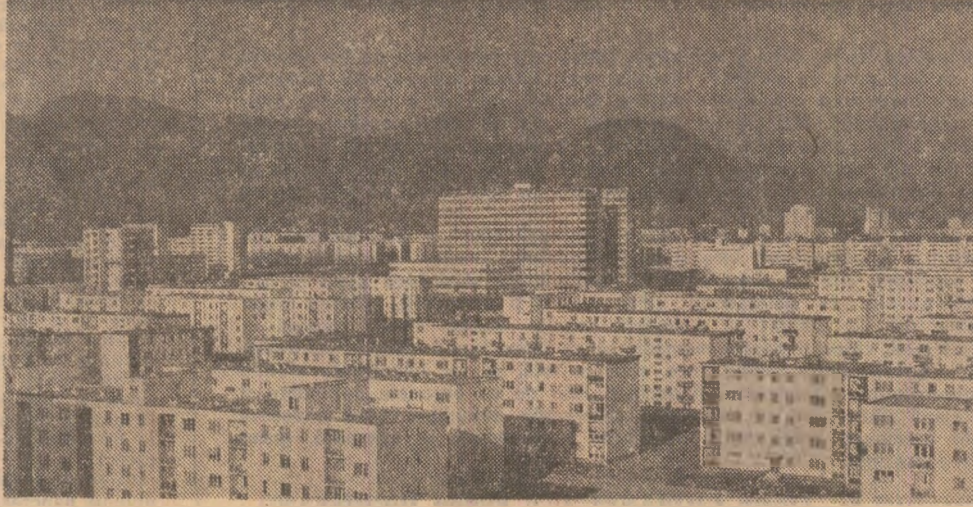
Puternic centru muncitoresc, municipiul Baia Mare cunoaște în acești ani o adevărată înflorire edilitoră