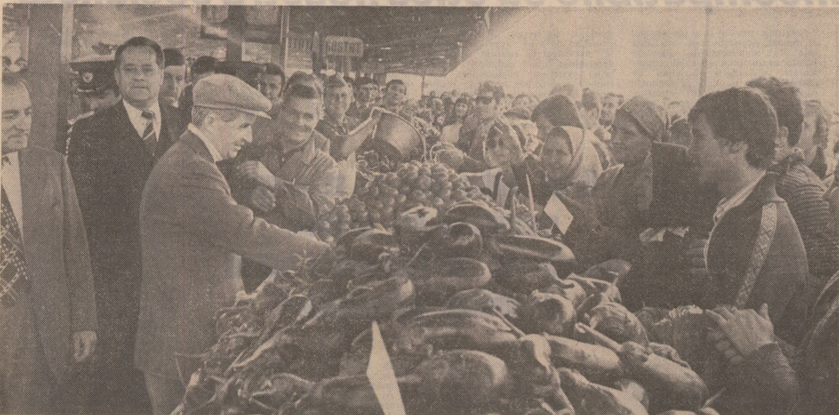
În Piața Unirii — una din principalele piețe agroalimentare ale Capitalei