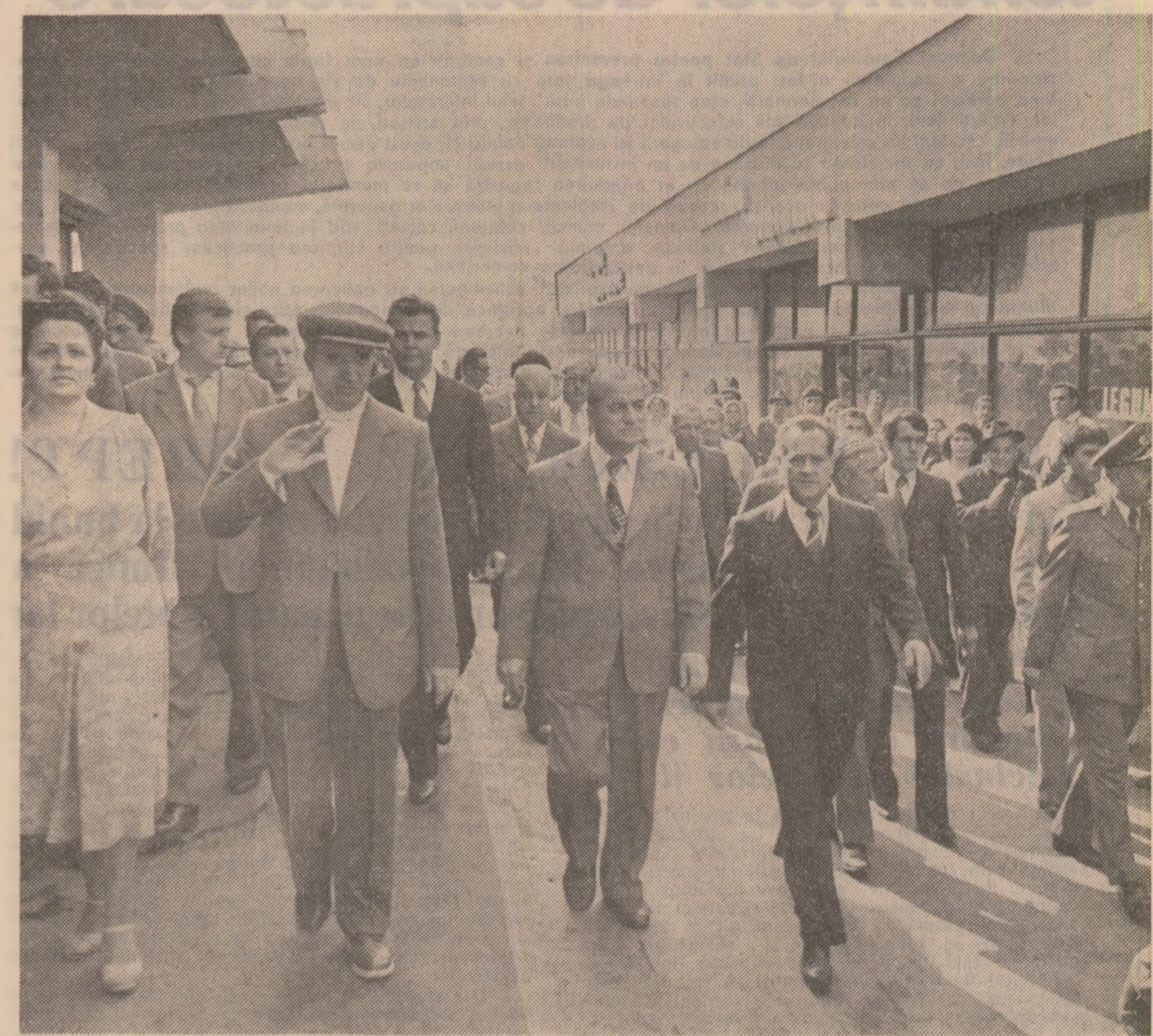
În toate piețele vizitate, secretarul general al partidului a fost întâmpinat cu manifestări de stîmna și recunoștință pentru grija ce o poartă bunei aprovizionări a populației

Toți cei care s-au întîlnit în această zi cu secretarul general al partidului și-au manifestat dragostea fierbinte, profundă grațitudine față de tovarășul Nicolae Ceaușescu pentru grija sa permanentă față de oamenii muncii, față de condițiile lor de viață și activitate. Bucuria și entuziasmul cu care a fost înconjurat secretarul general al partidului au reprezentat, totodată, o eloventă mărturie a unității clasei noastre muncitoare din jurul partidului, al secretarului său general, a hotărîrii cu care întregul nostru popor acționează pentru îndeplinirea obiectivelor stabilite de Congresul al XII-lea al partidului cu privire la dezvoltarea multilaterală a patriei noastre, și, pe această bază, asigurarea prosperității și înfloririi României socialiste.