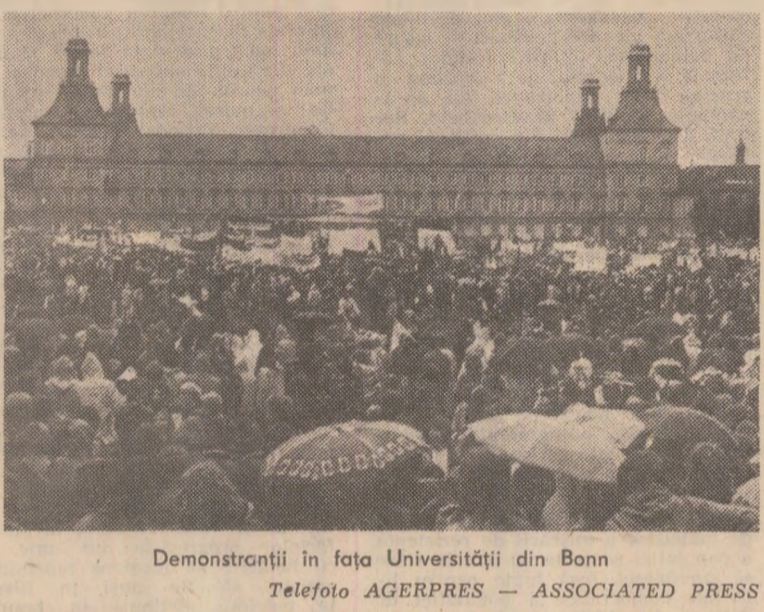
Demonstrații în fața Universității din Bonn.