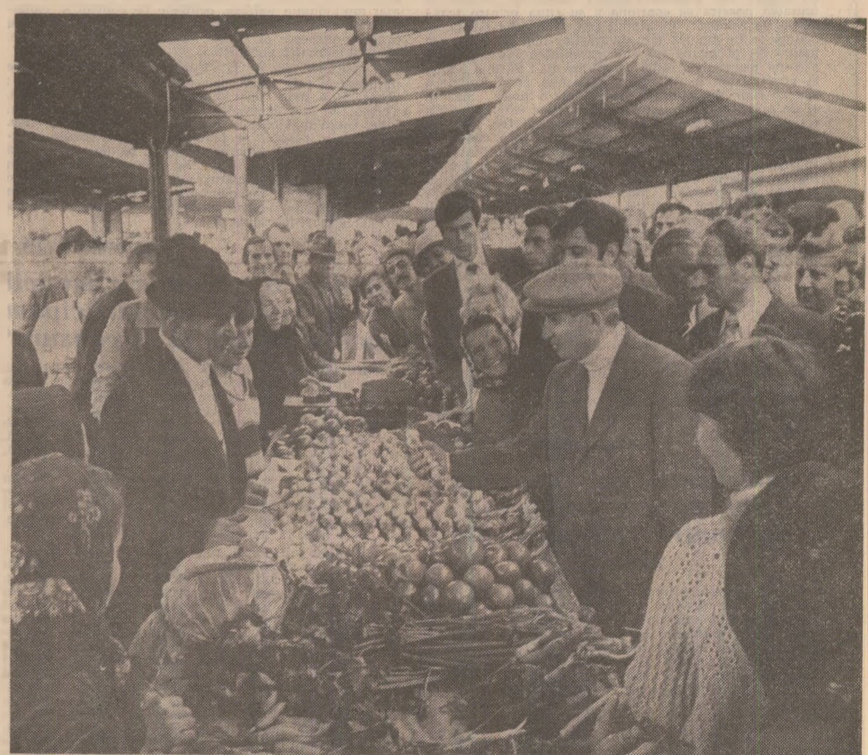
De vorbă cu producătorii individuali și cu gospodine în piața „Ilie Pintilie”