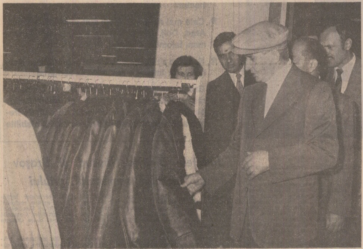
La magazinul „Unirea"