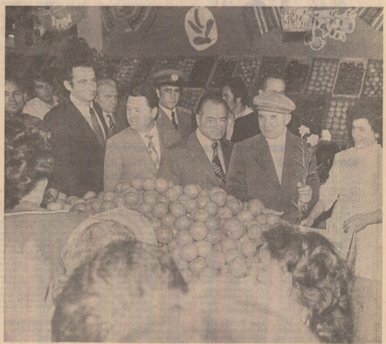
În Piața Dorobanți se apreciază buna aprovizionare cu produse agroalimentare de sezon