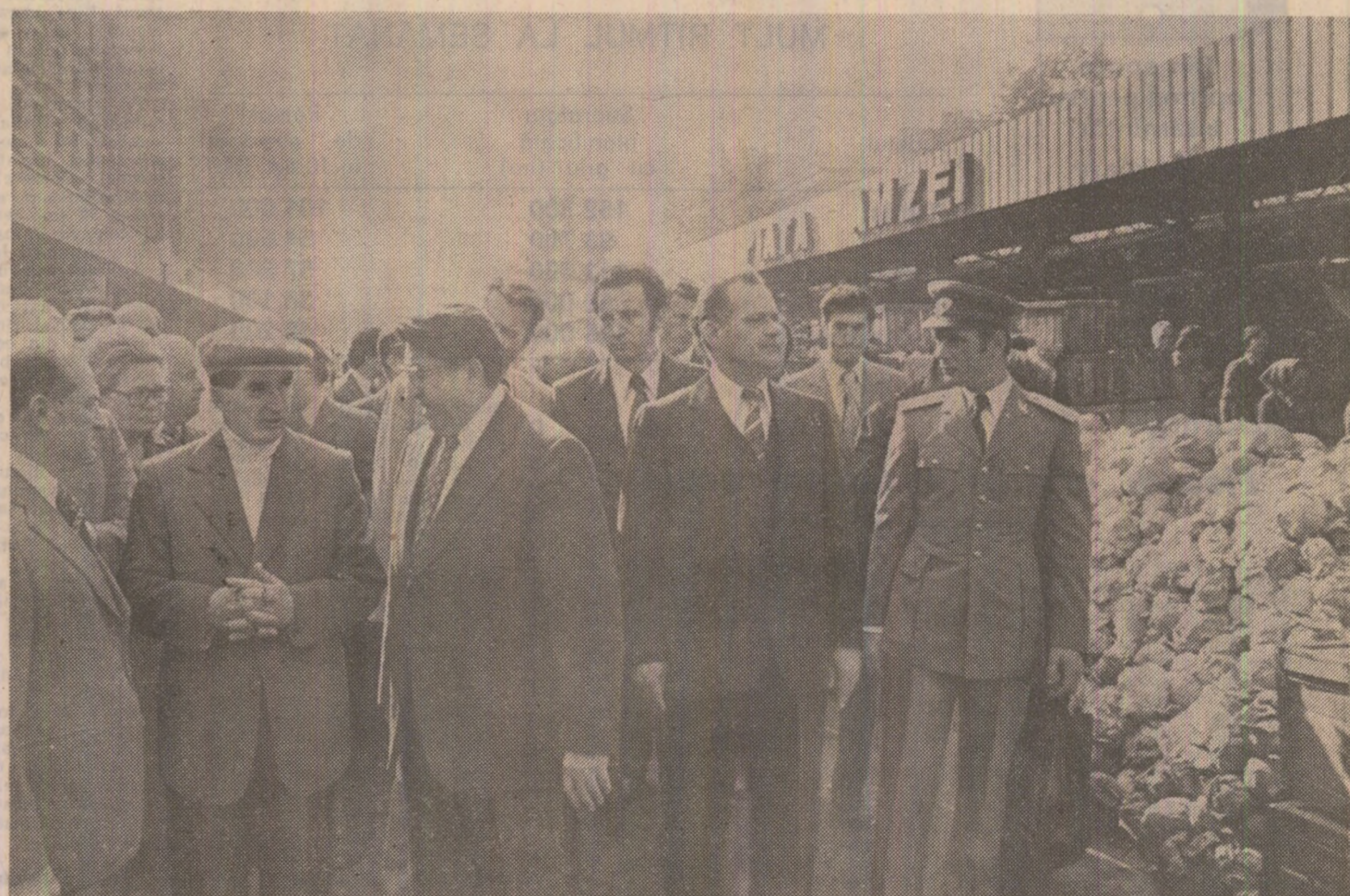
În piețele „Ober” și „Amzei” — dialog fructuos cu cetățeni și edili ai Capitalei privind asigurarea unei aprovizionări corespunzătoare și raționale a populației cu produse agroalimentare