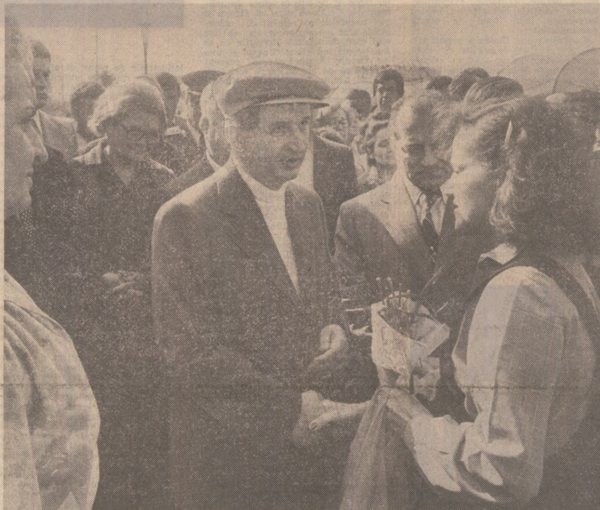
Primire plină de căldură la Întreprinderea „Tricodova”

● În întreprinderile vizitate, oamenii muncii au dat glas hotărîrii lor de a îndeplini neabătut sarcinile planului pe acest an, obiectivele stabilite de Congresul al XII-lea al partidului.