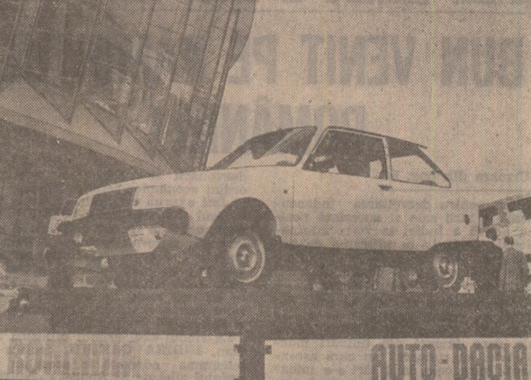
Noul autoturism „OLTICIT” prezentat în cadrul Tîrgului Internațional București — 1981.

Pentru cei mai mulți, autoturismele „Dacia” și „ARO” sînt binecunoscute. Și totuși, si la actuala ediție a T.I.B. constructorii de autoturisme din Filiești și Cîmpulung aduc în standurile expoziției mașini îmbunătățite, cu performanțe tehnice superioare, care diversifică oferta la export în acest domeniu. Caracteristica generală a noulor tipuri de autoturisme „Dacia” o constituie reducerea consumurilor de carburant, în condițiile sporirii puterii motoarelor. Astfel, „Dacia” — 1300i, cu distribuție variabilă, are un consum de 4,3-7,1 l benzina la 100 km, economia de combustibil înerezindu-se îndeosebi la consumul în regim de circulație urbană. Modelul „Dacia” — 1400i, cu un motor de 1 400 ccm, este prezentat în două variante — de 56 CP și 65 CP, ultimul fiind destinat taximetrelor. „Dacia 1600 — brek” este dotată cu un motor de 1 600 ccm și putere sporită — 1 000 ccm și 80 CP. La rîndul lor, autoturismele de teren „ARO”, dotate cu motoare de benzină sau motorină, prezentate cu o serie de îmbunătățiri în direcția finisării, si-au sporit caracteristicile care le-au impus pe piața externă — puteri mari, utilizare pe terenuri grele și foarte grele. Astfel, „ARO-322 D” poate urca pante maxime de 25 grade, iar modelul „ARO-243” pante maxime de 35 grade.