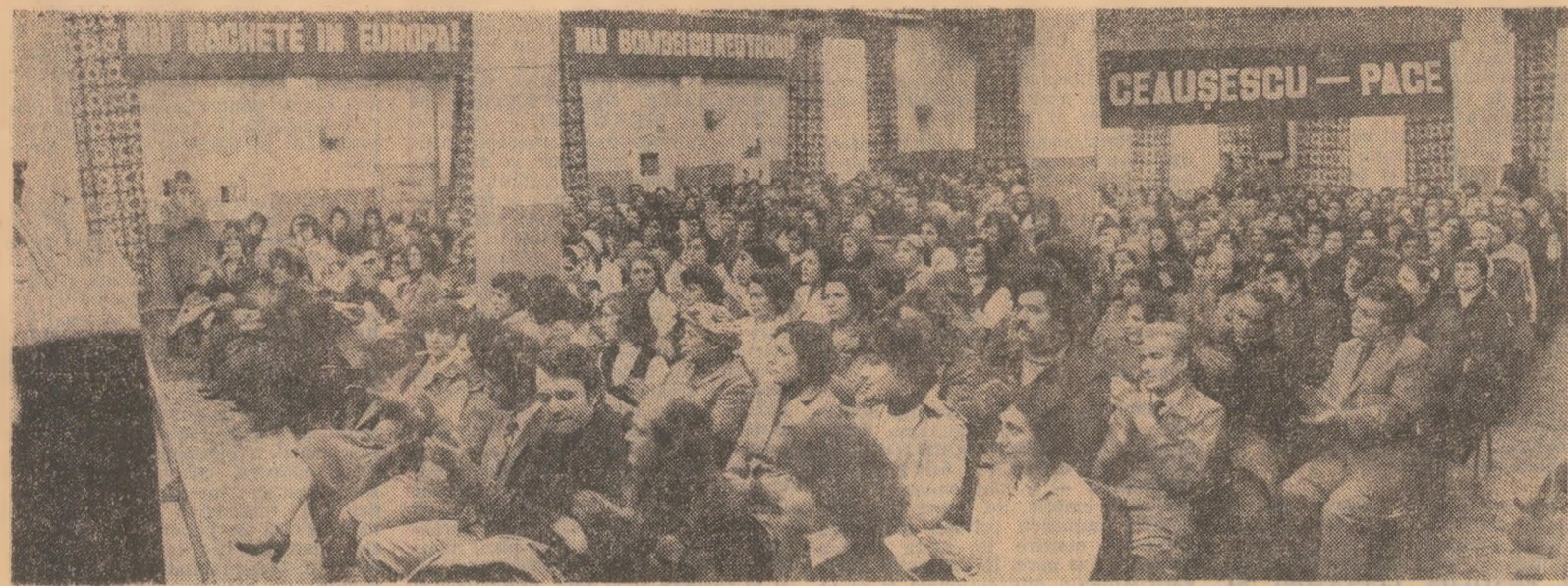
Aspect de la mitingul care a avut loc la întreprinderea „Electromagnetica” din Capitală.

În impresionante adunări și mitinguri, ce au loc în continuare în întreaga țară, noi și puternice expresii ale deplinei adeviziuni a tuturor oamenilor muncii față de strălucita inițiativă de pace a tovarășului Nicolae Ceaușescu