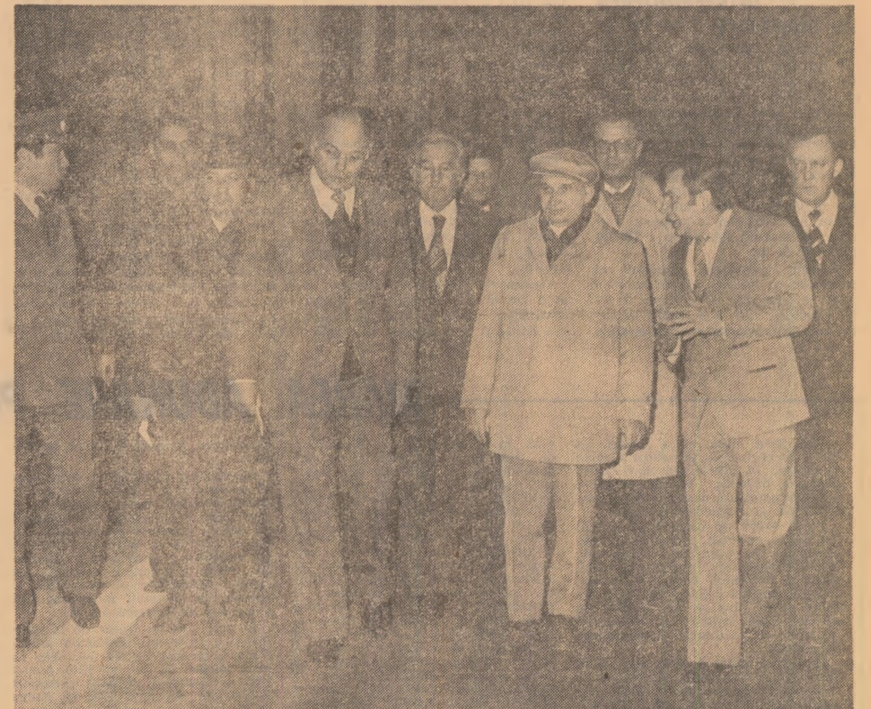
La Întreprinderea de conductori electrici emailați