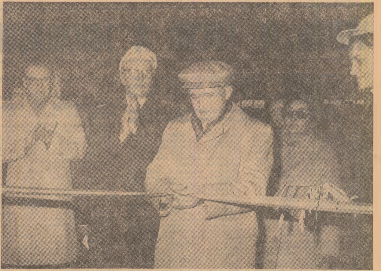
Tovarășul Nicolae Ceaușescu inaugurează noul laminor al întreprinderii de țevi

Continuind fructuosul dialog cu țara, consultarea la fața locului cu oamenii muncii pentru a hotărî împreună măsurile ce se cer întreprinse în vederea încheierii cu succes a primului an al cincinalului și pregătirea temeinică a producției anului viitor, s-a desfășurat ieri