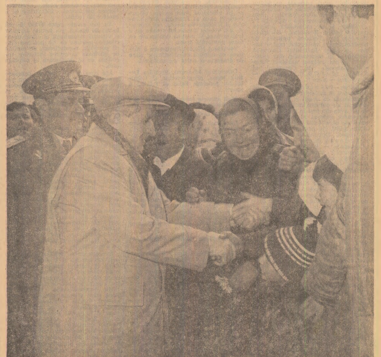
Tovarășul Nicolae Ceaulescu este întîmpinat cu deosebită căldură de cooperatorii din Hereclean