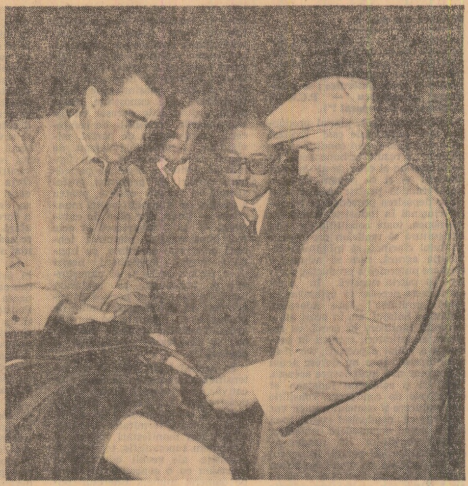
În timpul vizitei la întreprinderea de anvelope

țire, îndemnul de a-și intensifica eforturile pentru ca întreprinderea lor să atingă în cel mai scurt timp nivelul de producție planificat.