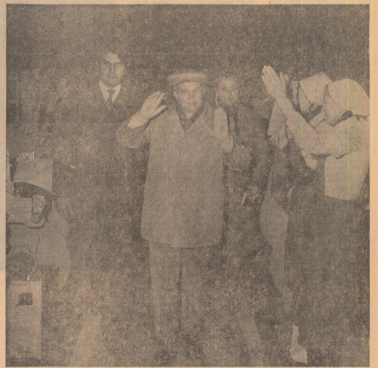
În mijlocul colectivului de muncă de la Întreprinderea „Integrata de in”

Cu această convingere, vă urez dumneavoastră, tuturor oamenilor muncii, fără deosebire de naționalitate, locuitorilor din Zalău și Sălaj succese tot mai mari în toate domeniile, multă sănătate și multă, multă fericire! (Aplauze și urale puternice, prelunșite; se scandează „Ceaulescu și poporul!” „Ceaulescu — P.C.R.!” „Ceaulescu — pace!”). Într-o atmosferă de puternică însuflețire, toți cei prezenți la marea adunare populară aclamă și ovacionează îndelung pentru Partidul Comunist Român — forța politică conducătoare a națiunii noastre, pentru secretarul general al partidului, președintele țării, tovarășul Nicolae Ceaulescu).