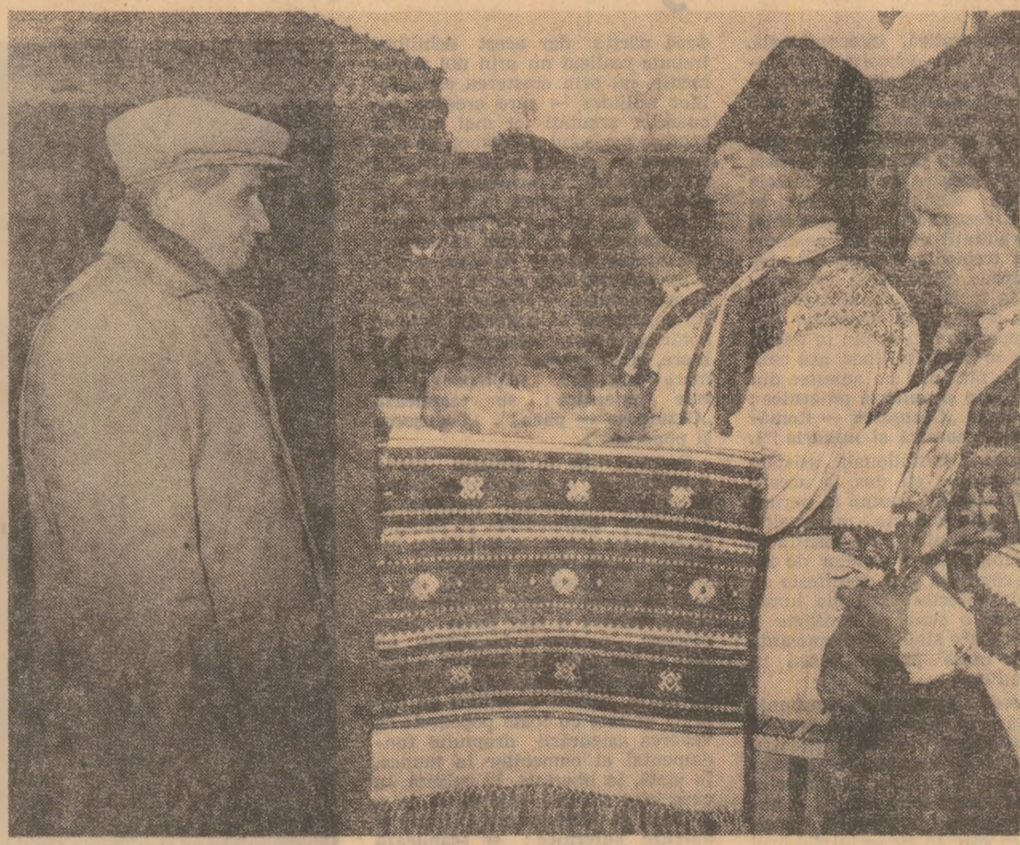
La Hereclean, mărturie ale tradiționalei ospitalități românești

Tovarășul Nicolae Ceaușescu a avut cuvinte de apreciere la adresa realizărilor lucrătorilor zăleani, care din Zalău și le-a adresat, la despăr-