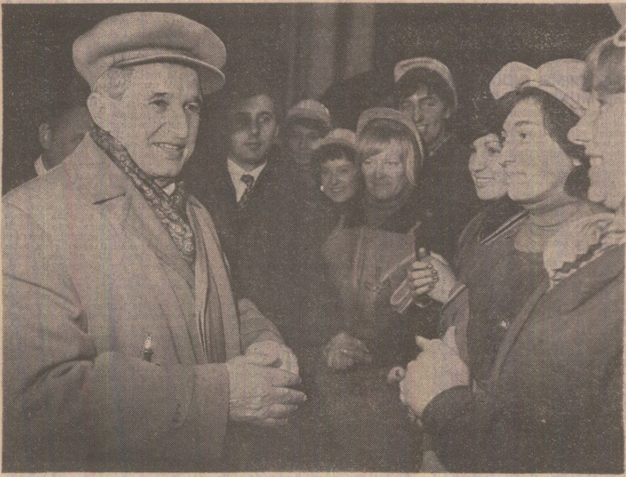
În mijlocul oamenilor muncii, de la Combinatul industrial pentru construcții de mașini din Bistrița