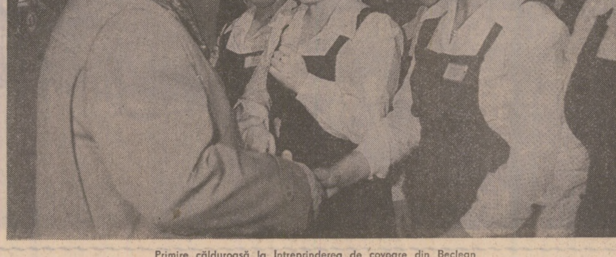
Primire călduroasă la întreprinderea de covoare din Beclean

La despărţirea de locuitorii oraşului Năsăud, tovarăşul Nicolae Ceauşescu a spus: „As dori să vă adresez, tovarăşi, un salut călduros, să vă felicit pentru aceste întreprinderi