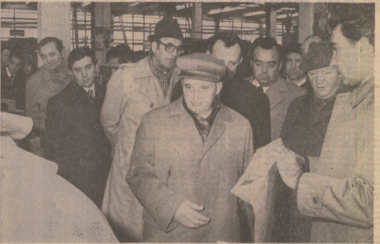
Dialog de lucru la întreprinderea de prelucrare a maselor plastice din Năsăud

Într-o atmosferă de puternic entuziasm, toți cei prezenți la marea adunare populară ovacionează și aclamă, stăruie în șir, pentru forța conducătoare a națiunii noastre socialiste — Partidului Comunist Român, pentru secretarul general al partidului, președintele Republicii Socialiste România, tovarășul Nicolae Ceaușescu.