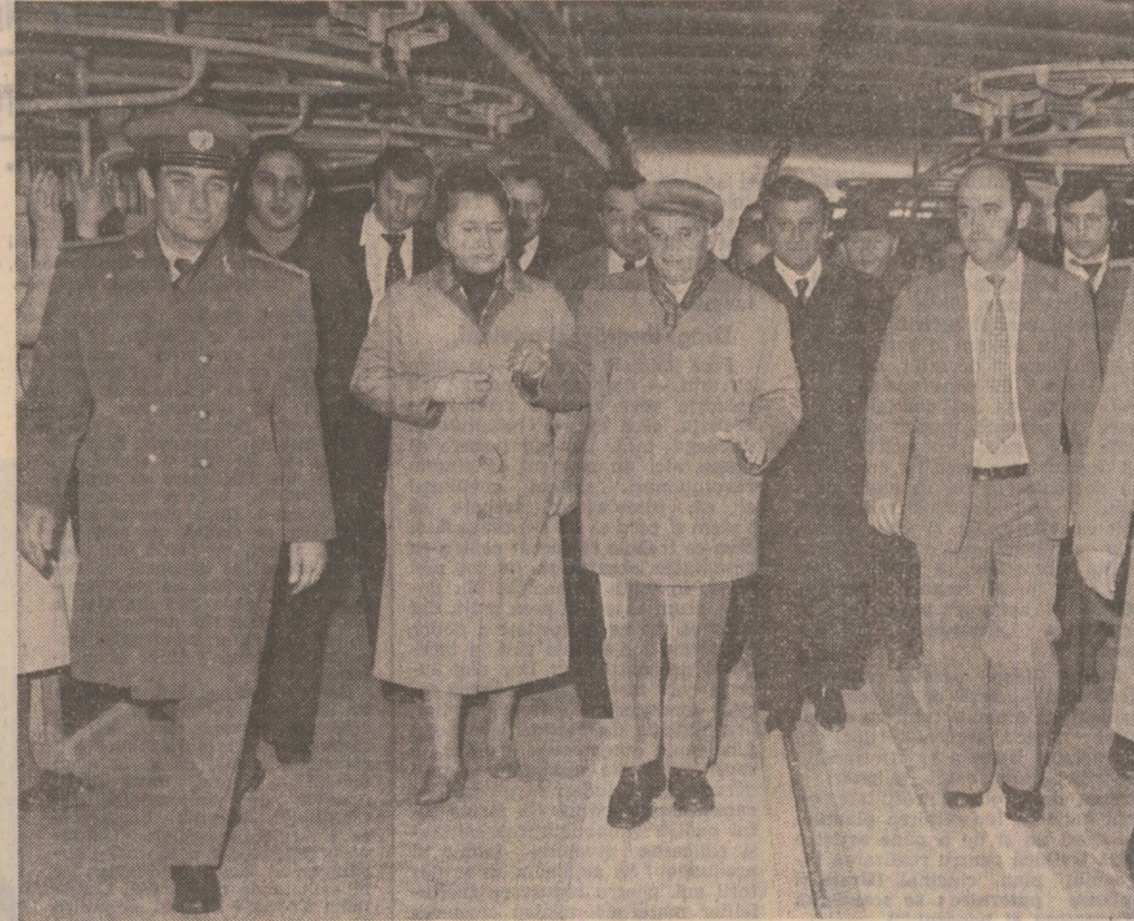
În timpul vizitei la întreprinderea textilă din Năsăud

năsăudeni, secretarul general al partidului le-a cerut să-şi concentreze eforturile în vederea scurtării termenelor de dare în exploatare a utilităţilor montate sau aflate în probe, diversificării gamei sortimentale şi îndeosebi, a reperelor pentru industria constructoare de maşini, spirorii producţiei, în special a celor destinate exportului. Tovarăşul Nicolae Ceauşescu a indicat conducerei ministerului de resort să întreprindă măsuri adecvate pentru a asigura întreprinderii din Năsăud necesarul de materii prime care să permită funcţionarea ei la întreaga capacitate.