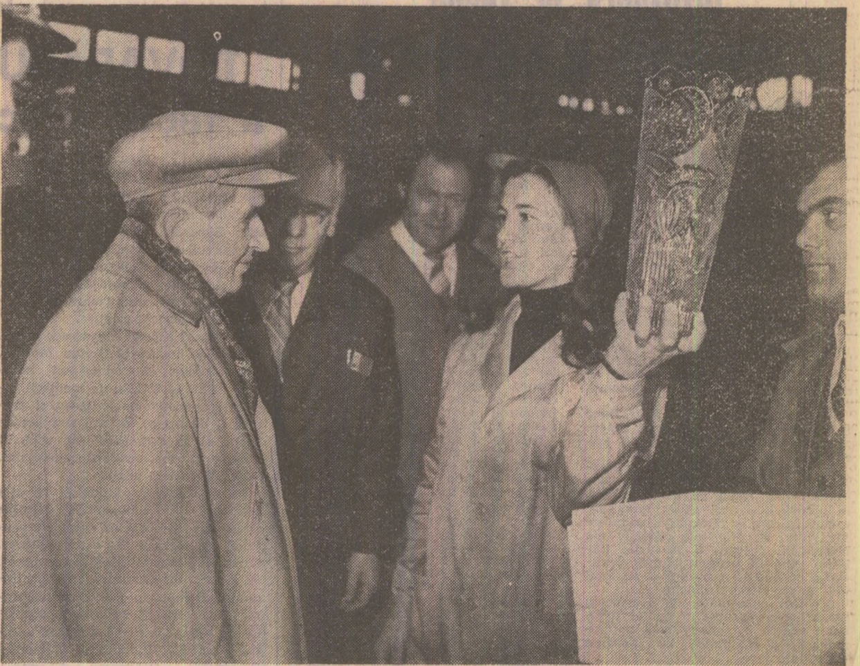
Moment din timpul vizitei la întreprinderea de sticlărie-menaj din Bistrița