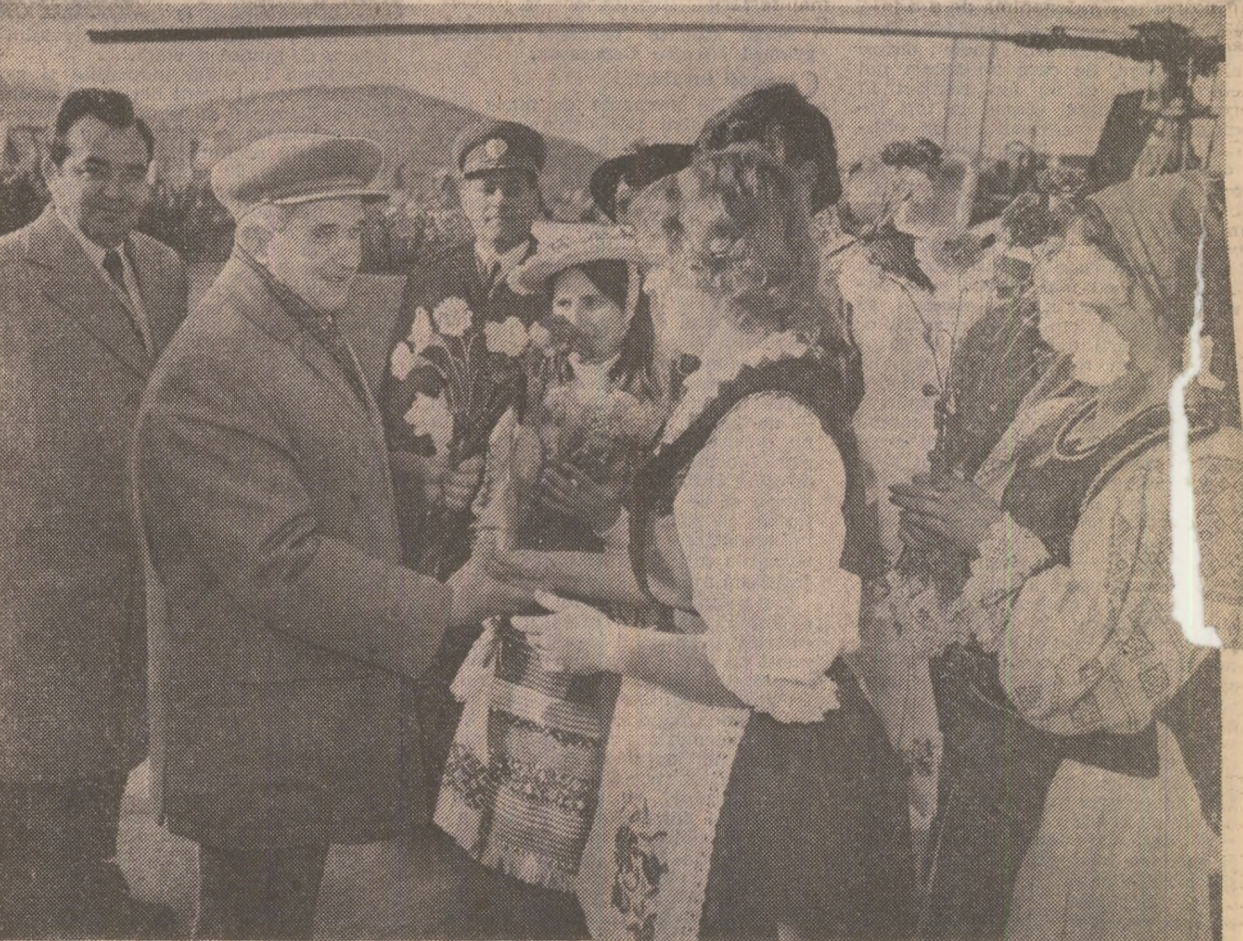
La Beclean, flori ale înaltei stime și recunoștințe