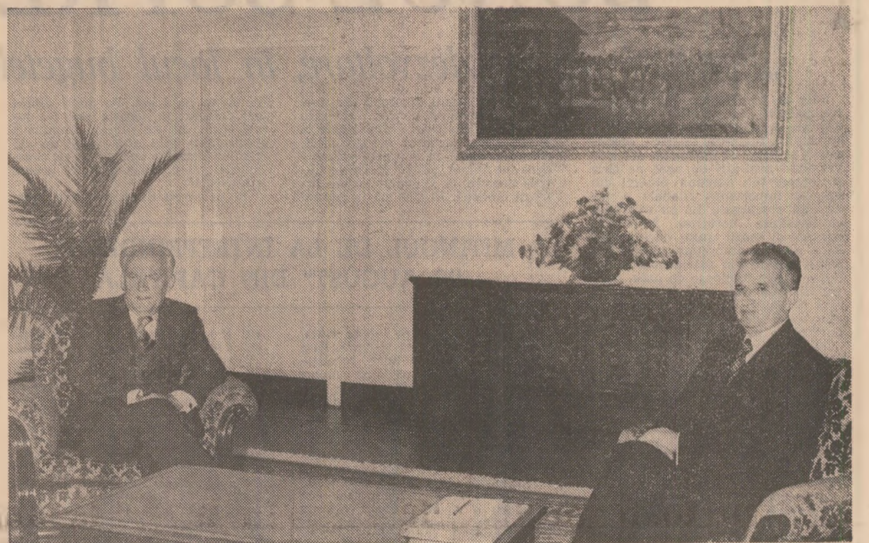
La convorbirile oficiale