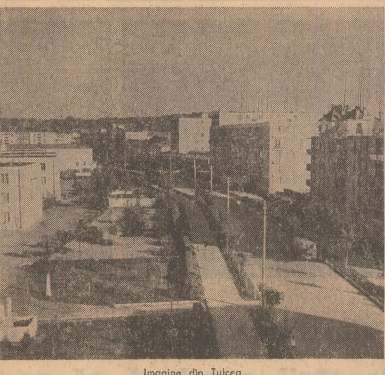
Imagine din Tulcea