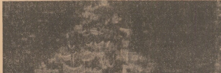
Aspect de la uriașă manifestația de la Amsterdam

AMSTERDAM 21 (Agerpres). — Peste 400.000 de oameni au participat la manifestația antinucleară organizată simbolic în Amsterdam. La manifestație, care a depășit prin amploarea ei demonstrațiile de la Bonn și Londra, veni au sute de mii de oameni din întreaga Olanda, precum și din Belgia, Marea Britanie, R. F. Germania, Suedia, ca și din S.U.A.