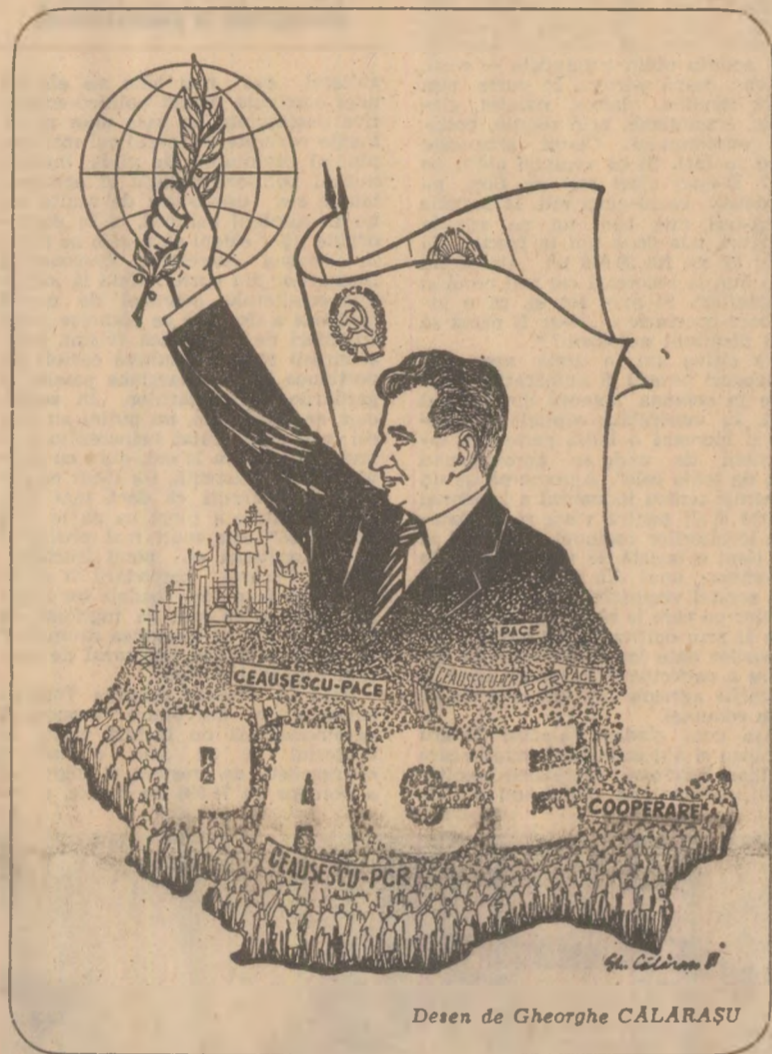
Desen de Gheorghe CALARASU

Dind expresie voinței milioanei de cetățeni care le-au încredințat mandatul în forul suprem legislativ al țării, participanții la sesiunea Marii Adunări Naționale, ca și la reuniunile principalelor organisme obștești ale democrației noastre socialiste, odată cu dezbaterile fundamentale pentru dezvoltarea economică și socială a patriei, au adoptat documente care reflectă înalta grijă și (Continuare în pag. a V-a)