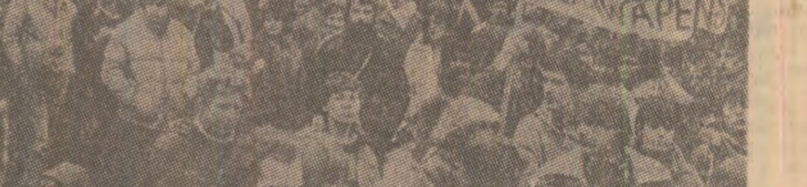
Marile demonstrații și mișcări de masă din România in sprindul cauzei păcii se inscriu pe linia puternicelor manifestații ale maselor populare, care au avut loc in ultima vreme la Bonn, Londra, Paris, Bruxelles, Roma și alte centre europene, precum și in orase din diferite țări de pe alte continente. In fotografie: aspect de la demonstrația de la Amsterdam, cu participarea a 400.000 de persoane — bărbați, femei, tineri și virstnici — din Olanda și din alte țări.

— Renunțarea la demonstrațiile de forță la granițele altor state.