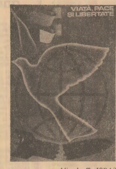
Afiș de T. ISPAS