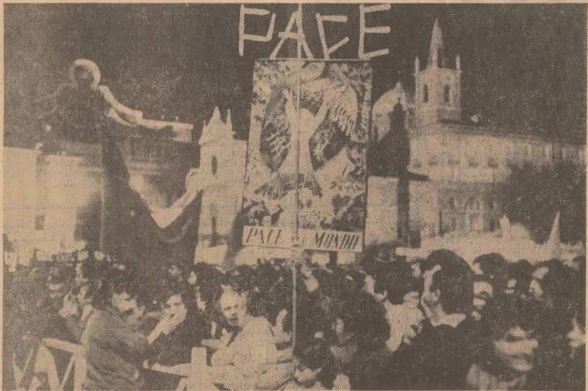
Sub deviza "PACE". La Roma s-a desfasurat o ampla demonstratie de protest, cu zeci de mii de participanti, impotriva planurilor privind instalarea de noi rachete nucleare in Italia si pe continentul european