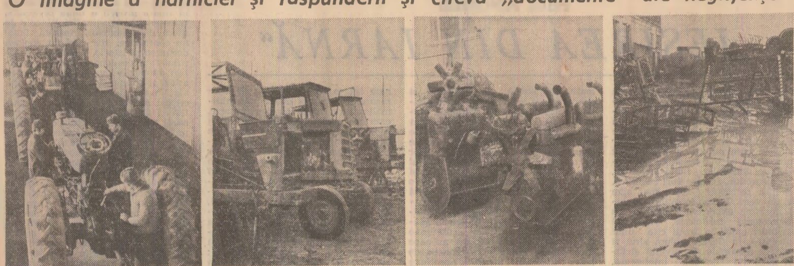
Iată cîteva imagini de la S.M.A. Fundeni, județul Călărași. Așa trebuie să se lucreze, intens și organizat, la repararea tractoarelor și mașinilor (prima fotografie). De ce au rămas dezmembrate tractoarele din fotografia a doua? Pentru că de la centrul de reparații Budești n-au sosit încă 25 motoare trimise la reparat. Dar așa cum se vede din fotografia a treia, conducerea S.M.A. Fundeni are partea ei de vină: nici acum nu o trimis la reparat, 5 motoare de tractor. Fotografia a patra reprezintă o mostră a proastei gospodăririi: utilaje agricole depozitate în... baltă