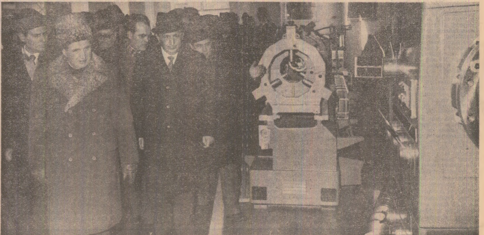
La întreprinderea de strunguri sînt prezentate noi tipuri de mașini-unelte

Colectivul Combinatului petrochimic Midia-Navodari a obținut primele 1000 tone de gaze lichefiate în instalația de fractionare gaze aflată în probe tehnologice. Tot aici sînt în probe alte trei instalații, cea de reacție catalitică, de hidrofinaie benzină și de desulfurare gaze, care încheie execuția primei platforme tehnologice a combinatului. Finalizarea acestor instalații permite o mai bună valorificare a materiei prime — țitei — și obținerea unor produse petroliere superioare, cum sînt : gaze de chimizare, benzină cu cifră octanică ridicată, precum și o mare parte din gama de produse aromatice. (George Mihăescu).