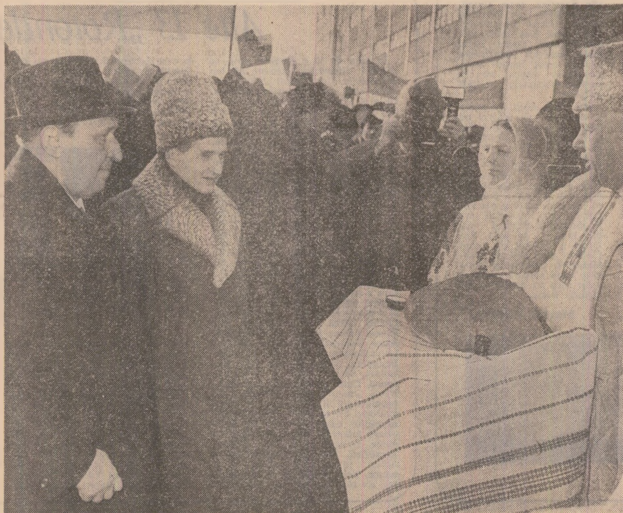
Cei doi conducători de partid și de stat sînt intimipoiți cu căldură ospitalitate

La plecare, tovarășul Todor Jivkov a semnat în cartea de onoare a combinatului, a felicitat cu căldură pe muncitorii, tehnicienii și inginerii pentru înfăptuirile de dinăcun și le-a urat să se mențină mereu în fruntea întrecerilor pentru îndeplinirea sarcinilor de producție în cele mai bune condiții. Metalurgistii prezente aplaudă din nou cu însuflețire pe cei doi