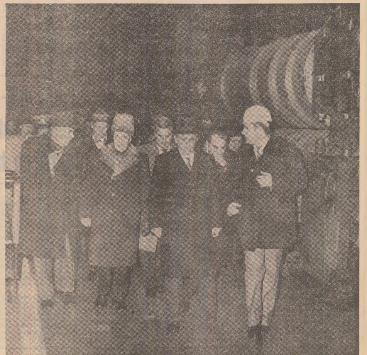
În timpul vizitei la combinatul metalurgic

În această atmosferă entuziastă, tovarășii Nicolae Ceaușescu și Todor Jivkov și-au luat rămas bun de la membrii birourilor comitetelor județean și municipal de partid, au salutată cu prietenie mii de oameni ai muncii aflați în tribunele stadionului, le-au mulțumit pentru ospitalitatea deosebită de care s-au bucurat în timpul vizitei, le-au urat multă sănătate și fericire.