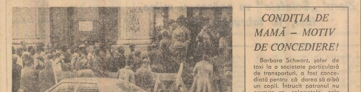
Imagini, ca cea din fotografia de sus, sunt întâlnite pretutindeni în aceste zile la birourile de plasare a brațelor de muncă din țările capitaliste

În paginile presei occidentale apar frecvent știri referitoare la condițiile precare de muncă și viață ale unor largi categorii de oameni ai muncii. Faptele relatează arată că, pe măsură ce se fac mai simțite fenomenele crizei economice actuale — recesiune, șomaj, inflație — apar și mai pronunțat asemenea realități de esență ale societății capitaliste cum sunt exploatarea celor ce muncesc, flagranțele inegalității de ordin economic și social, situația tot mai grea a imigranților, restrângerea accesului la muncă și învățare, discriminările profesionale, politice și de altă natură. Astfel, în Franța, creșterea șomajului este de două ori mai accelerată printre imigranți.