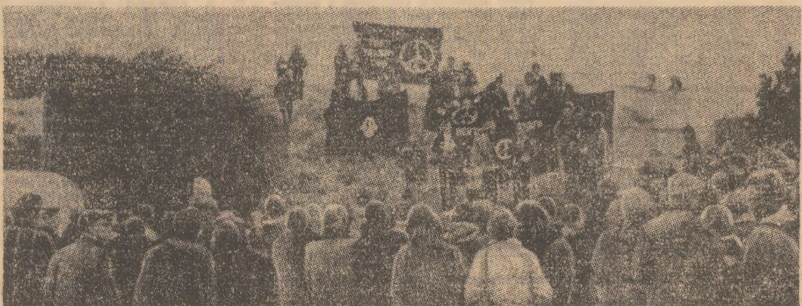
In Marea Britanie continuă demonstrațiile de protest împotriva hotărârii privind amplasarea de noi arme nucleare pe teritoriul țării, pentru dezarmare, pace și colaborare