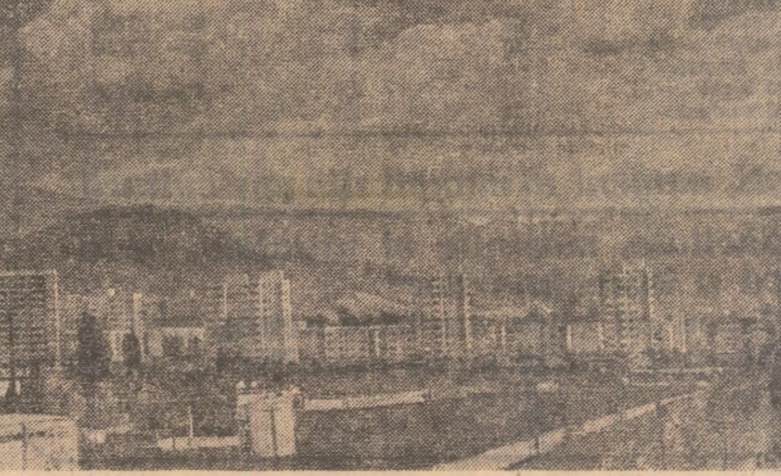
Din noua urbanistică a municipiului Baia Mare

— De ce nu v-a plăcut? O dare de seamă neanalitică, constatativă, din care s-ar lipsi în mare măsură aspectele concrete ale muncii de partid. Nu a fost o analiză a activității comitetului de partid, ci, mai degrabă, a consiliului oamenilor muncii, a unor compartimente tehnico-administrative. Acest lucru este deosebit de lipsă proprie. Ca activist de partid care răspund de această organizație de un an ar fi trebuit, prin mai multă îndrumare și sprijin, să pre-