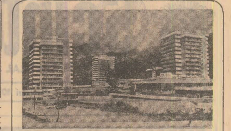
În fotografie: Complexul de cură balneară din stațiunea Călimănești — Căciulato