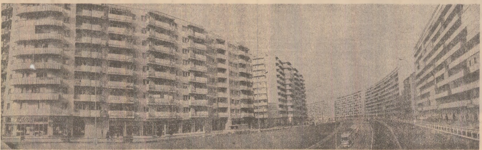
Siluete arhitecturale moderne pe artera reînnoită Ștefan cel Mare

— Totuși, din datele pe care le aveți la îndemînă rezultă că unele unități nu sînt încă îndeplinit planul pe două luni. Cum se acționează pentru recuperarea restanțelor în aceste unități?