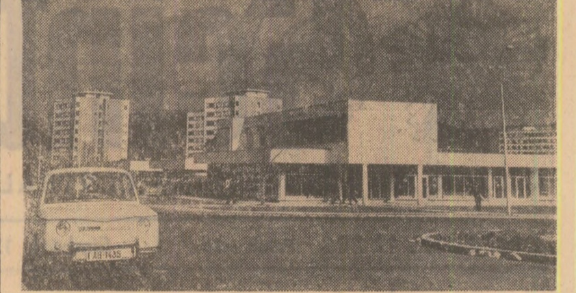
Vedere din Petroșani