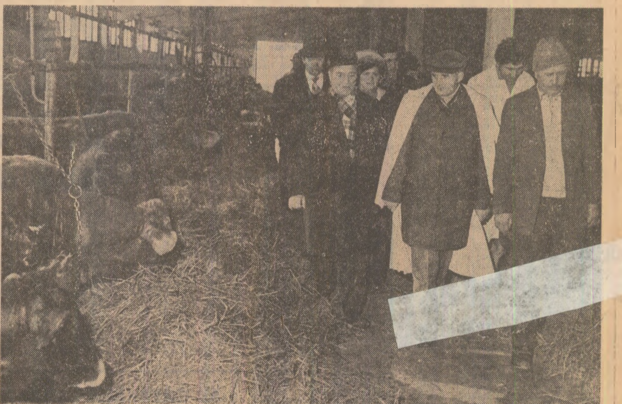
Vizitînd ferma zootehnică de la C.A.P. Otopeni