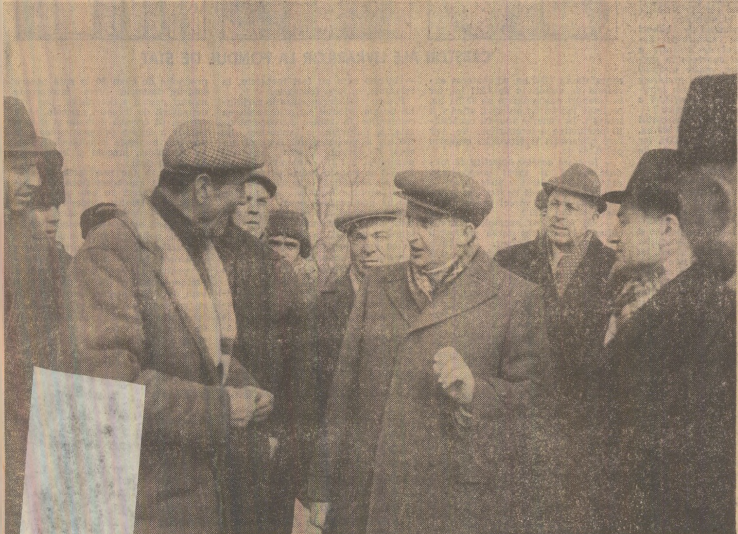
La C.A.P. Grulu, un fructuos dialog de lucru

duce în peste 20 de variante cu care se echipează mașinile-unelte de mare precizie ce folosesc cantități mari de lubrifiant, asigurînd răcirea de mai multe ori a acestora. Totodată, instalația poate fi utilizată și la recuperarea metalelor rare din diferite soluții. În prezent, este în curs de finalizare un lot de 10 astfel de instalații, parte din ele fiind solicitate la export. (Al. Mureșan)