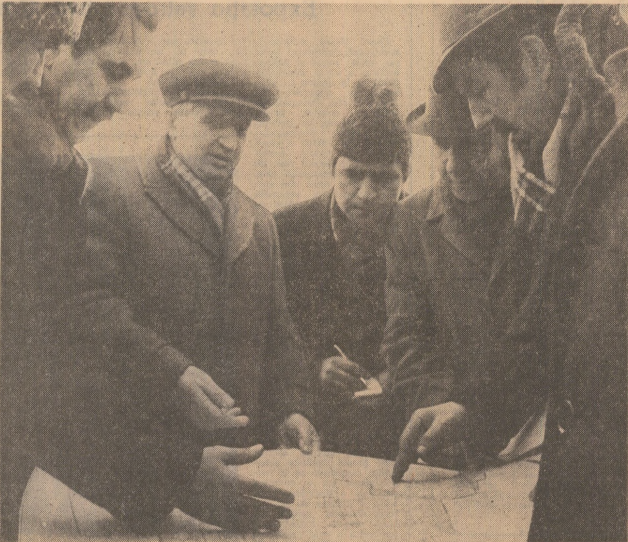
Atență analiză a proiectului și a lucrărilor sistemului de desecări Gălățui-Călărași

În toate unitățile vizitate s-a constatat o serioasă mobilizare a forțelor umane și materiale, a specialiștilor, a activiștilor de partid și de stat, ceea ce asigură condiții ca această importantă zonă agricolă a țării să-și