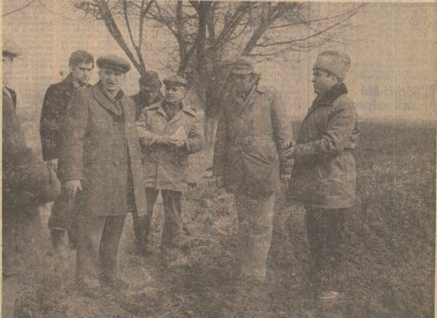
Se examinează cu agricultorii din Coșerani colitața lucrărilor de pregătire a terenului pentru însămînțări