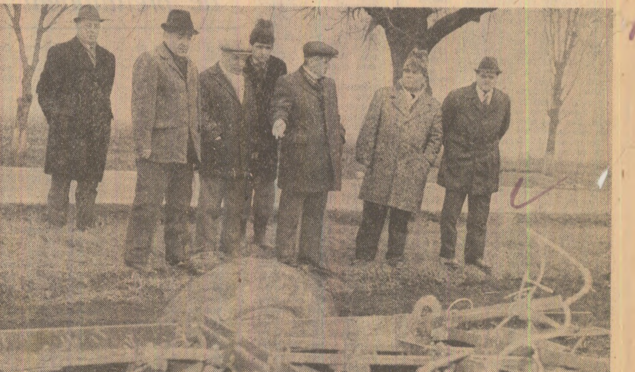
O analiză riguroasă a lucrărilor de pregătire a terenului la C.A.P. Andrășești