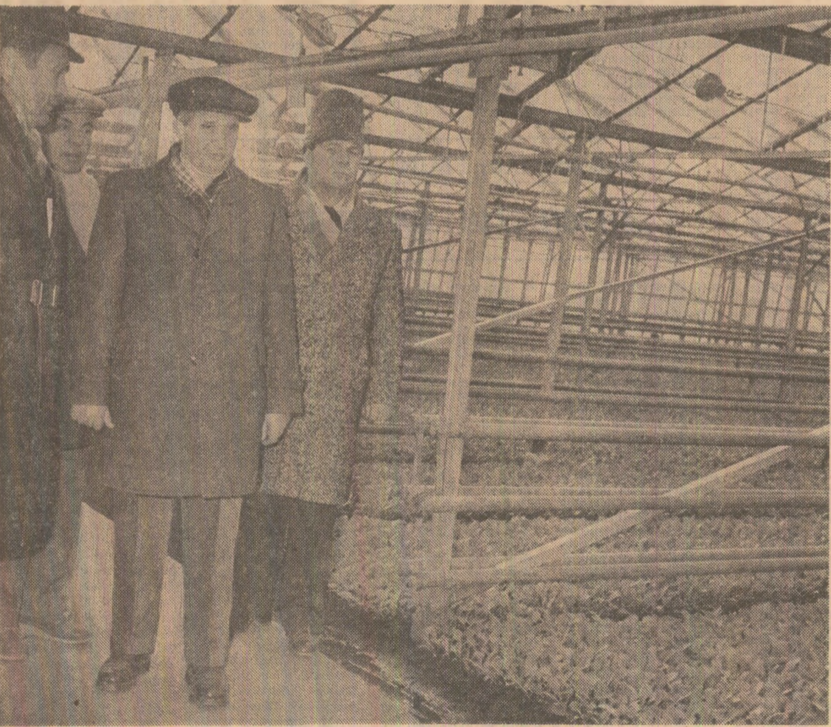
În serele de la C.A.P. Movilița