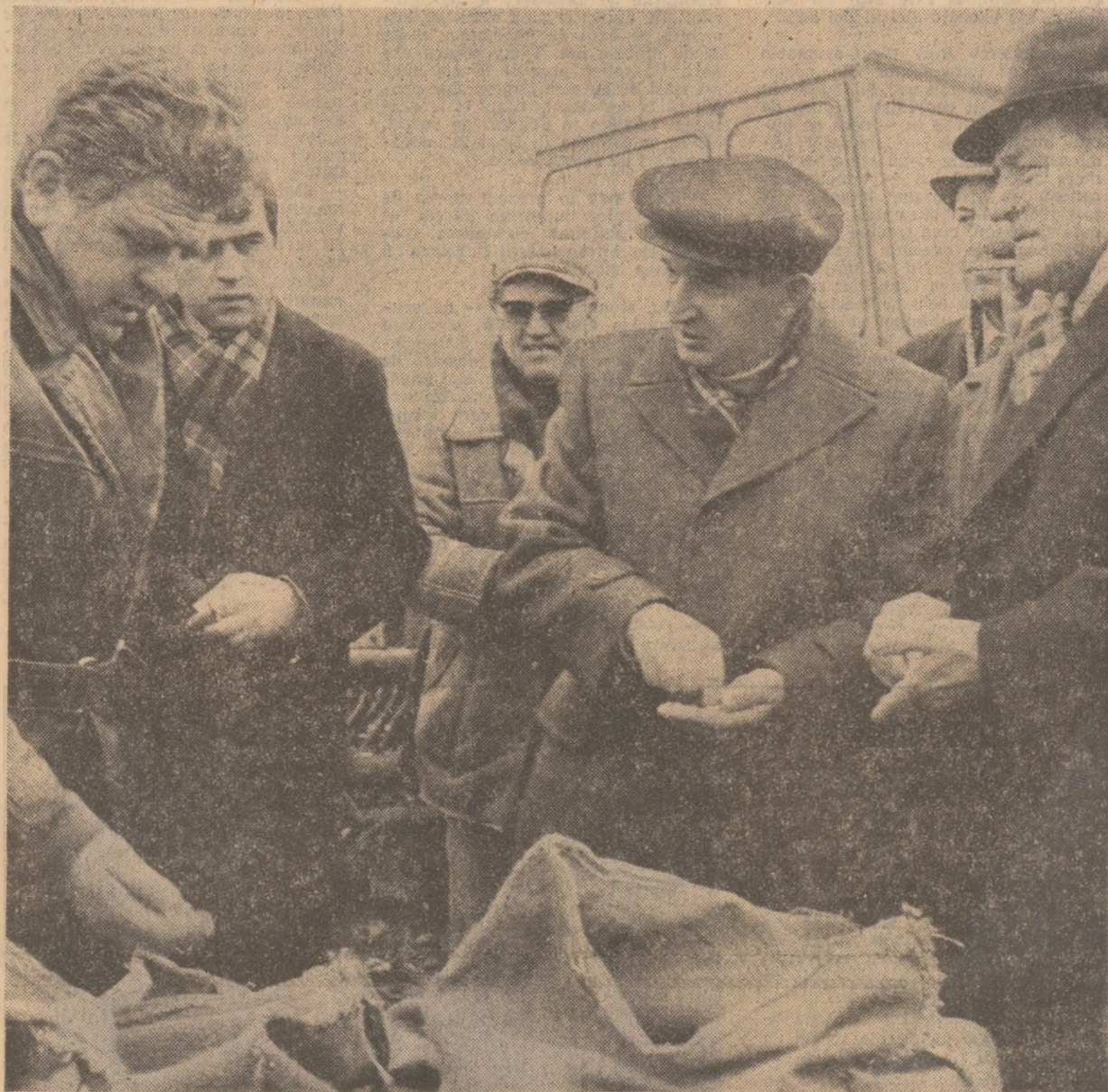
Pe ogoarele C.A.P. Snagov

Cu acest prilej au fost formulate cerințe și indicații de maximă însemnătate pentru mobilizarea tuturor forțelor în vederea bunei desfășurări a lucrărilor din campania agricolă de primăvară, a intensificării însămințărilor și respectării densităților optime stabilite, a îmbunătățirii activității în zootehnie, a îndeplinirii întregului complex de măsuri dezbătut la recenta plenară a Consiliului Național al Agriculturii.