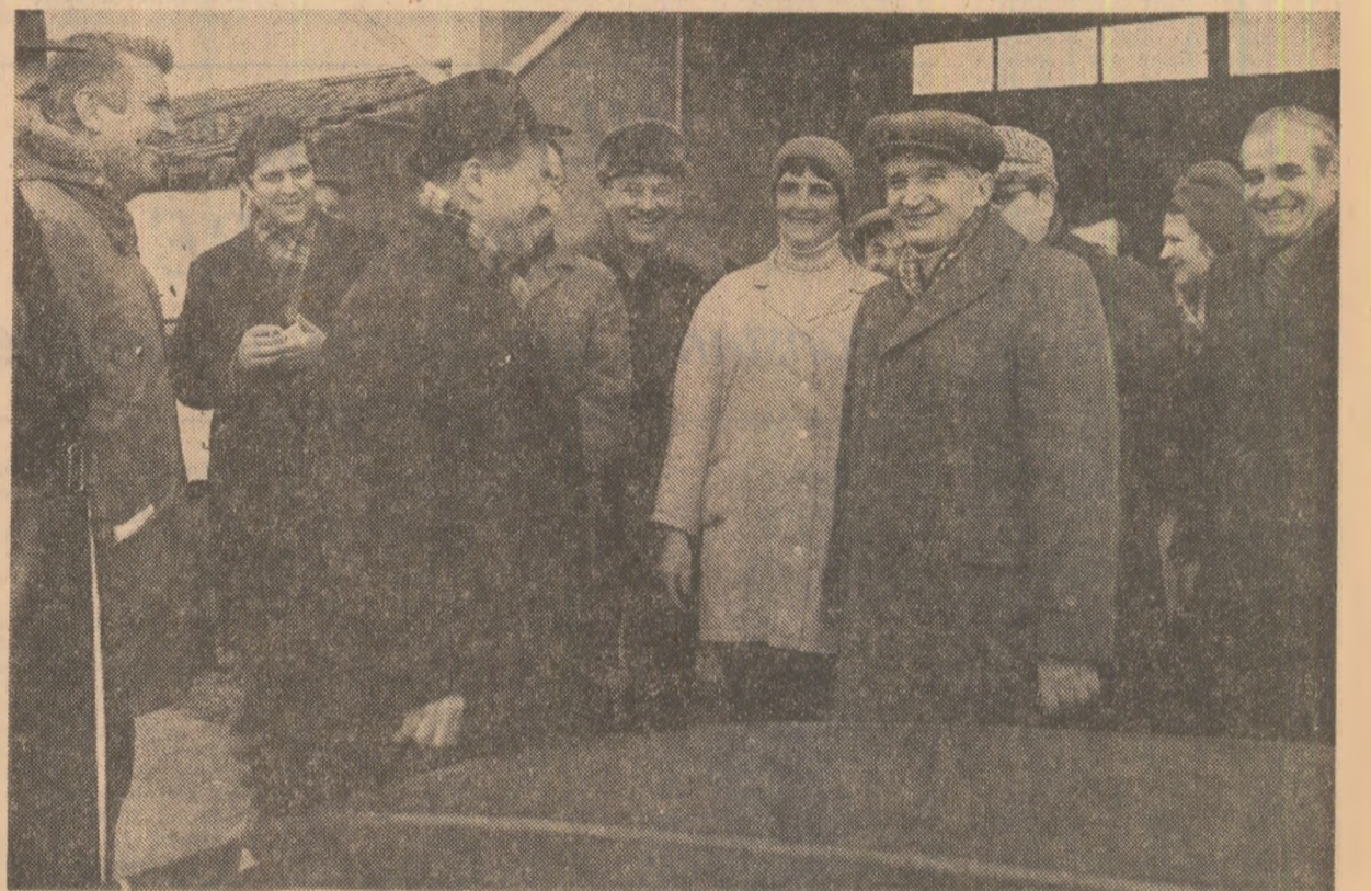
La C.A.P. Balotești se vizitează noile construcții ale fermei zootehnice

În unitățile agricole vizitate, cooperatorii, mecanizatorii, specialiștii, cadrele de conducere au exprimat hotărîrea de a munci cu înaltă răspundere pentru împlinirea indicațiilor primite, a sarcinilor de o deosebită importanță ce le revin, vor face totul pentru ca anul 1982 să marcheze un pas important în creșterea producției și a eficienței în această ramură, în realizarea obiectivelor trasate agriculturii de Congresul al XII-lea al partidului.