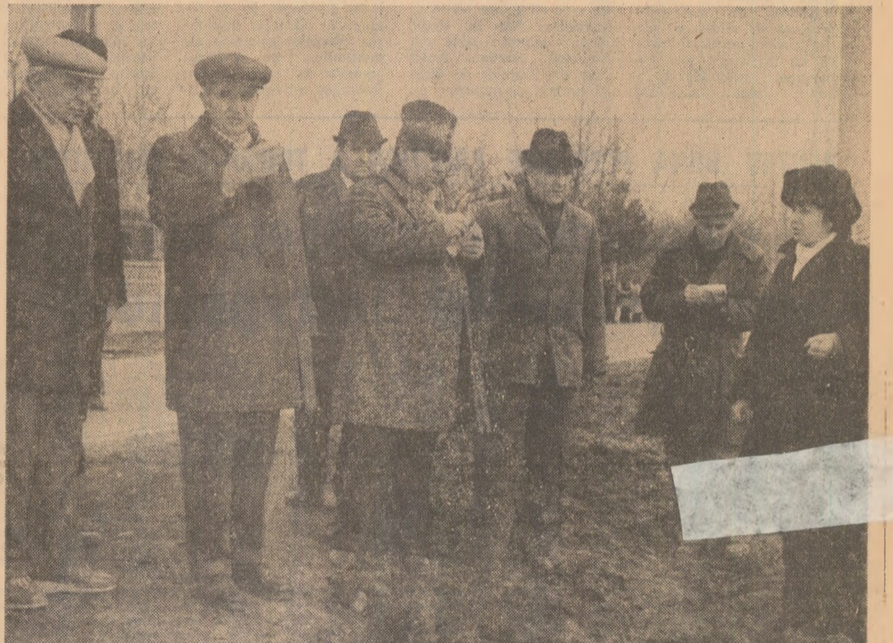
Pe ogoarele C.A.P. Dridu