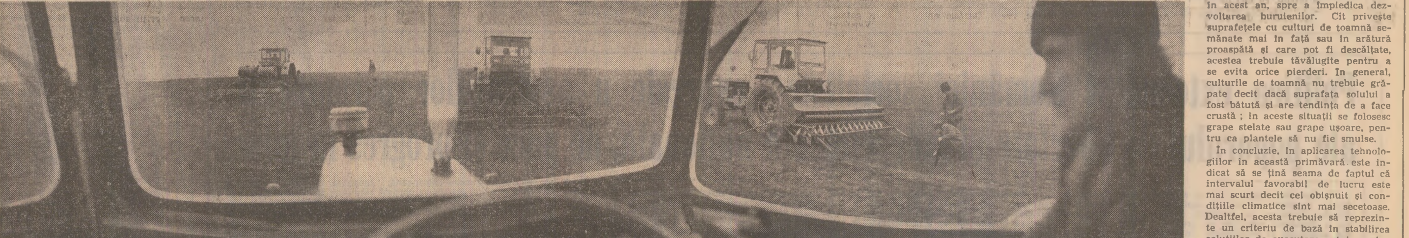
Pe ogorele C.A.P. Șcinteia, Județul Brăila, mecanizatorii folosesc din plin timpul de lucru pentru a încheia în scurt timp semănatul mazării

În concluzie, în aplicarea tehnologiilor în această primăvară este indicat să se țină seama de faptul că intervalul favorabil de lucru este mai scurt decît cel obișnuit și condițiile climatice sint mai secetoase. Dealtfel, acesta trebuie să reprezinte un criteriu de bază în stabilirea soluțiilor de executare a tuturor lucrărilor agricole, pentru a se realiza producțiile prevăzute în acest an.