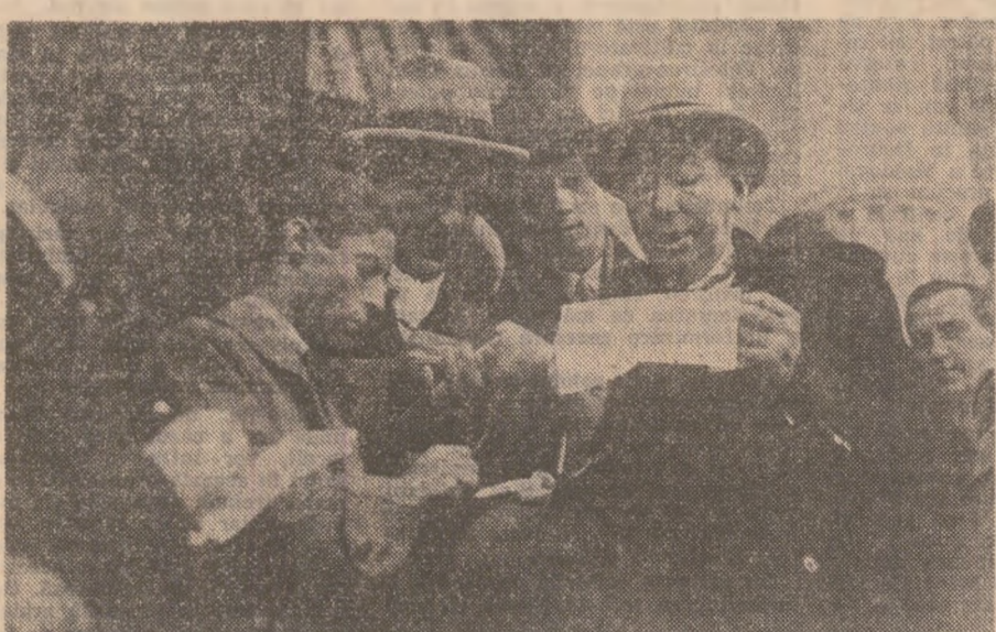
Nicolae Titulescu făcînd declarații presei (februarie 1933)

(Discurs rostit la Conferința presei Înțelegerii Balcanice, București, 11 mai 1936)