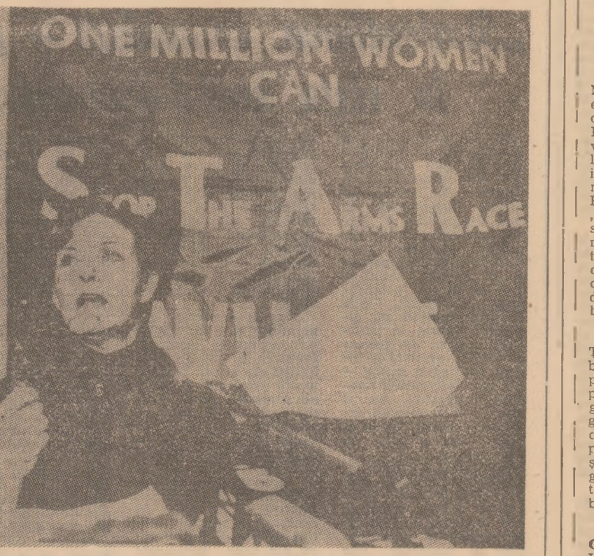
Campania, inițiată recent la New York de Liga Internațională a femeilor pentru pace, și-a propus stringerea, în rândurile femeilor americane, a unui milion de semnături pe un apel intitulat: „Stopați cursa înarmărilor”. Una din primele semnatarie ale apelului a fost actrița Joanne Woodward, care se vede în fotografie.