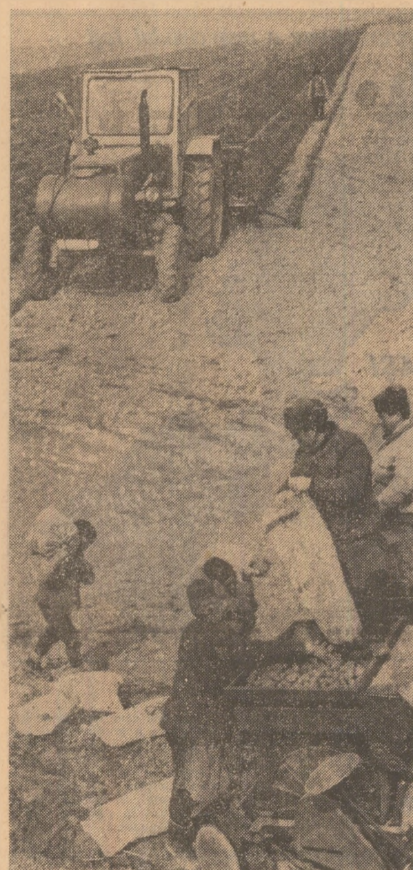
Plantarea mecanizată a cartofilor pe terenurile cooperative agricole din comuna Balta Doamnei — Prahova.

Volumul mare al lucrărilor care trebuie executate într-un termen scurt, exigențele sporite în ce privește calitatea și pregătirea terenului și a semănatului pun în fața organelor județene de partid, a consilierilor populari, direcțiilor agricole și conducătorilor unităților agricole sarcina de a acționa energic pentru mobilizarea mecanismelor și organizarea temeinică a muncii în cimp, pentru folosirea cu randament maxim a tractoarelor și celorlalte utilaje, pentru aplicarea riguroasă a tehnologiilor stabilite. Numai acționîndu-se în acest mod, cu perseverență și hotărîre, din zori și pînă seara tîrziu, este posibilă încheierea grabnică a însemnărilor din prima epocă, se creează condițiile pentru trecerea pe un front larg la semănatul culturilor din cea de-a doua epocă.