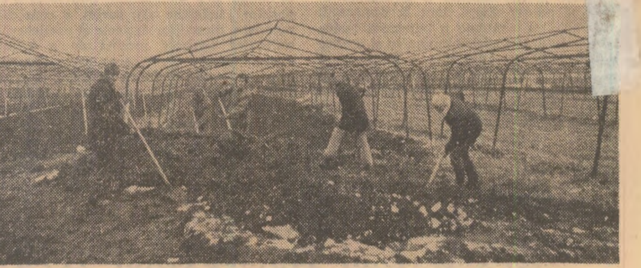
Ferma legumicolă a C.A.P. Costuleni. Se lucrează la fertilizarea solurilor.

Pentru a participa cu 1103 tone de legume la aprovizionarea municipiului Iași, comuna Costuleni trebuie să producă în acest an 2 300 tone legume, diferența constituînd-o consumul local. Cele 2 300 tone sînt planificate să se realizeze astfel: 600 tone — în cooperativa agricolă de producție; 1 700 tone — în gospodăriile populației.