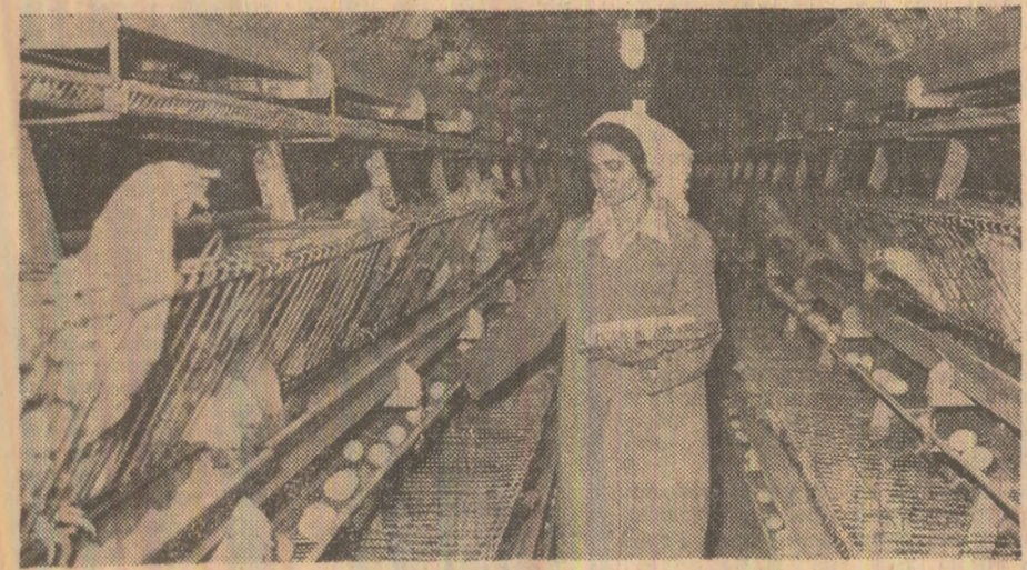
I.A.S. „Avicola”. Zilnic pleacă de aici în magazinele Iașului 150 000 ouă.

Pagină realizată de Mihai Ionescu și Manole CORCACI, corespondenții „Șcinteia”