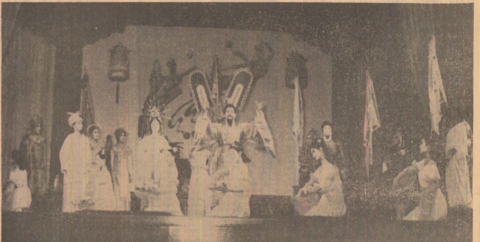
Moment din programul coregrafic și muzical oferit de artiștii chinezi

celor două țări, au fost evidențiate noi posibilități pentru dezvoltarea, prin eforturi comune, a cooperării și colaborării româno-chineze, în deosebi în domeniul carbonifer, al metalelor neferoase, precum și în alte domenii de interes comun, inclusiv al cercetării științifice. În legătură cu valorificarea acestor posibilități, a fost subliniat utilitatea unui acord-program de lungă durată și s-a convenit încheierea unor acorduri și înțelegeri concrete între organele economice din cele două țări. În cadrul convorbirilor a fost reafirmată convingerea că intensificarea și diversificarea colaborării și cooperării economice româno-chineze servesc construcției socialiste în cele două țări, ridicării continue a nivelului de trai, material și spiritual, al celor două popoare, prosperității lor. Convorbirile s-au desfășurat într-o atmosferă cordială, prietenească, caracteristică bunelor relații dintre cele două țări, partide și popoare.