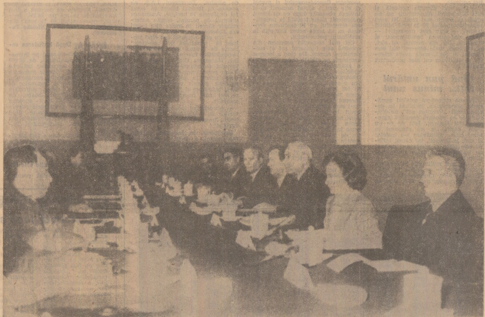
chineză pentru dezvoltare economică și socială în România și China.

În cea de-a doua rundă de convorbiri, tovarășii Nicolae Ceaușescu și Hu Yaobang au continuat schimburi de păreri și informare reciprocă în legătură cu desfășurarea construcției socialiste în cele două țări și cu experiența acumulată și activitatea desfășurată de P.C.R. și P.C.C., de poporul român și poporul