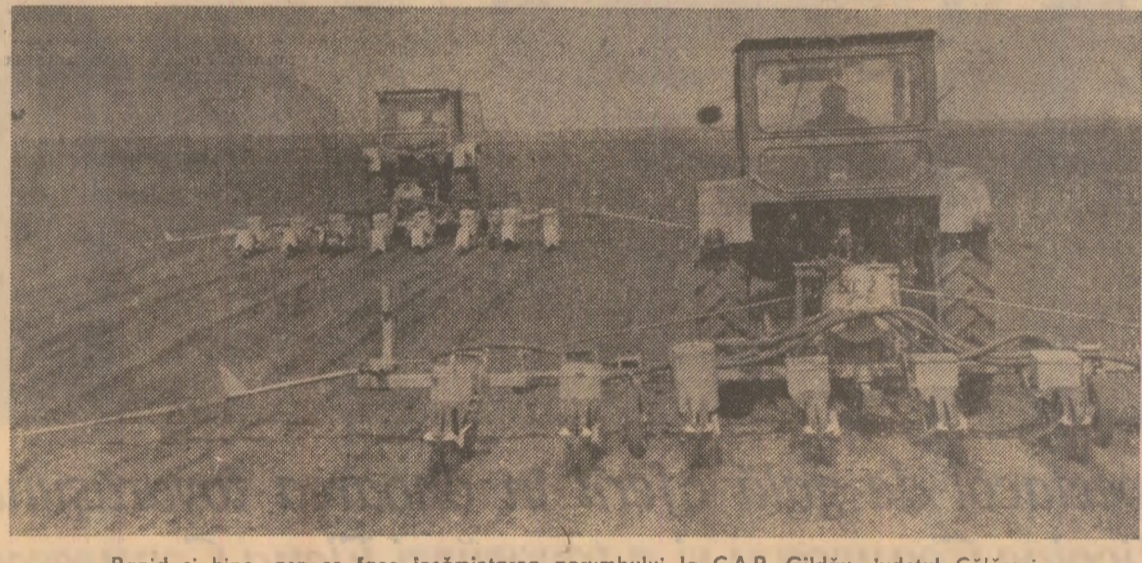
Rapid și bine, așa se face însămînțarea porumbului la C.A.P. Gildău, județul Călărași