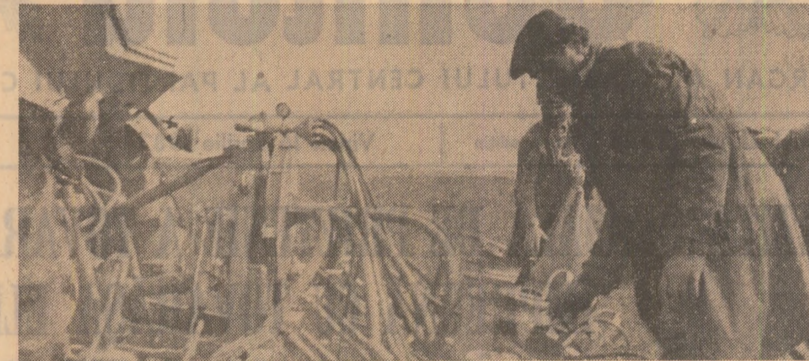
Prin buna organizare a muncii în câmp, la C.A.P. Jegălia, județul Călărași, se realizează viteze superioare la însămînțarea porumbului