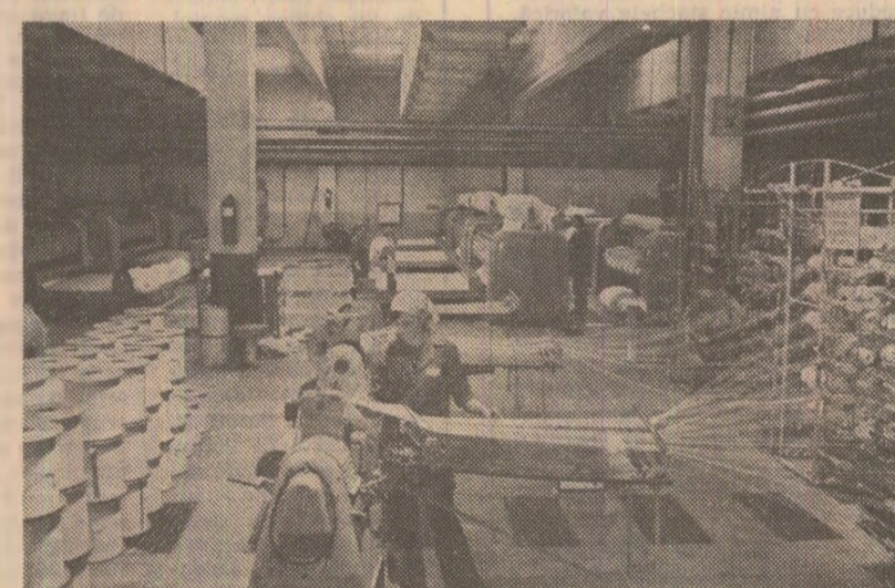
Aspect de la întreprinderea „Netex” din Bistrița

Din multitudinea faptelor de acest gen relatate de interlocutori ne vom opri numai la două, mai semnificative.