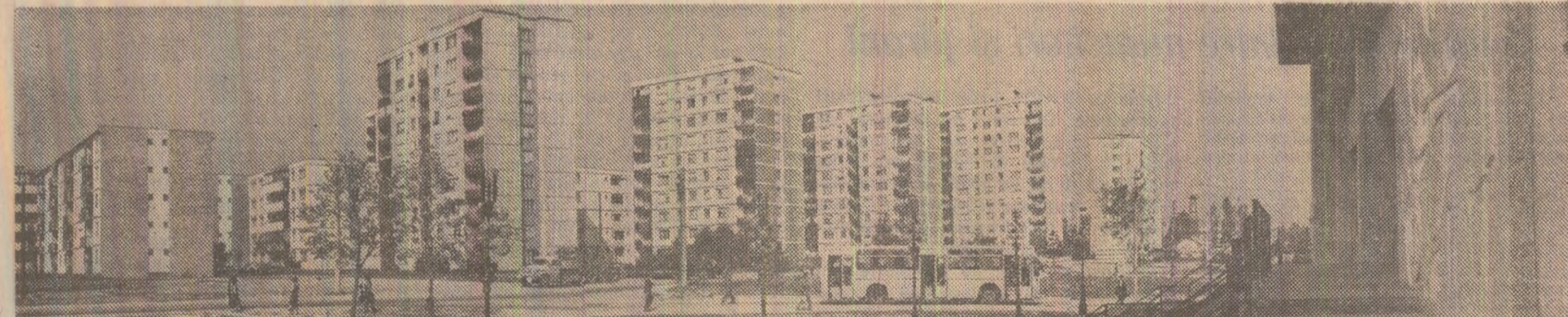
Cimpina '82 — imagine grăitoare a noii sale arhitecturi

În întrecerea ce se desfășoară în cîntec zilei de 1 Mai, oamenii muncii din industria județului Bacău au raportat ieri îndeplinirea planului pe primele patru luni din acest an. Avansul de timp cîștigat creează industria băcăneană posibilitatea să realizeze pînă la finele lunii aprilie o producție suplimentară în valoare de peste 200 milioane lei, concretizată în circa 140.000 tone produse petroliere, 6.000 tone de cărbune, 1.000 tone antidunatori, 7.000 tone toluen, 350 tone polistiren, 240.000 mp țesături, confecții textile în valoare de (6,5 milioane lei și alte produse. (Gh. Baltă).