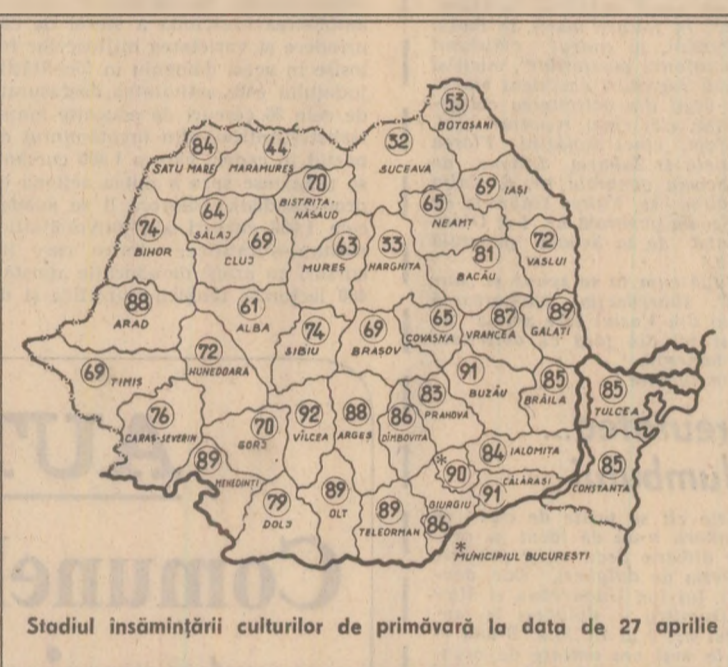
Stadiul însemnării culturilor de primăvară la data de 27 aprilie

În această perioadă se pot cîștiga zile și ore prețioase prin organizarea acțiunilor de întruajurării.