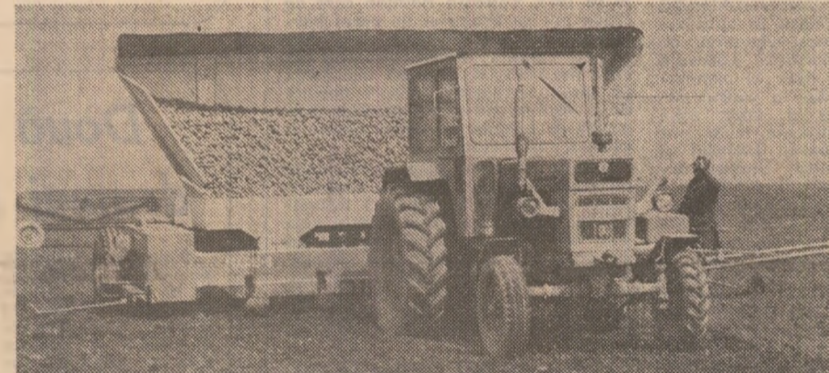
Plantarea cartofilor în unități agricole din județul Harghita: la stațiunea de cercetare și producere a cartofilor (fotografia din stînga) și la cooperativa agricolă Sînmartin (fotografia din dreapta)