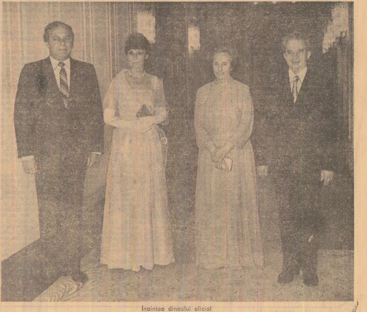
Înaintea dineului oficial