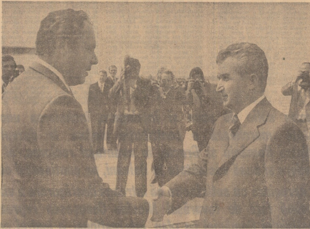
La sosirea pe aeroportul Otopeni