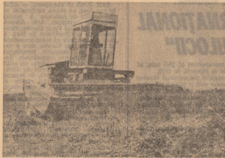
Se recoltează masa verde la I.A.S. Mogoșoaia, sectorul agricol Ilfov.