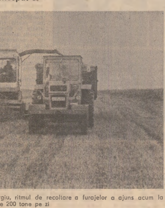
La I.A.S. Adunații Copăceni, Județul Giurgiu, ritmul de recoltare a furajelor a ajuns acum la peste 200 tone pe zi

TULCEA : Agricultorii harnici încheie prima prașilă, în timp ce alții nici n-au început-o. În pofida timpului instabil, lucrătorii