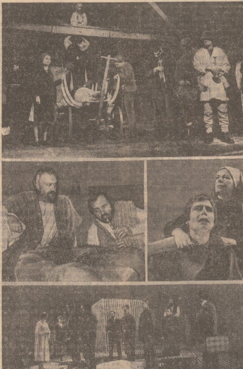
Imagini din spectacole consacrate devenirii noastre istorice (pe scena Teatrului Mic din București; Teatrului dramatic din Brașov; Teatrului Național din Cluj-Napoca și Teatrului municipal din Focșani)

Constituindu-se, cu certitudine, ca una din trăsăturile noastre și simțirea istoriei poporului nostru. Constituindu-se, cu certitudine, ca una din trăsăturile noastre și simțirea istoriei poporului nostru. Constituindu-se, cu certitudine, ca una din trăsăturile noastre și simțirea istoriei poporului nostru.