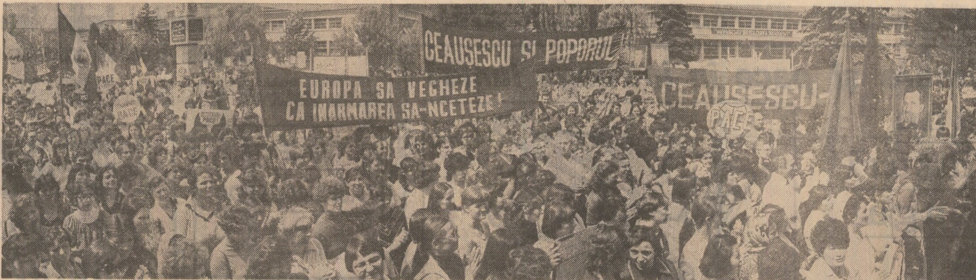
Aspect de la mitingul pentru pace și dezarmare de la Întreprinderea de piese radio și semiconductori Băneasa

Asemenea mitinguri, urmate de semnarea Apelului, au avut loc și la Fabrica de zahăr și Întreprinderea de mobilă din Giurgiu. (Petre Cristea, corespondentul „Scintei”).