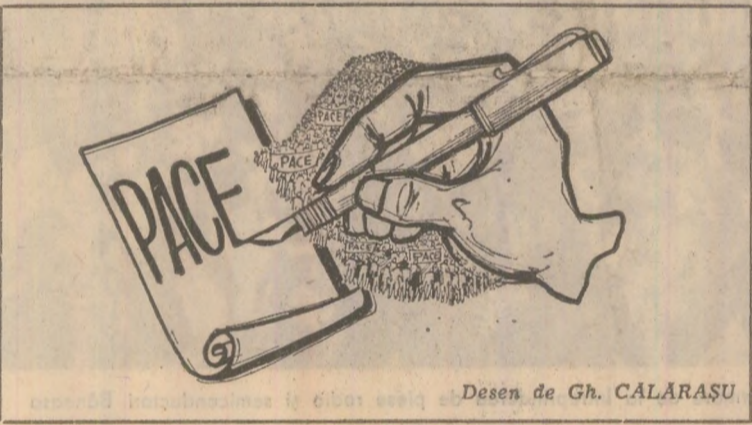
Desen de Gh. CALĂRAȘU

In pagina a II-a: relatări de la adunări și mitinguri