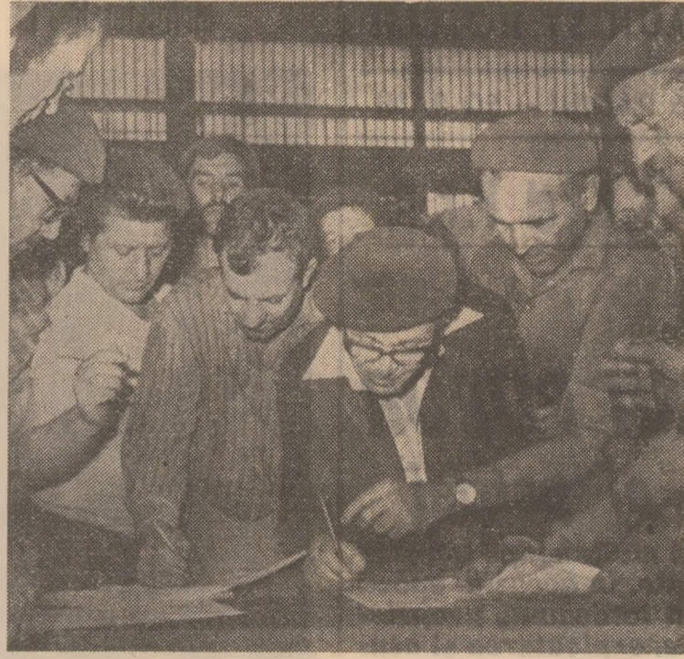
La întreprinderea de țevi „Republica” din București, oamenii muncii semnează Apelul adresat sesiunii speciale a O.N.U. consacrată dezarmării

Într-o atmosferă de puternică entuziasm, mîile de participanți la miting au adoptat o telegramă adresată C.C. AL P.C.R., TOVARĂȘULUI NICOLAE CEAUȘESCU, în care se spune: „Vă mulțumim din inimă pentru activitatea neobosită ce o desfășurați pentru fericirea poporului nostru, pentru pacea și