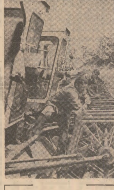
Verificarea combinelor la S.M.A. Caracal, județul Olt.

remedierea defecțiunilor în cîmp, mai sînt necesare 20 tone de carbid și 150 tone de cărbune de forjă. ● Direcția de specialitate din Ministerul Agriculturii trebuie să i-livreze cât mai urgent cele 50 de remorci M.S.C.N.-6 necesare, pentru semănat direct în mîrișe. ● Există un deficit de 7.500 tone capacitate de transport pe zi. Aceasta deoarece organele de specialitate din Ministerul Agriculturii au inclus în calculul mijloacelor de transport și remorci din dotarea stațiilor de mecanizare, care însă în acest an vor fi ataseate în spelele combinelor pentru colectarea plevelor. Supunem aceste probleme atenției Ministerului Agriculturii și Ministerului Transporturilor și Telecomunicațiilor pentru a lua măsuri grabnice pentru a se impune. Sorțiiului este necesar ca atât mai mult cu cît mai sînt oțzine zile pînă la începerea seceriiului și, tocmai de aceea, trebuie create toate condițiile ca recolta de cereale păsoase să fie strînsă și depozitată în cel mai scurt timp și fără pierderi.