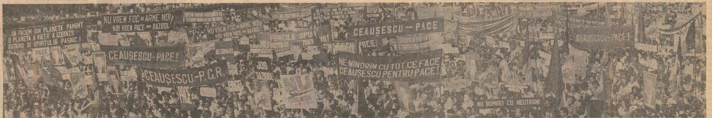
Imagine de la marșul pentru pace desfășurat ieri în sectorul 5 al Capitalei. În pagina a V-a : relații de la marșurile și mitingurile ce au avut loc în țară

În aceste zile, cînd la O.N.U. se desfășoară sesiunea specială consacrată dezarmării, glasul de pace al poporului român se face puternic auzit în întreaga țară prin mitingurile și marșurile la care participă sute de mii de oameni