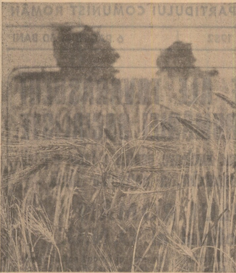
Secerișul orzului la C.A.P. Zimnicea, județul Teleorman

Acum, la începutul campaniei de recoltare a orzului în județul Călărași, în majoritatea unităților agricole munca este bine organizată, se dovedește grija pentru a nu pierde nici o zi, nici o oră bună de lucru. (Rodica Simionescu, corespondentul „Scintei”).