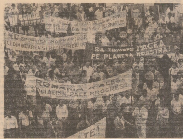
Doi imagini de la marșul al cetățenilor din sectorul I al Capitalei