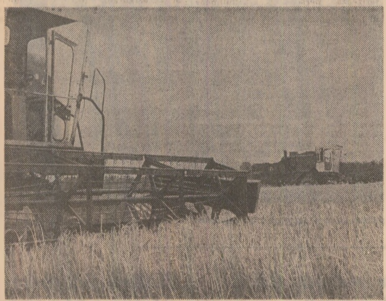
La cooperativa agricolă din Adunaţi Copăceni, judeţul Giurgiu, combinele string recolta de orz de pe ultimele hectare