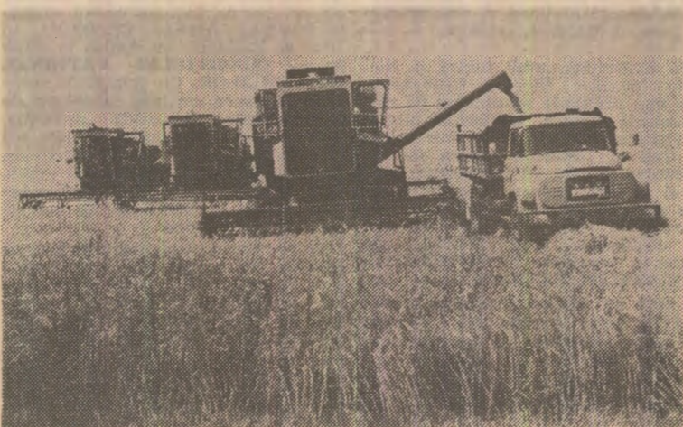
Secerîșul orzului la C.A.P. Ianca, județul Olt.

ÎN PAGINA A III-A, relatări din județele Brăila, Teleorman, Dolj și Galați