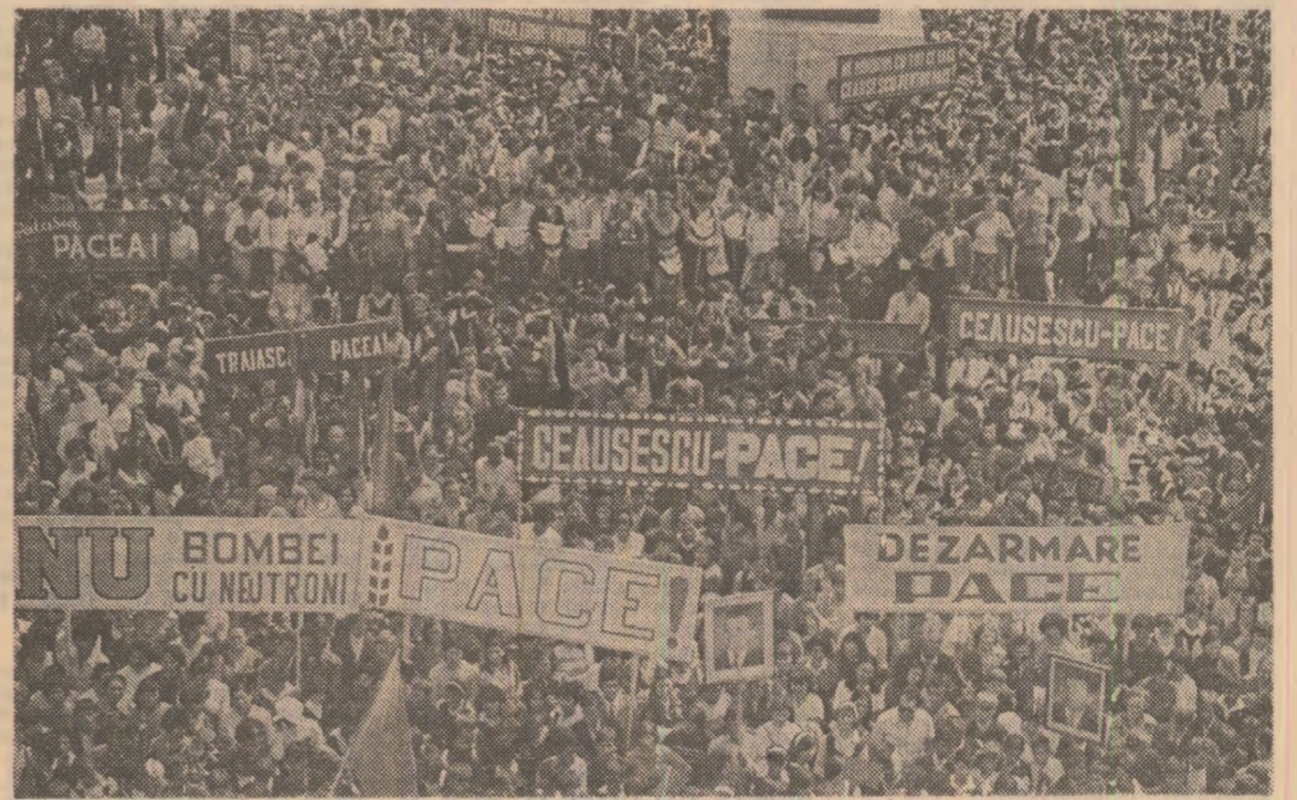
În întreaga țară continuă adunările și marșurile populare consacrate dezarmării, pentru pace. Publicăm în pagina a IV-a, relatări ale reporterilor și corespondenților noștri.

(Din APELUL POPORULUI ROMÂN adresat sesiunii speciale a Organizației Națiunilor Unite consacrată dezarmării)