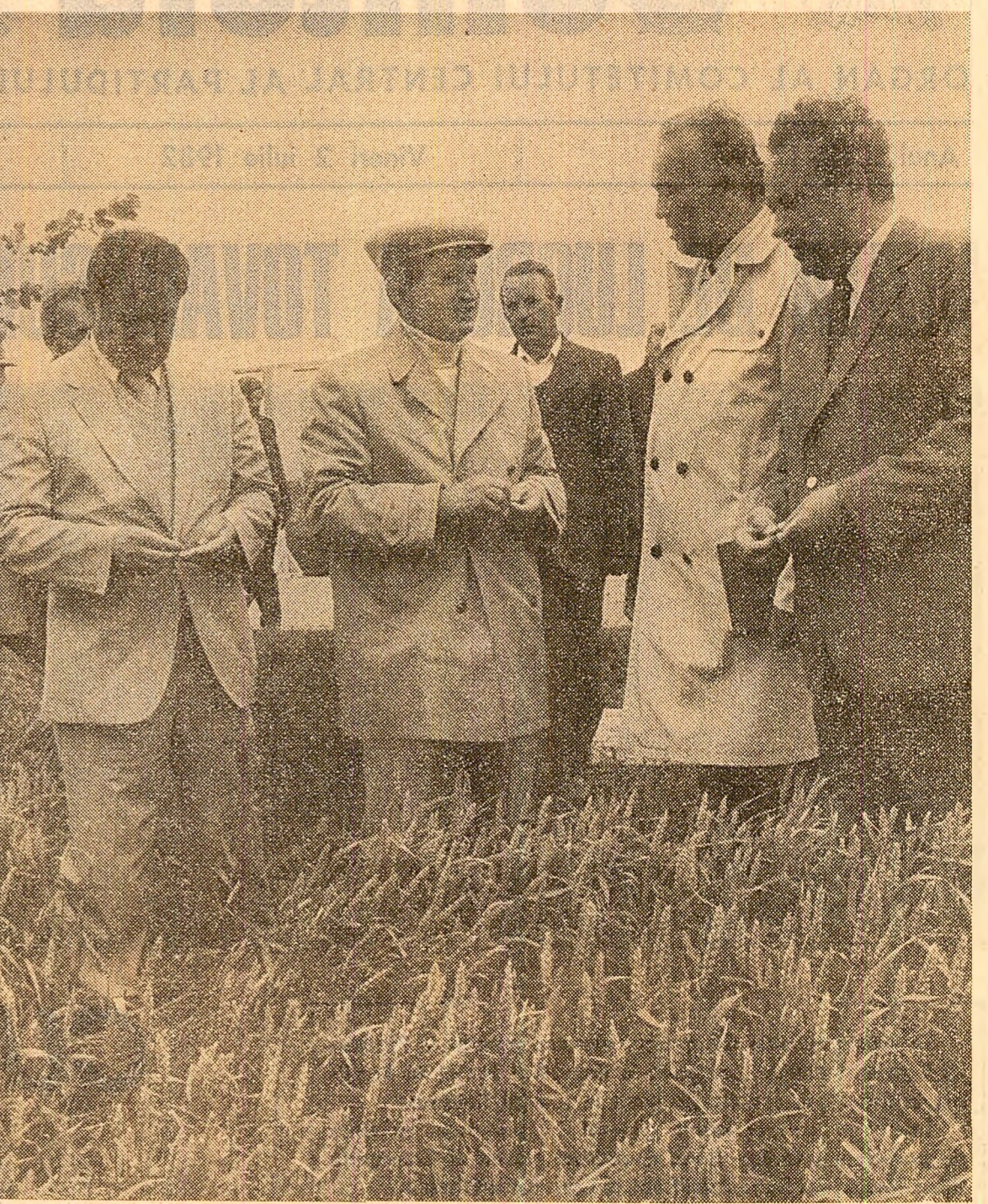
În lanurile cooperativei agricole de producție din comuna Flămînzii

Tovarășul Nicolae Ceaușescu a vizitat apoi ÎNTEPRINDEREA „INTEGRATA” DE IN din Botoșani, unitate la care colectivul de muncitori este format în majoritate de absolvenți ai școlii profesionale și al liceului de specialitate din municipiu. Și aici, dialogul secretarului general