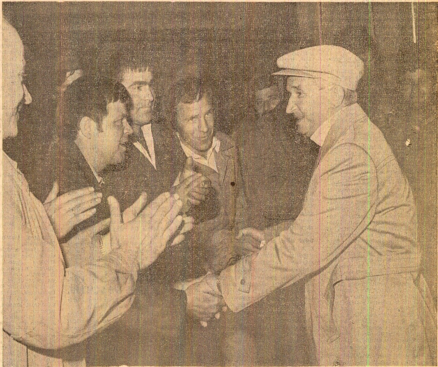
La Întreprinderea de utilaje și piese de schimb din Botoșani