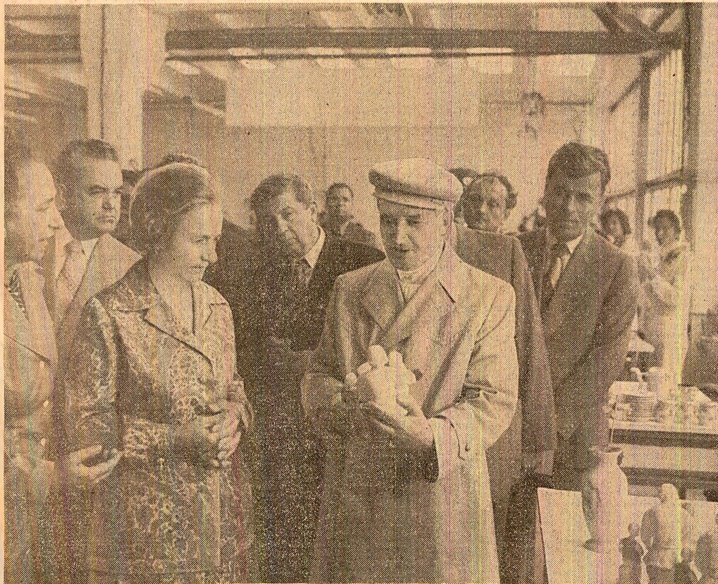
La Întreprinderea de sticlărie și porțelan din Dorohoi

Cu prilejul vizitei de lucru în județul Suceava a tovarășului Nicolae Ceaușescu, secretar general al Partidului Comunist Român, președintele Republicii Socialiste România, astăzi va avea loc în municipiul Suceava o adunare populară pe care posturile de radio și televiziune o vor transmite direct în jurul orei 17.