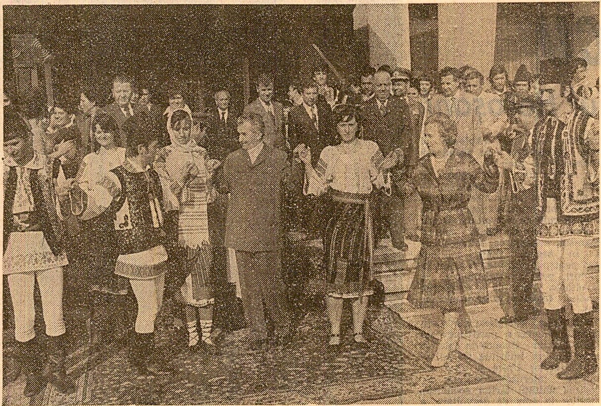
La plecarea din municipiul Botoșani

Întreprinderea noastră se numără printre unitățile industriale cele mai puternice ale județului Botoșani, ea fiind rodul înțelepției politice a partidului nostru, promovată cu consecvență în anii ce au urmat Congresului al IX-lea, pentru dezvoltarea puternică a forțelor de producție și repararea armonioasă a acestora pe tot teritoriul țării — așa cum ați subliniat, mult stimate tovarășe