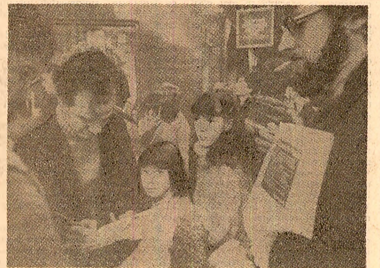
Sesiunea specială a Adunării Generale a O.N.U. consacrată dezarmării a luat sfârșit, dar marile mișcări populare în sprijinul înfățișării pericolului nuclear continuă în întreaga lume. Agențiile de presă transmit zi de zi noi relații despre demonstrații, marșuri de protest, campanii de semnături pe opeluri și petiții în favoarea păcii. În imagine: pe una din străzile pariziene, cetățeni semind un asemenea opel

NAȚIUNILE UNITE 13 (Agerpres). — La sediul din New York al Națiunilor Unite a fost dat publicității ordinea de zi preliminară a viitoarei sesiuni ordinare a Adunării Generale a O.N.U., care se va deschide, conform tradiției, în cea de-a treia zi de marti a lunii septembrie. Frintre cele 131 de puncte care figurează de or-