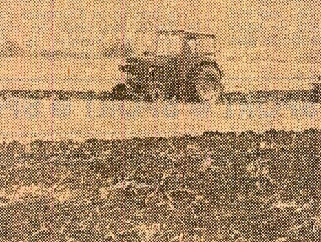
La C.A.P. Vețel, județul Hunedoara, se efectuează, pe mari suprafețe, arăturile de vară

pot asigura condiții pentru o însămînțare corectă și o răsărire uniformă a plantelor; în plus, calitatea arăturilor și a pregătirii terenului condiționează în măsură direct rezultatul deosebit de optim de plante la unitatea de suprafață.