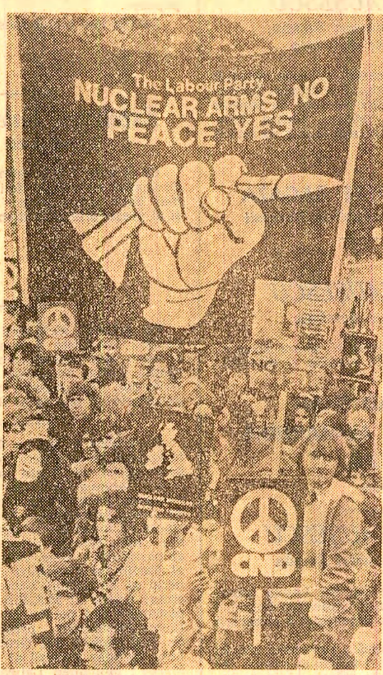
Manifestație la Londra împotriva armelor nucleare, pentru pace