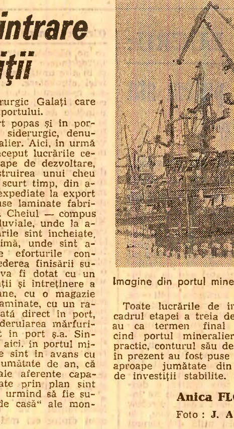
Imagine din portul mineralier Galați

Combinatul siderurgic Galați care sînt destinate exportului. Făcăm un scurt popas și în portul combinatului siderurgic, denumit portul mineralier. Aici, în urmă cu trei ani a început lucrările celei de-a treia etape de dezvoltare, constînd în construirea unui cheu de expediție. În scurt timp, din acest port vor fi expediate la export o serie de produse laminate fabricate în combinat.