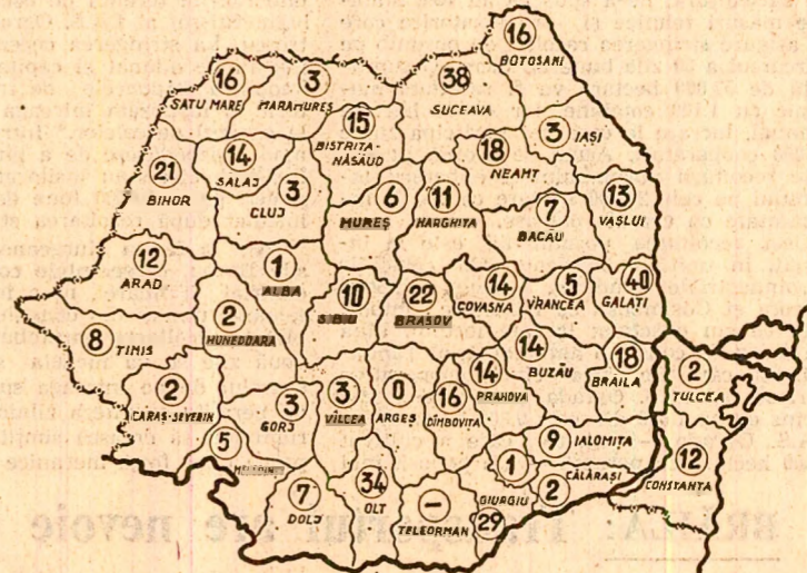
Stadiul recoltării cartofilor de toamnă în seara zilei de 8 septembrie

Ne aflăm într-o perioadă de vîrf a muncilor agricole cînd, concomitent cu recoltarea florii-soarelui, legumelor, porumbului și a altor culturi de toamnă, important este ca întreaga producție de cartofi să fie strînsă cu grijă, transportată în timpul cel mai scurt și depozitată în condiții corespunzătoare. Potrivit datelor furnizate de Ministerul Agriculturii și Industriei Alimentare, pînă în seara zilei de 8 septembrie în unitățile agricole cartofii au fost strînși de pe 20 500 hectare — 16 la sută din suprafața cultivată. În județul Suceava, unul din județele mari producătoare de cartofi, producția a fost strînsă de pe 38 la sută din suprafața cultivată, iar în județul Brașov — tot mare producător — de pe 22 la sută din suprafața aflată în cultură. Recoltarea este avansată și în alte județe care cultivă suprafețe mai mici — Olt, Giurgiu și Galați.