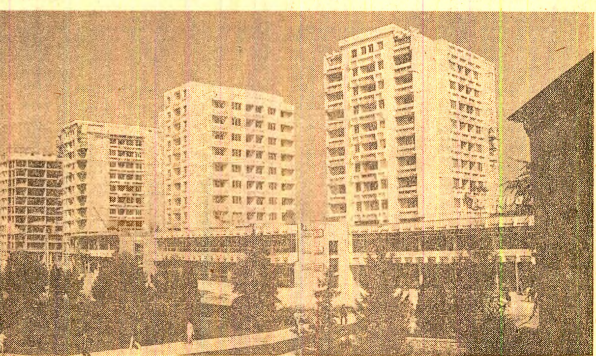
Noi construcții de locuințe în municipiul Pitești

Vă asigurăm, mult stimat tovarășe secretar general, că nu vom precupeți nici un efort pentru a ne încadra în epoca optimă cu semănatul celor 107.050 hectare cu orz, grîu, culturi pentru masă verde.