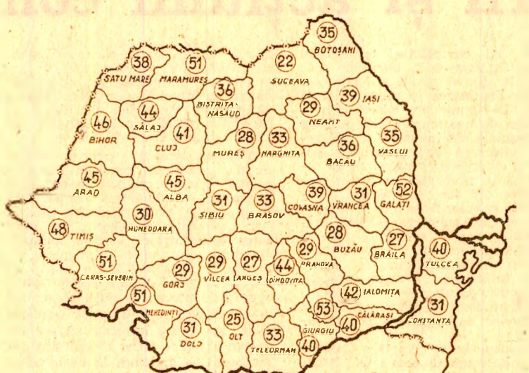
Stadiul însușirii furajelor în cooperativele agricole la data de 16 septembrie

De bună seamă, situația actuală în ce privește recoltarea și depozitarea furajelor pentru iarnă este necorespunzătoare. Este o situație care pune în evidență neajunsuri serioase în organizarea activității din multe unități, insuficiența controlului din partea organelor agricole asupra desfășurării activității campaniei de recoltare a furajelor. Cu totul de neînțeles este faptul că continuă să se manifeste tendința de tergiversare a lucrărilor tehnice în multe din acele unități care iarna trecută s-au confruntat cu mari dificultăți în ce privește hrănirea animalelor. Ne referim la cooperativele agricole din județele Teleorman, Satu Mare, Viteza și Dolj, care au recolat, pînă la 16 septembrie, doar între 27 și 39 la sută din cantitățile de porumb siloz prevăzute. Este bine cunoscut că porumbul siloz, pe cel din culturile duble, care însumează mai multe sute de mii de hectare, riscă să se degradeze odată cu căderea primelor brume ale toamnei. De aceea, recoltarea și însușirea acestei imense cantități de masă verde nu poate și nu mai trebuie amînată sub nici un motiv! Cu atît mai mult trebuie să se acționeze pentru a grăbi stringerea și însușirea porumbului siloz, și a producției din acest are este foarte bună, iar zootehnia are nevoie imediat de cit mai multe furaje. Pretutindeni, în toate județele, în toate unitățile, sarcina subînaltă de secretariat general al partidului, respectiv a comitetului de lucru, a consfătuirea de lucru de la C.C.