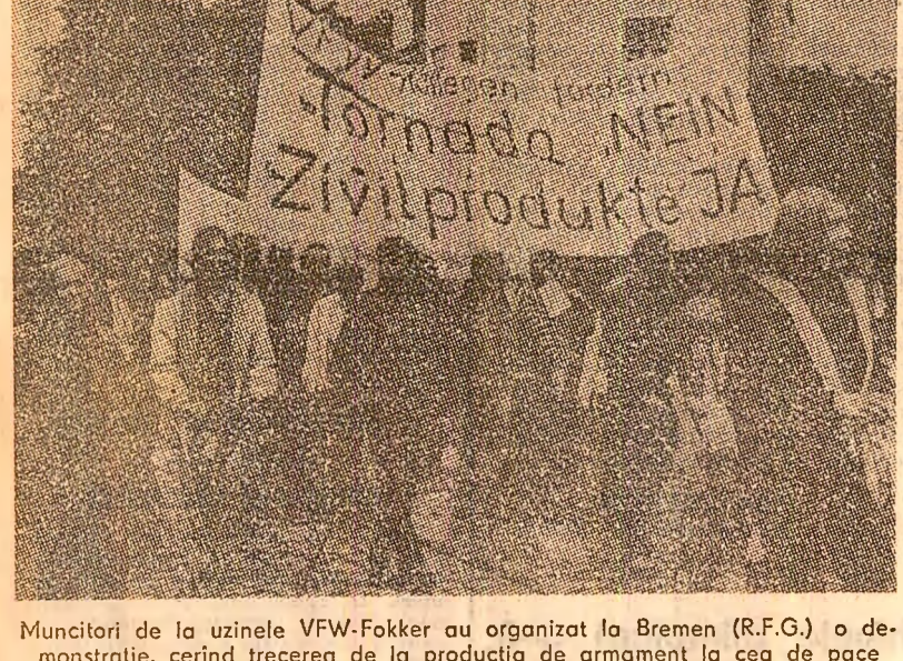
Muncitorii de la uzinele VFW-Fokker au organizat la Bremen (R.F.G.) o demonstrație, cerind trecerea de la producția de armament la cea de pace

— declară președintele Internaționalei Socialiste VIENA 22 (Agerpres). — Președintele Internaționalei Socialiste, Willy Brandt, a lansat un apel la o modificare radicală a politicii față de țările în curs de dezvoltare, ca mijloc de depășire a crizei economice globale. Luând cuvântul în cadrul sesiunii de la Viena a Internaționalei Socialiste, Willy Brandt a declarat: „Ceea ce ne este necesar ca adevărat este o politică complet nouă în combaterea crizei, cu măsuri eficiente de cuprindere a forței de muncă și care să înădească de fapt că o revitalizare substanțială a economiilor țărilor în curs de dezvoltare ar aduce cu sine și o ieșire din criza a statelor industrializate.”