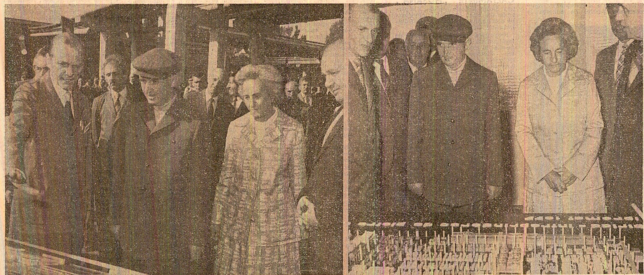
Imagini din timpul vizitei la Întreprinderea de rulmenți și la Întreprinderea de pietre de polizor din municipiul Birlad