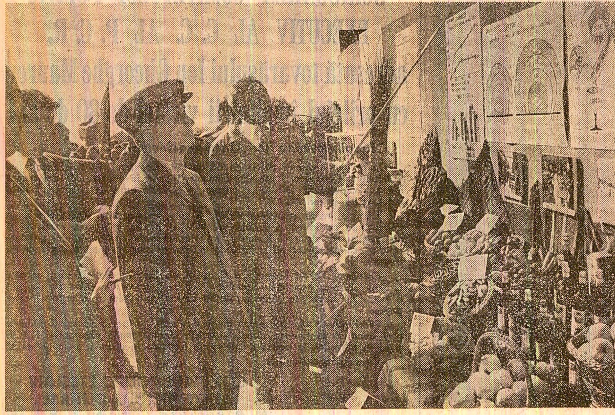
La Bogești se vizitează expoziția realizărilor din agricultura, industria alimentară și mica industrie din județul Vaslui

Secretarul general al partidului dă o înaltă apreciere acestor rezultate și adresează calde felicitări specialiștilor vasluieni pentru preocuparea lor de a reda circuitului arabil suprafețe tot mai întinse de teren considerate mult timp impropriz pentru producția agricolă.