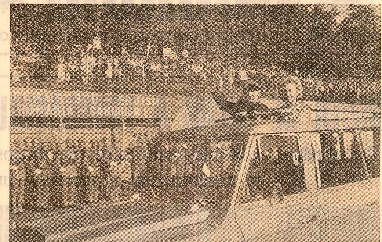
Locuitorii Birladului i-au primit cu bucurie, cu entuziasm pe oaspeții dragi

Secretarul general al partidului dă o înaltă apreciere acestor rezultate și adresează calde felicitări specialiștilor vasluieni pentru preocuparea lor de a reda circuitului arabil suprafețe tot mai întinse de teren considerate mult timp impropriz pentru producția agricolă.