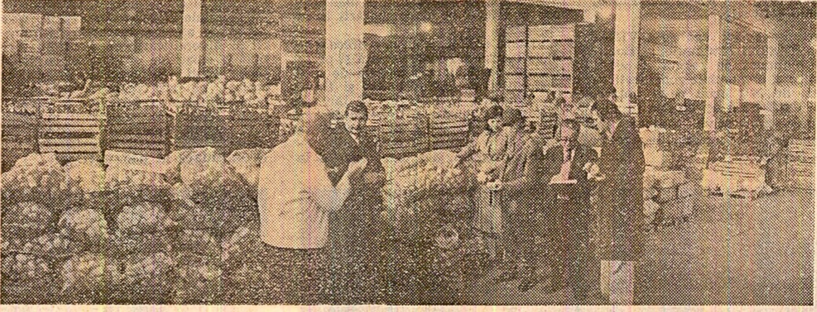
I.L.F. Bercești. Legumele, sortate cu grijă și răspundere, sint pregătite spre a fi livrate unităților de desfacere

Spirit gospodăresc. Harnicii cooperarii din comuna Tudor Vladimirescu, județul Brăila, nu se dezîntă în această toamnă plină de belșug. Ei au pornit la recoltarea porumbului manual și mecanic cu hotărîrea fermă de a nu risipi nici un bob. În urma fiecărei combine merg cite doi oameni care recuperează stivuleții căzuți și-și arunca imediat în remorci. Deci la 9 combine două 18 oameni, în loc de 40-50 citi s-ar folosi dacă sola ar fi „curățată” de stivuleții căzuți ulterior. Acțiune bună, care s-ar putea foarte bine generaliza. (Corneliu Iftim).