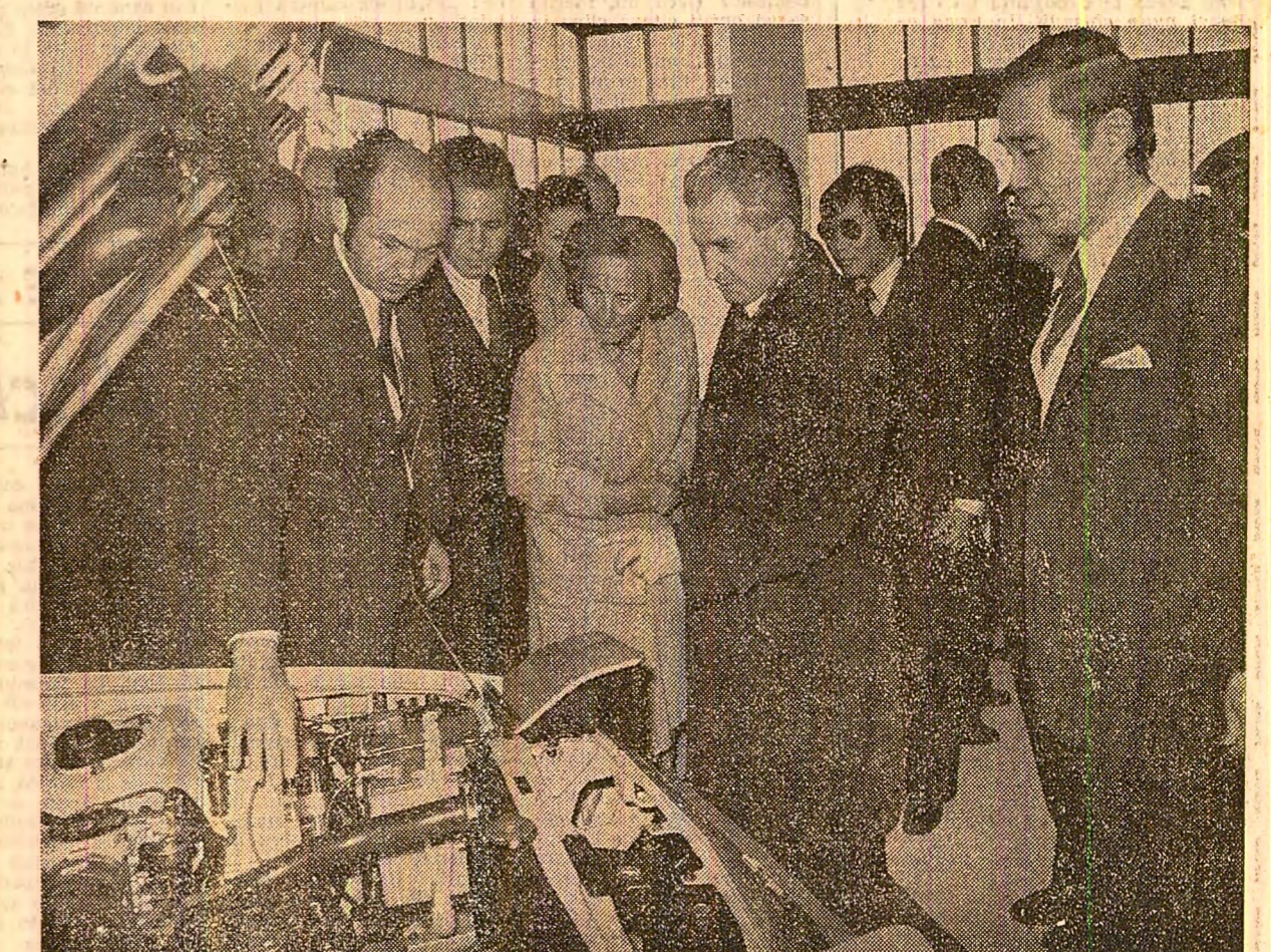
Aspecte din timpul vizitei la standurile unor întreprinderi românești și firme de peste hotare