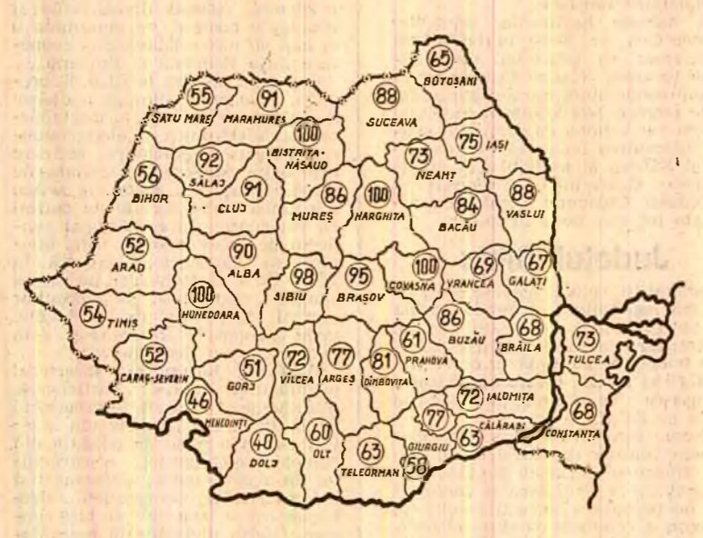
Stadiul însămîntării griului, în procente pe județe, în seara zilei de 10 octombrie

Am intrat într-o săptămînă hotărîtoare pentru încheierea însămîntărilor și strîngerea celei mai mari părți a recoltei care mai există pe câmp. Timpul este din nou favorabil, ceea ce face necesar ca pretutindeni să se lucreze din plin, cu toate că vremea este încă rece.