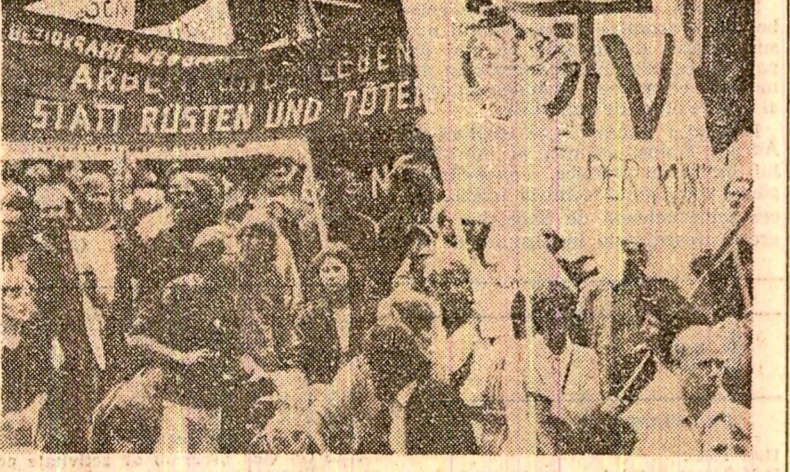
Aspect de la o mare demonstrație a partizanilor păcii din R.F. Germania, desfășurată în orașul Düsseldorf.

WASHINGTON. — Mișcarea împotriva armelor nucleare în a tot mai mare amplitudine în Statele Unite ale Americii. Potrivit ziarului „Los Angeles Times“, 276 de municipalități, 56 de consilii regionale, adunările legislative din 17 state, precum și electoratul statului Wisconsin s-au pronunțat, pînă în prezent, pentru interzicerea proiectării și producerii, experimentării și diseminării a noi tipuri de arme nucleare. Ziarul citat precizează că problema înghețării arsenalelor atomice va constitui tema centrală a dezbaterilor în vederea alegerilor legislative ce vor avea loc la 2 noiembrie.