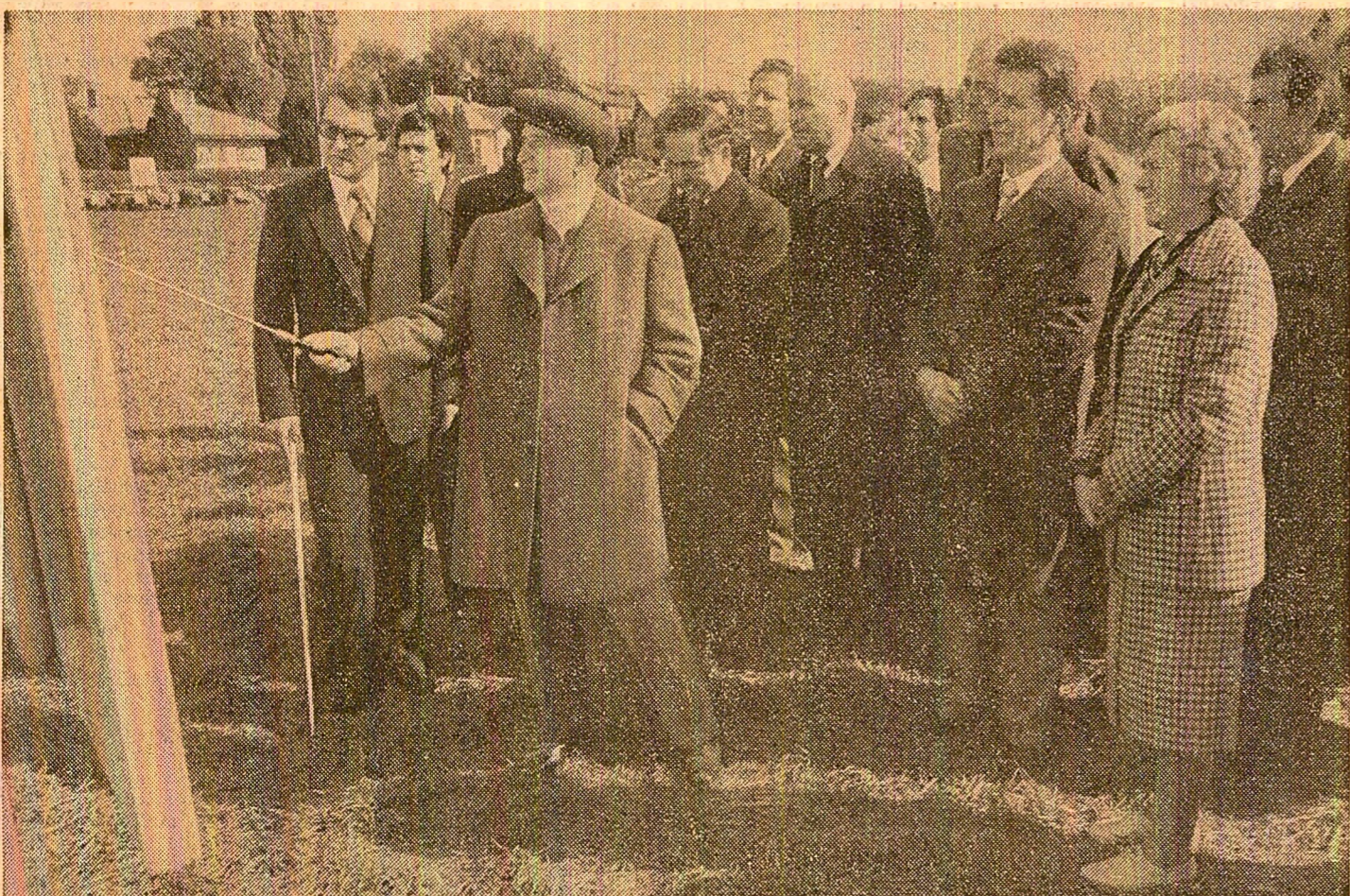
La Institutul de cercetare și producție Palas-Constanța