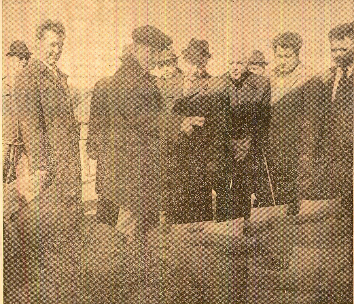
La I.A.S. Dorobanți