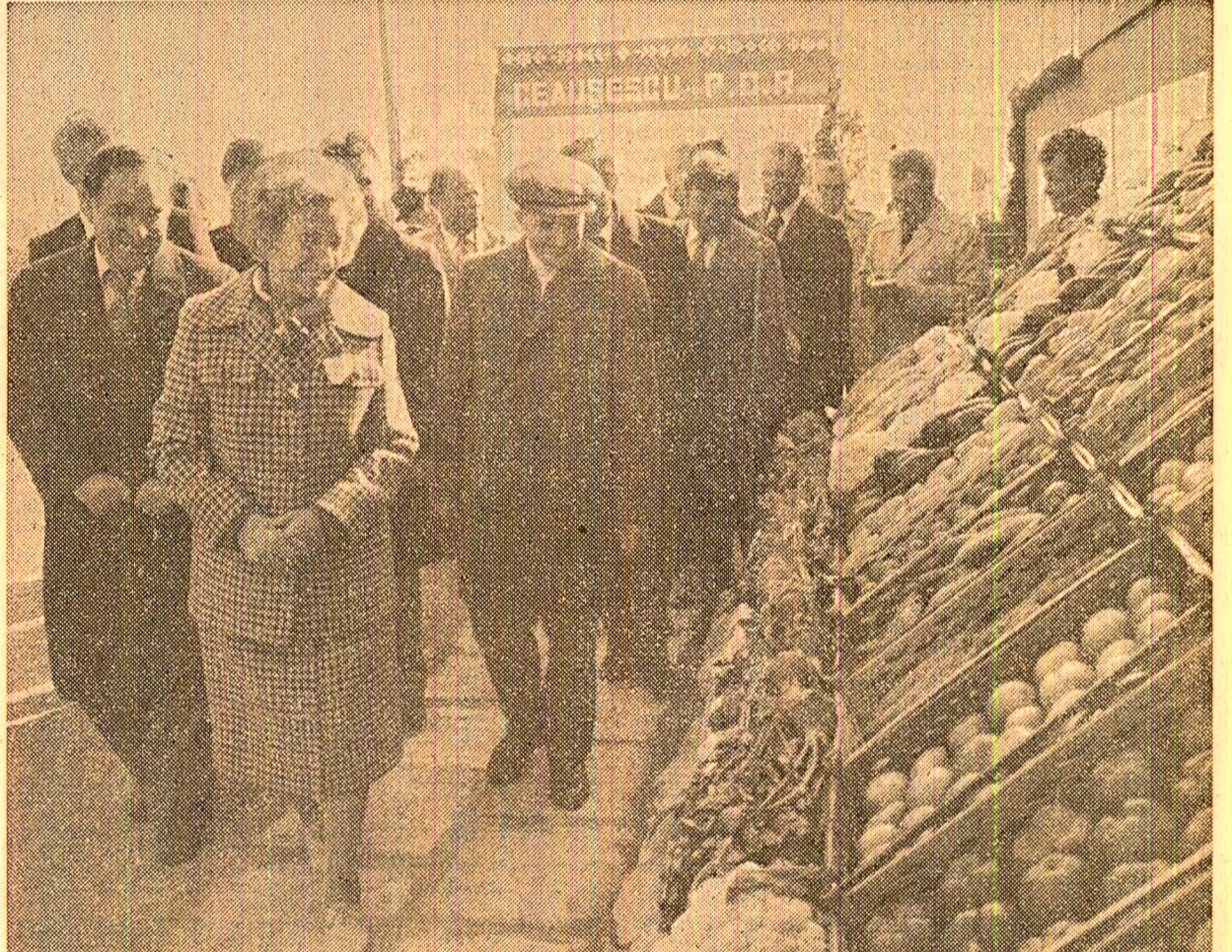
Sînt apreciate rezultatele producției la C.A.P. Chirnoieni