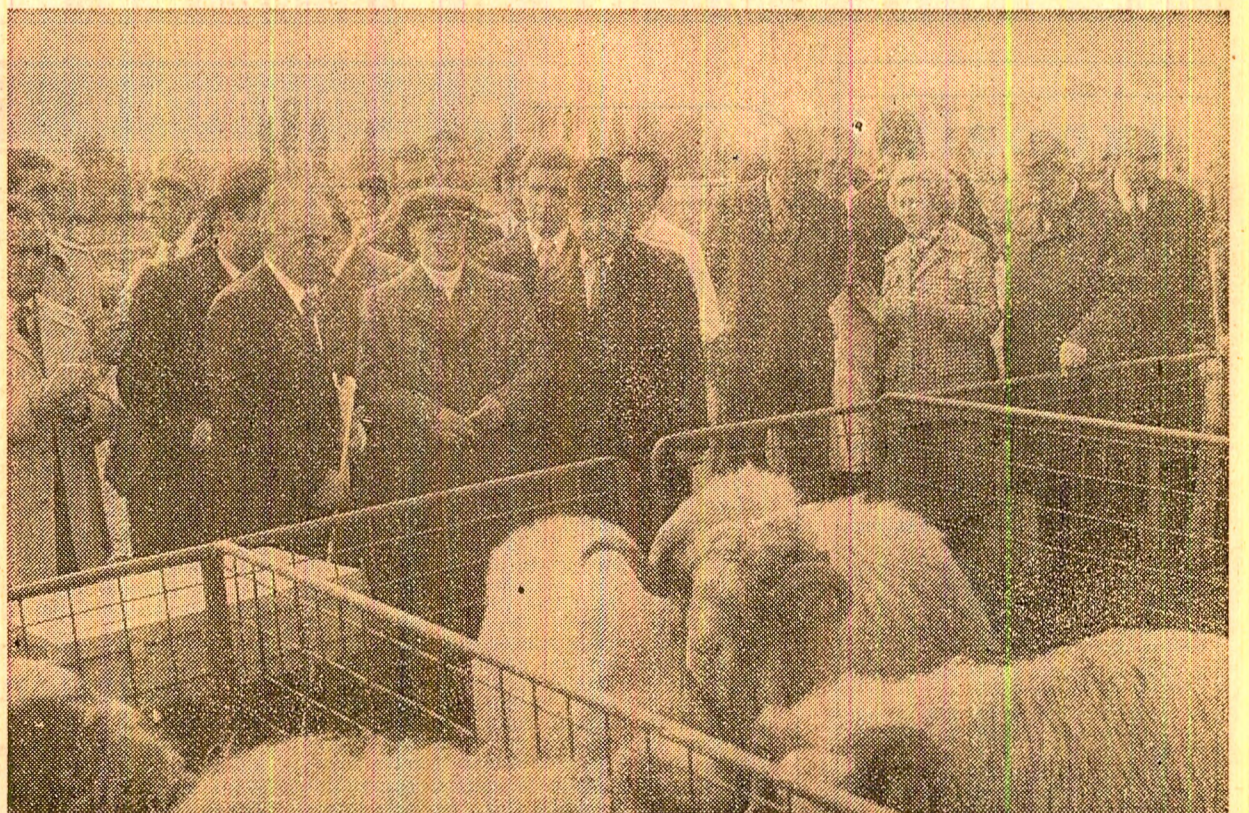
La Institutul de cercetare și producție Palas-Constanța