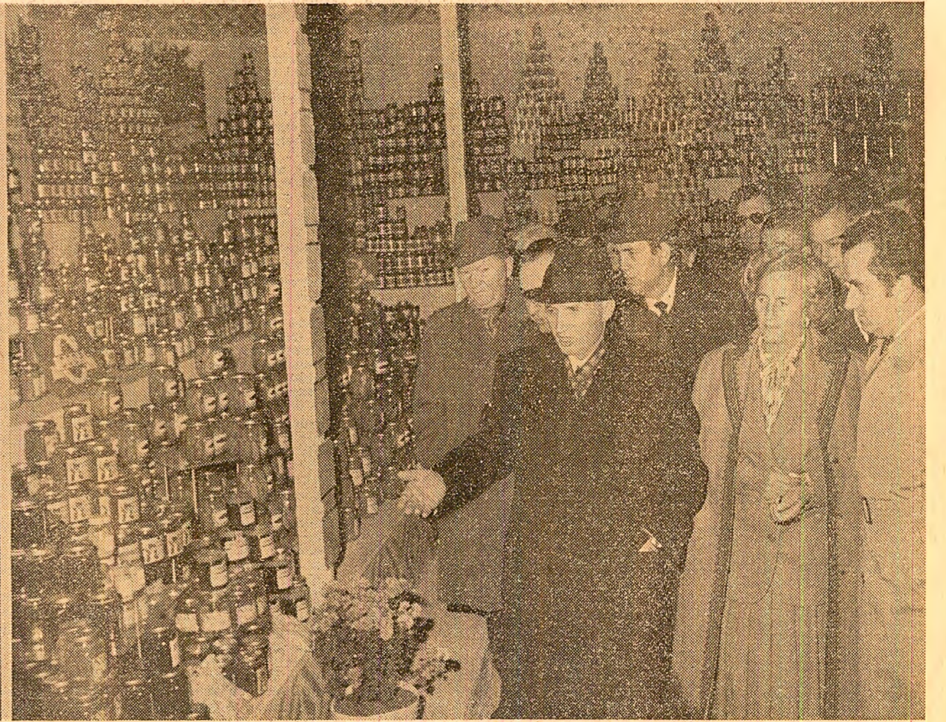
La expoziția realizărilor agriculturii dobrogene