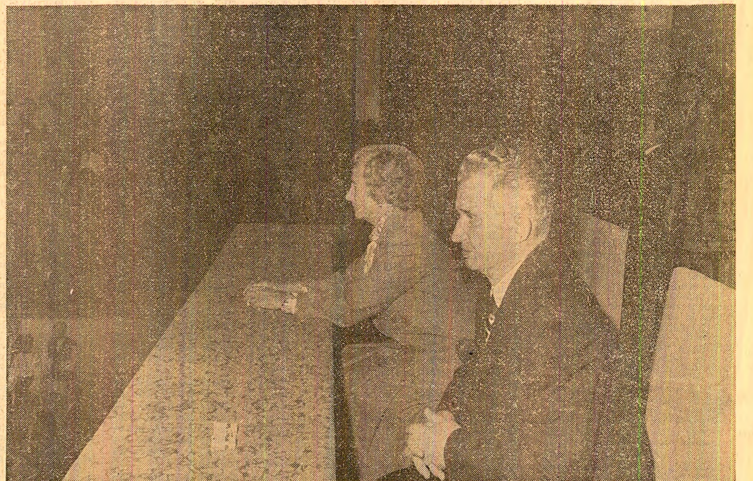
Moment din timpul spectacolului de gală