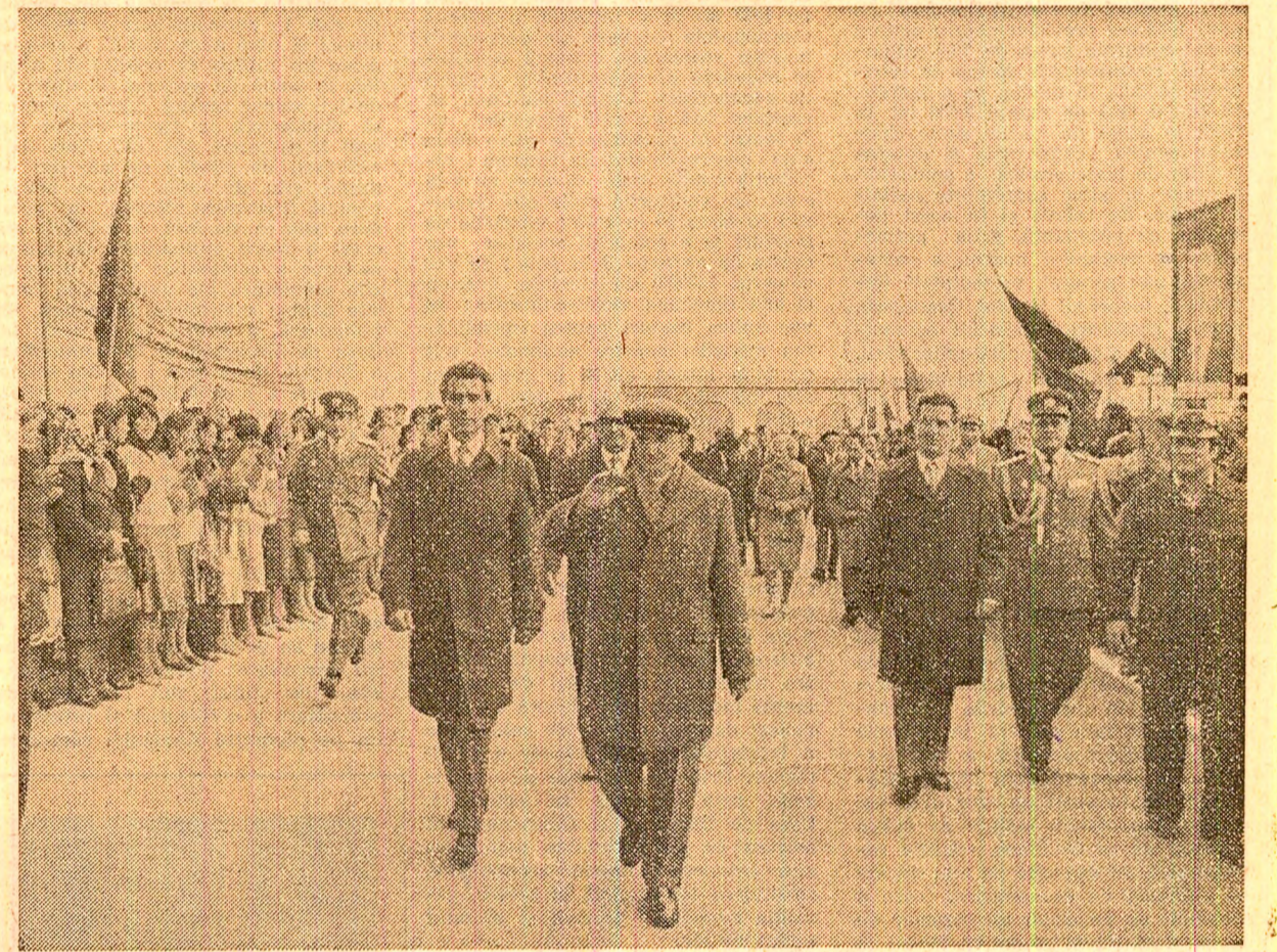
Primire călduroasă la Combinatul chimic Năvodari

În încheierea vizitei, adresîndu-se cooperativitorilor, tuturor celor prezenți, care ovăționează neîntrerupt, scandînd cu însuflețire numele partidului, al secretarului său general, tovarășul NICOLAE CEAUȘESCU , a spus: „Dragi tovarăși, vă felicit pentru rezultatele obținute în acest an și vă urez să obțineți succese și mai mari în toate domeniile, recolte și mai bogate. Multă sănătate și multă fericie!”.