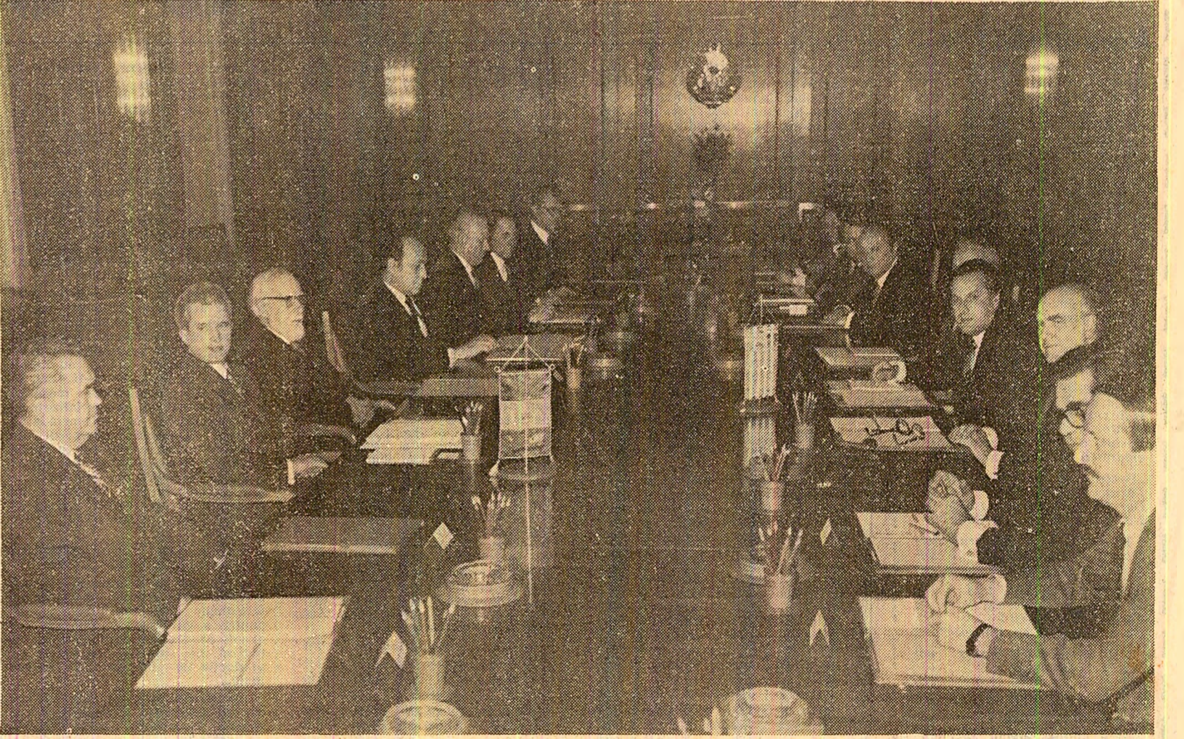
În timpul convorbirilor oficiale