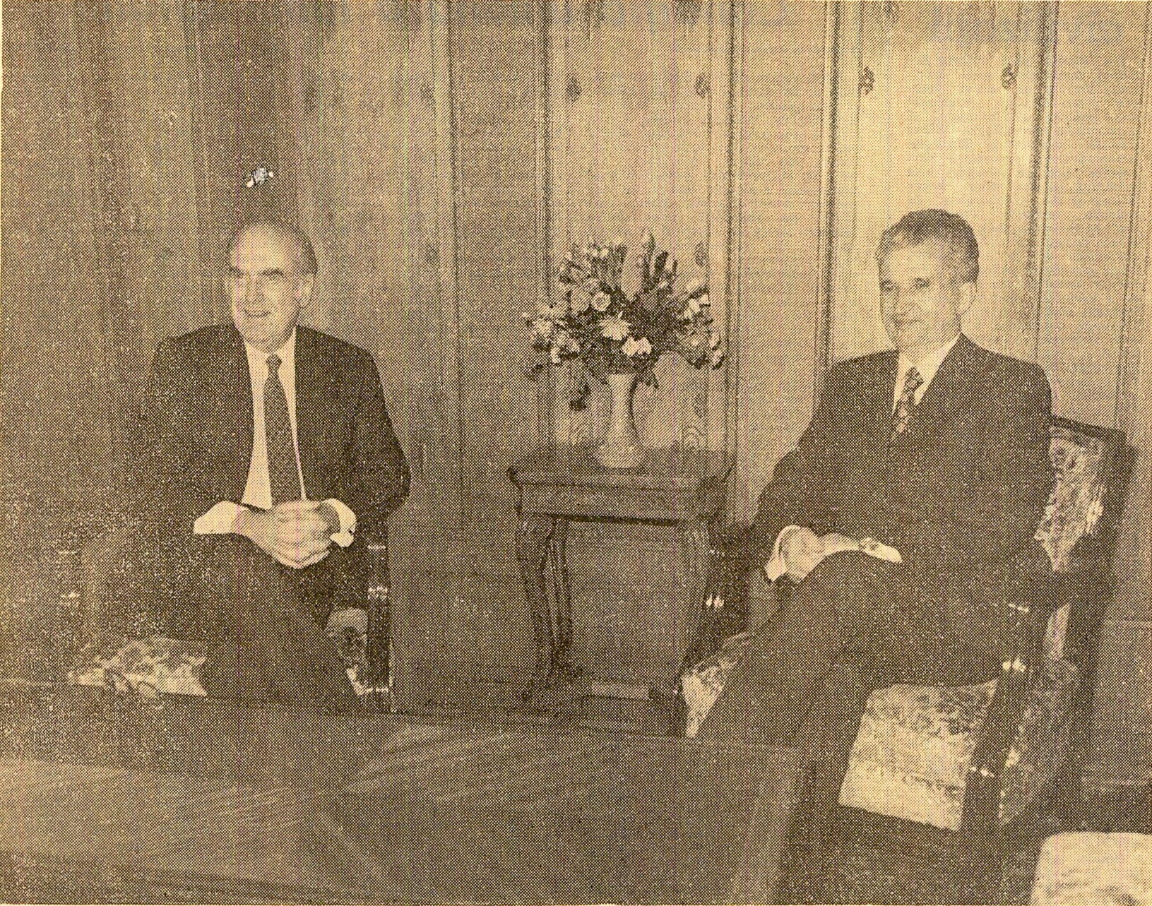
Moment de la întâlnirea dintre președintele Nicolae Ceaușescu și primul ministru Andreas Papandreu