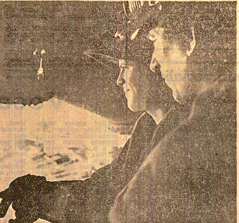
O nouă șarfă la furnalul II al Combinatului siderurgic Hunedoara.

Grupaj realizat de C. CARLAN, S. CERBU, Gh. MANEA, N. CATANĂ, C. IFRIM