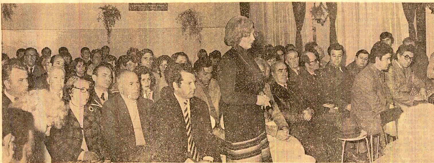
Formă concretă de manifestare a democrației socialiste, larg folosită în campania electorală: întîlnirile între alegători și candidații Frontului Democrației și Unității Socialiste. În fotografie: instantaneu de la o astfel de manifestare, organizată în circumscripția electorală nr. 46 din sectorul 4 al Capitalei

cuprinde în componența sa: ● Consiliul oamenilor muncii de naționalitate maghiară ● Consiliul oamenilor muncii de naționalitate germană ● Consiliile oamenilor muncii de naționalitate sîrbă din județele Timiș și Caras-Severin. ● Consiliul oamenilor muncii de naționalitate ucraineană din județul Suceava