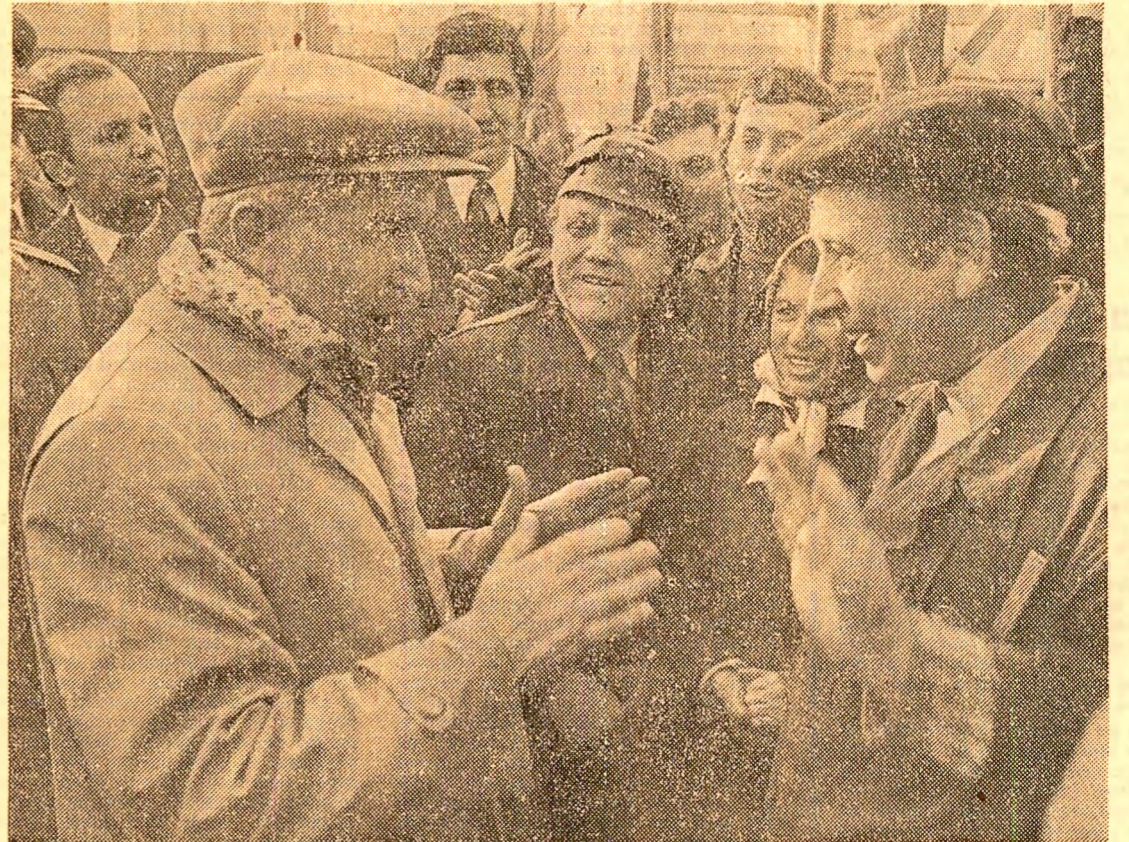
O discuție cu muncitorii de la Întreprinderea de utilaj greu din Brăila, în toamna anului 1981

Devenit în acești ani o caracteristică esențială a vieții noastre politice, dialogul conducerii partidului și statului cu poporul și-a găsit o expresie elocventă în frecvențele vizite de lucru ale tovarășului Nicolae Ceaușescu în toate județele țării, în numeroasele congrese, conferințe, consfătuiri, la nivel central sau local, cit și în dezbaterile publice a principalelor proiecte de legi.